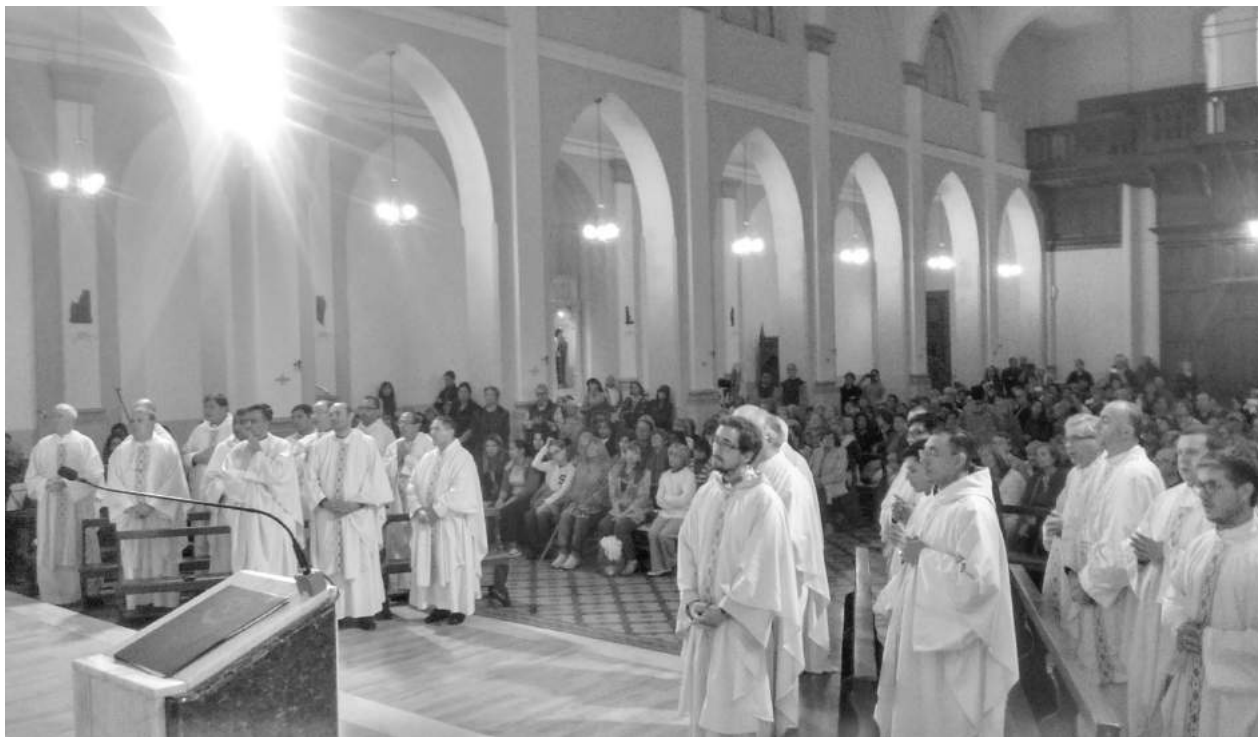
Sacerdotes de la Diócesis en el momento de la renovación de sus votos sacerdotales.