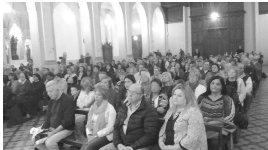
Fieles y sacerdotes de la Diócesis participaron de la Misa Crismal.

10:30 hs. Celebración para niños (Catedral) 18:00 hs. Patricios