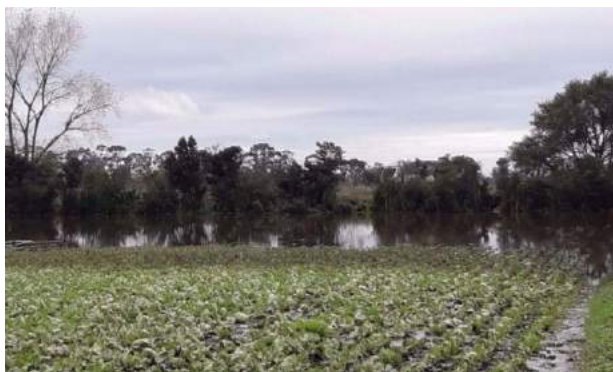
Los campos quedaron tapados de agua.

Desde el viernes la situación es crítica en la zona de Laguna de los Padres. El dirigente rural Ricardo Velimirovich apuntó a las culpó a las autoridades municipales por abrir las barreras hidráulicas.