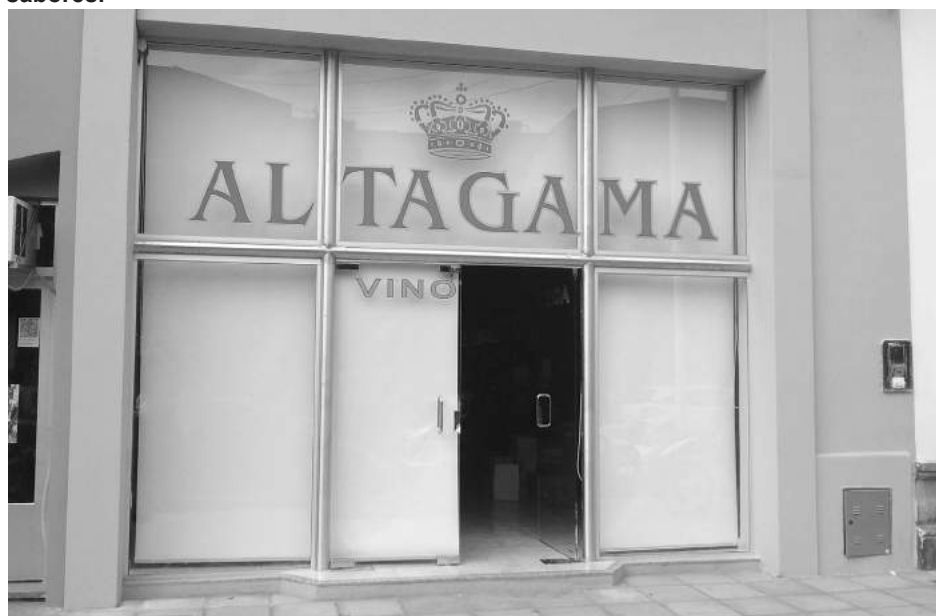
Frente del nuevo local de Alta Gama ubicado en calle La Rioja 1432.

un ansiado sueño como es el de contar con un espacio más amplio y confortable para su amplia y distinguida clientela. "Este nuevo local cuenta con más de 200 m2., lo que nos permite exponer una gran