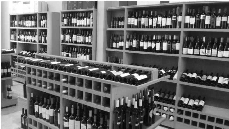
Vista de la moderna vinoteca donde se pueden apreciar las distintas marcas y sabores.

La vinería "Alta Gama", que en la jornada de hoy inaugurará su nuevo local comercial en calle La Rioja 1432, casi Robbio, y el día jueves atenderá al público en sus nuevas instalaciones, vive un momento muy especial, concretando