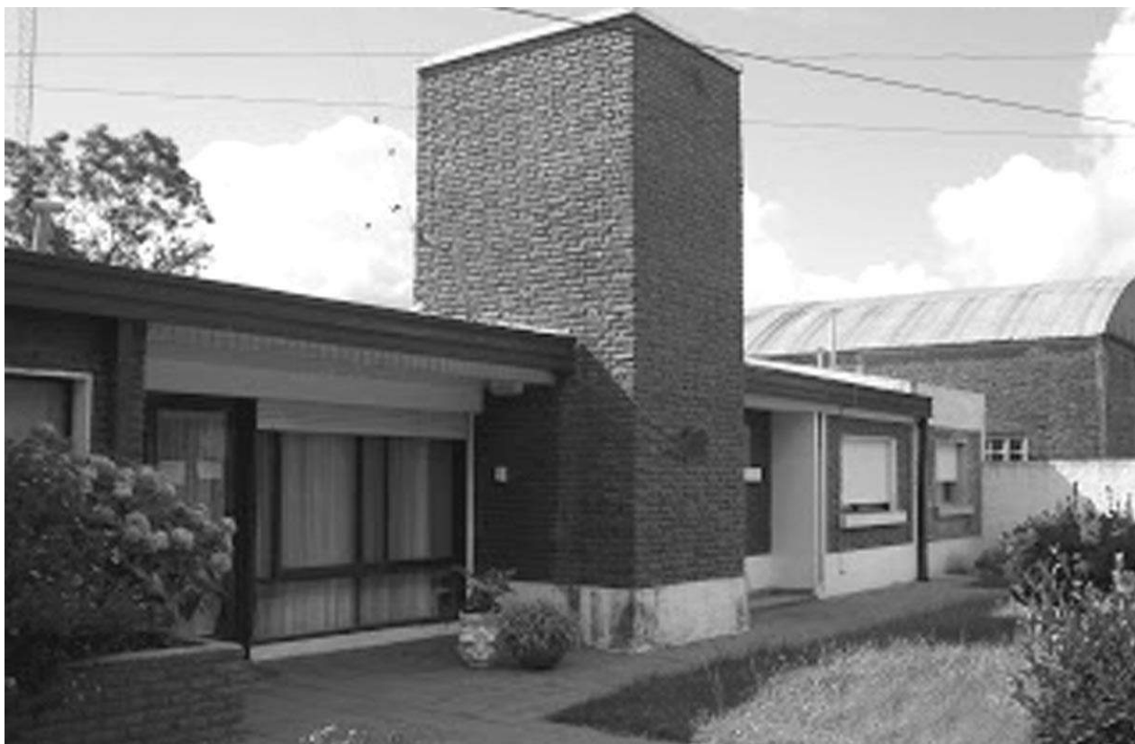
Vista del frente del nosocomio, pilar de la salud en la comunidad de Facundo Quiroga.