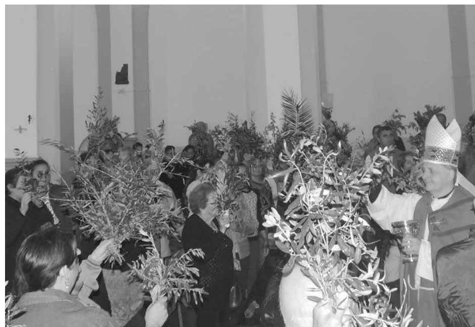
Debido al mal tiempo, la bendición de los ramos se realizó dentro de la Catedral.