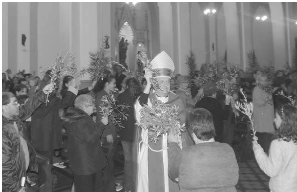
Preciso momento en que el Obispo realiza la bendición de los ramos.