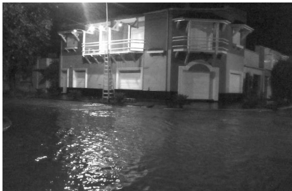
Calles tradicionales anegadas. Elocuente imagen de Libertad y Tucumán.

El caso más complejo obligó a la evacuación de una joven de 20 años de edad y sus dos hijas (de 4 años y 20 días de vida respectivamente), quienes debieron ser evacuadas y trasladadas a un hotel de la ciudad por personas de Defensa Civil, Bomberos Voluntarios y la Secretaría de Desarrollo Comunitario. Asimismo, otras 15 per-