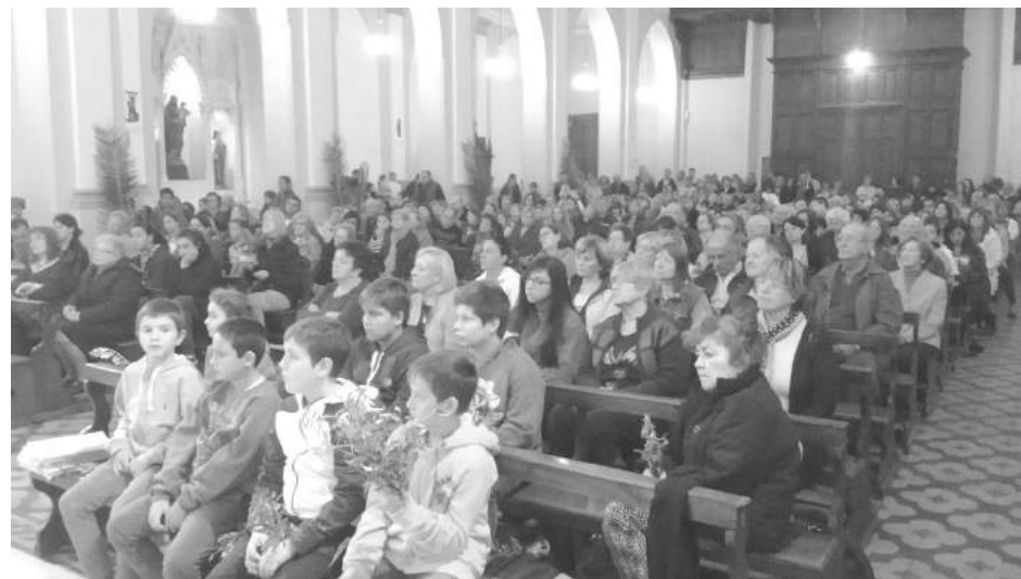
Importante concurrencia de fieles a la misa realizada ayer a la mañana.