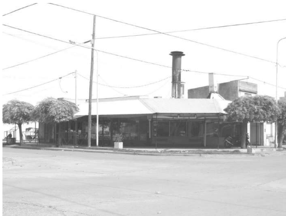
Importante cantidad de mercadería sustrajeron del local sito en San Martín y Lagos.

"Ingresaron por una claraboya de respiración del local, y quien ingresó debe