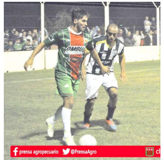
chales que tiene un partido más. Ahora, el "sojero" deberá medirse ante De- fensores de Ramallo como visitante, el próximo domingo a partir de las 16 horas.