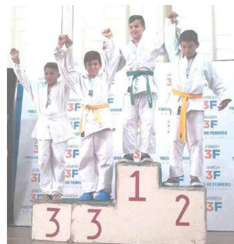
Muy buena actuación tuvo la delegación del Club Atlético 9 de Julio en el Torneo Apertura organizado por la Federación de Judo de la

Provincia de Buenos Aires, realizado el fin de semana pasado en la ciudad de Caseros, en el Gimnasio Islas Malvinas, donde se realiza la mayoría de los certámenes provinciales.