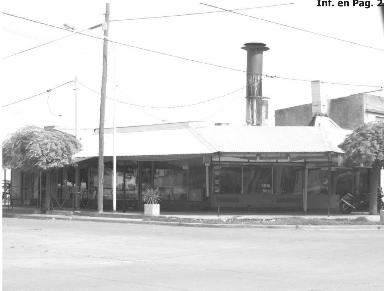
Vista del local de comidas que fue visitado por malvivientes en la jornada de ayer.