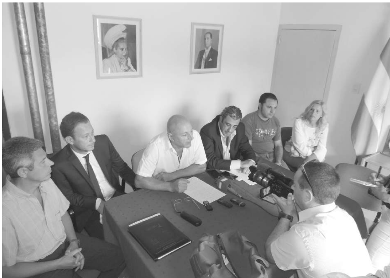
En rueda de prensa se dio a conocer la denuncia por extorsión del ex funcionario municipal.