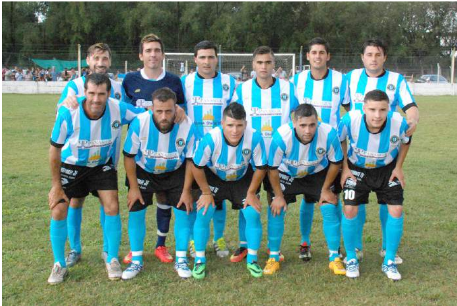
Atlético San Martín.