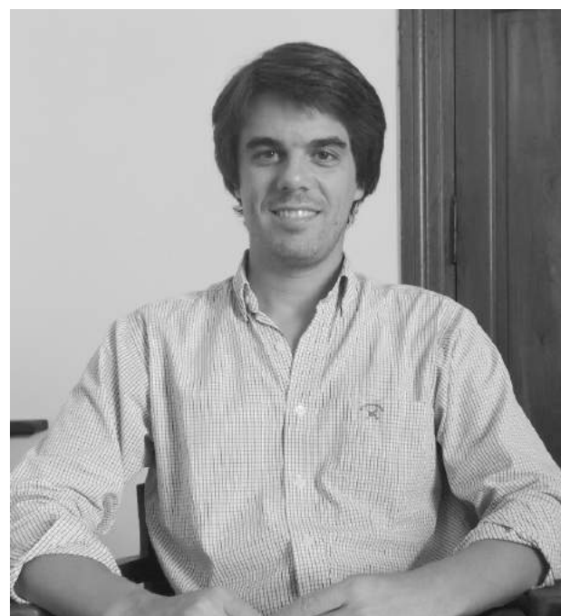
El edil en diálogo con nuestro medio.

"También sigue trabajando en la licitación de las 25 viviendas de Barrios Los Aromos, cuya licitación ha