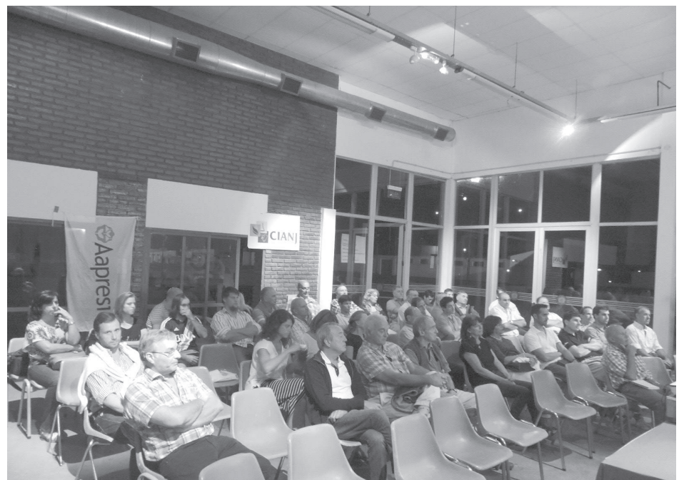
Productores que asistieron a la primera charla del año.