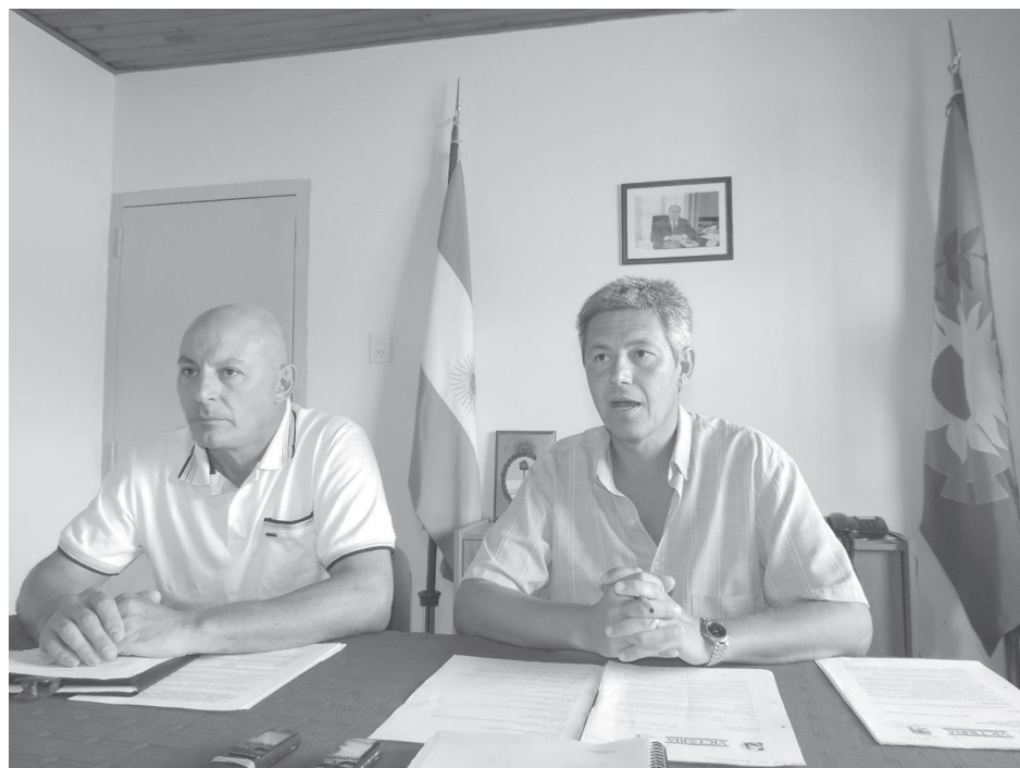
Los concejales esperaban una respuesta del Intendente ante una reunión mantenida ayer.

Asimismo, el dirigente justicialista subrayó que “la responsabilidad es del Intendente Municipal, quien puede delegar funciones, pero no justamente responsabilidad”, marcando que además “transcurridos dos meses de la presentación