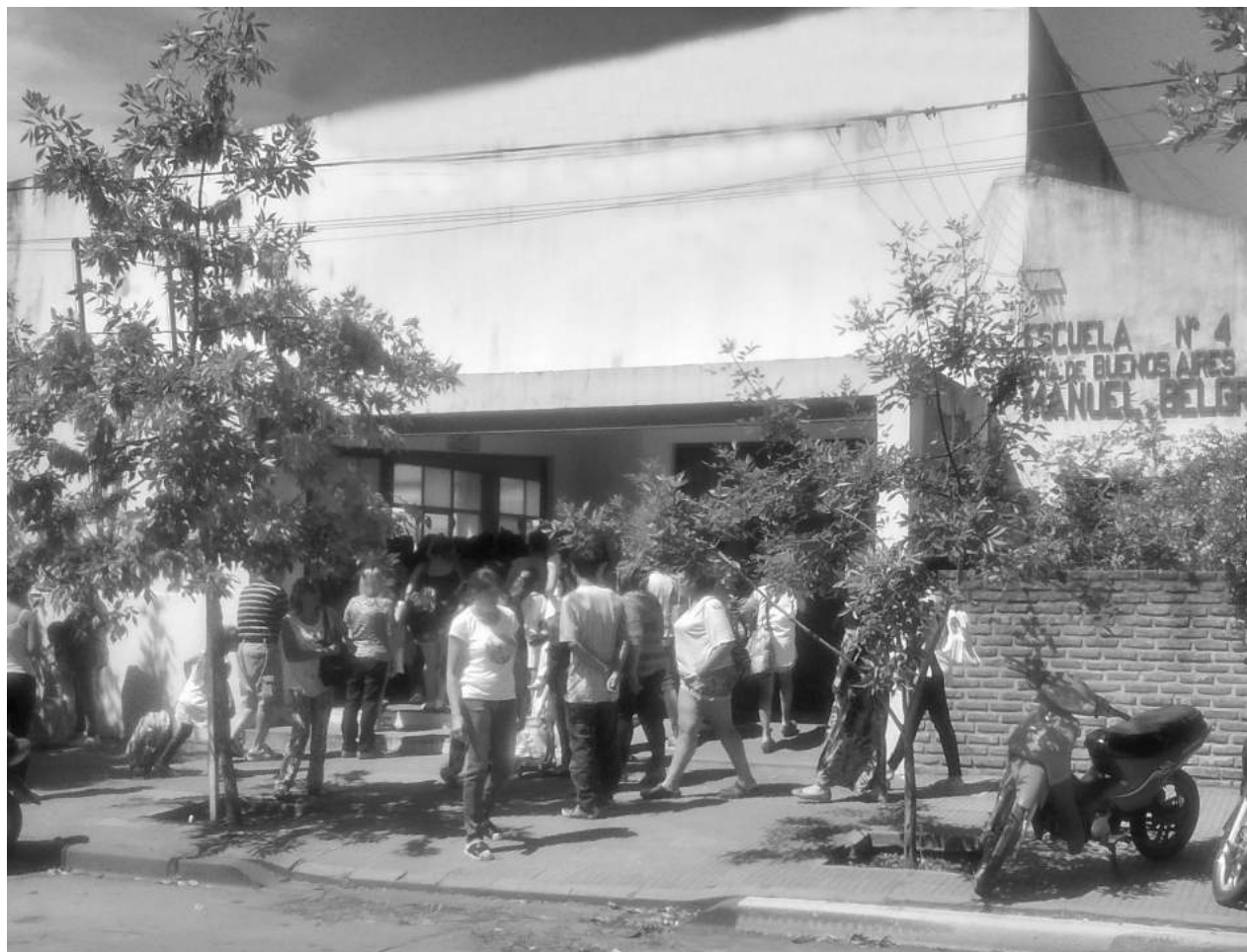
Tras la "amenaza" del gobierno de descontar el día de paro, los docentes decidieron dar clases.