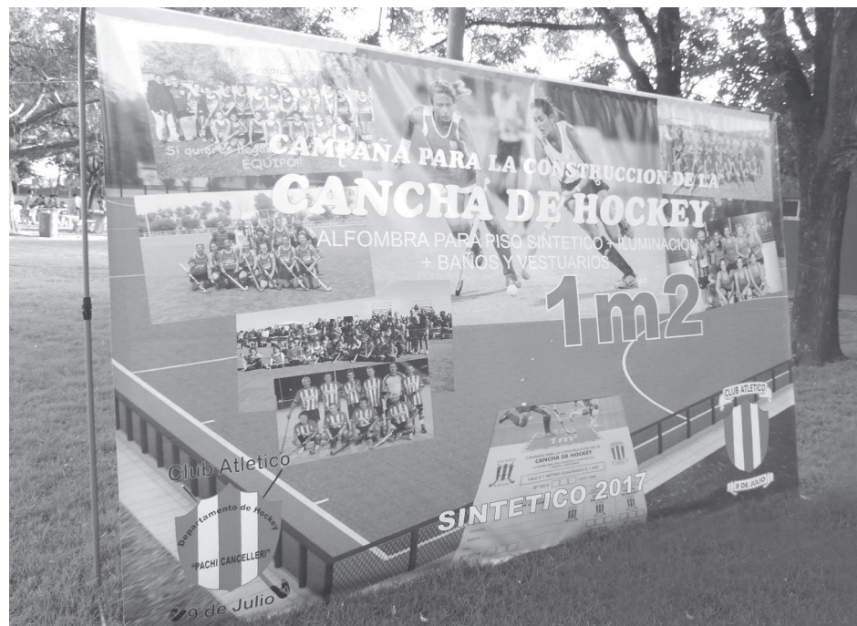
Banner que promociona la nueva campaña para la cancha de hockey.