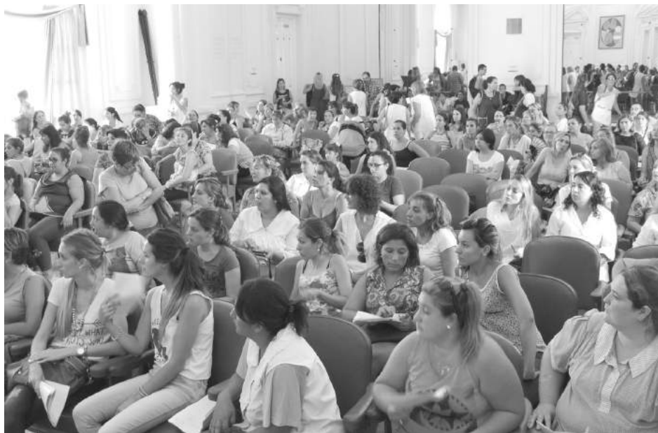
Docentes que participaron del 1er. Acto Público del año 2017.

En la mañana del pasado viernes, se desarrolló en el Salón Blanco del Palacio Municipal local el primer acto público para docentes provisionales y suplentes, de acuerdo a las titulariza-