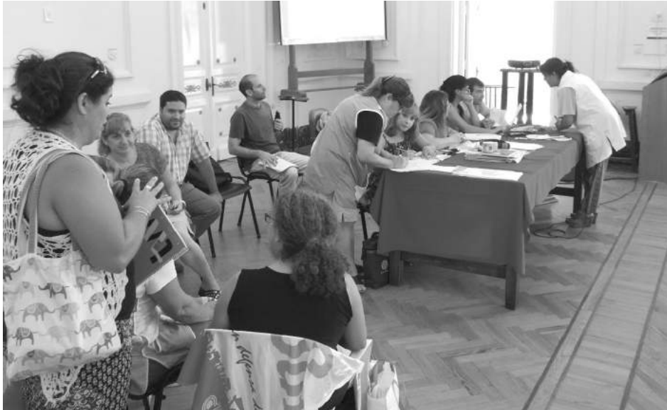
Autoridades de Asuntos Docente, Inpoectoras y gremios docentes presentes.

Se desarrolló el viernes el primer acto público