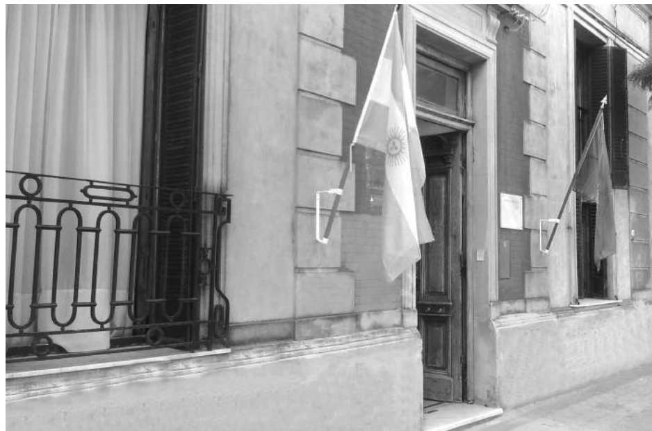
Gran parte de la carte de Educación se trasladó a la nueva sede.

ron completando distintas etapas, efectuándose tareas de división de los ambientes, en tanto se aguarda un subsidio de la Provincia para efectuar la reparación de los techos y llevar adelante nuevos sanitarios y un sector de cocina". Por otra parte, respecto del espacio que ocupa la Asociación "Amigos del Espacio", señaló que la entidad continuará realizando sus actividades en la terraza del edificio.