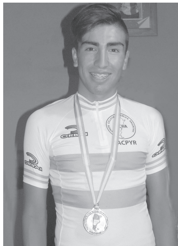
El joven ciclista luce orgulloso su medalla, obtenida en el nuevo campeonato ganado en Córdoba.