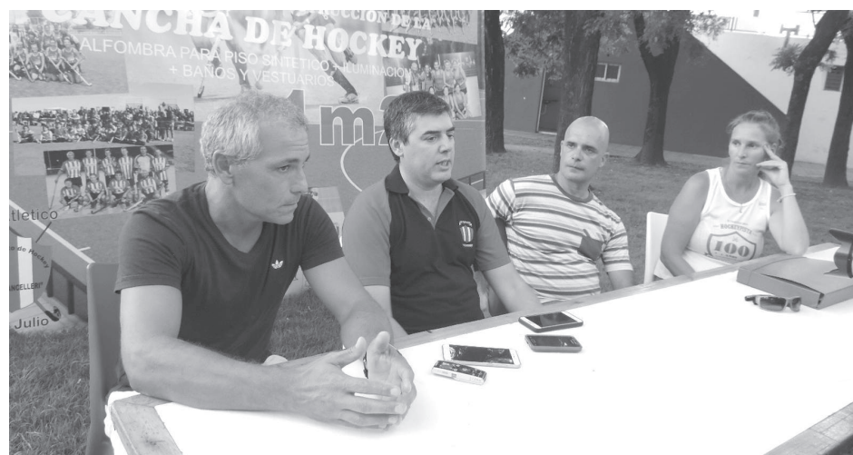
Autoridades de Atlético 9 de Julio y directivos de hockey, en rueda de prensa.