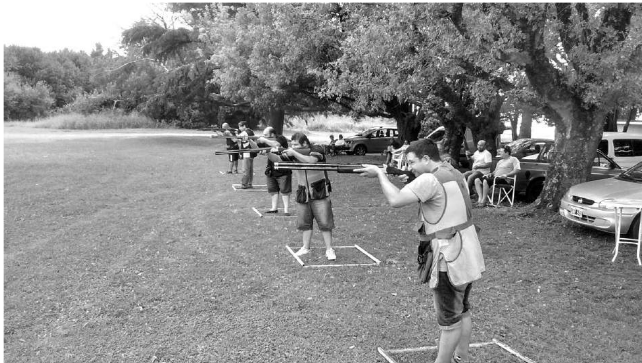
Competidores de 9 de Julio y la zona.