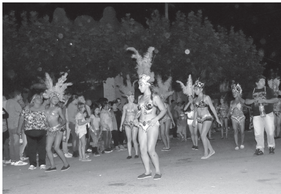
La batucada Marimba de 9 de Julio con sus bailarinas, en plena actuación le imprimió ritmo y alegría a la noche de corsos en French.