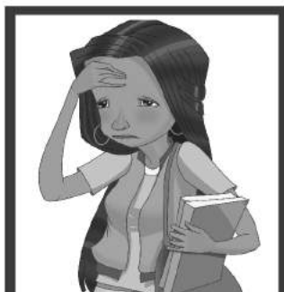
Dolor de cabeza o detrás de los ojos.