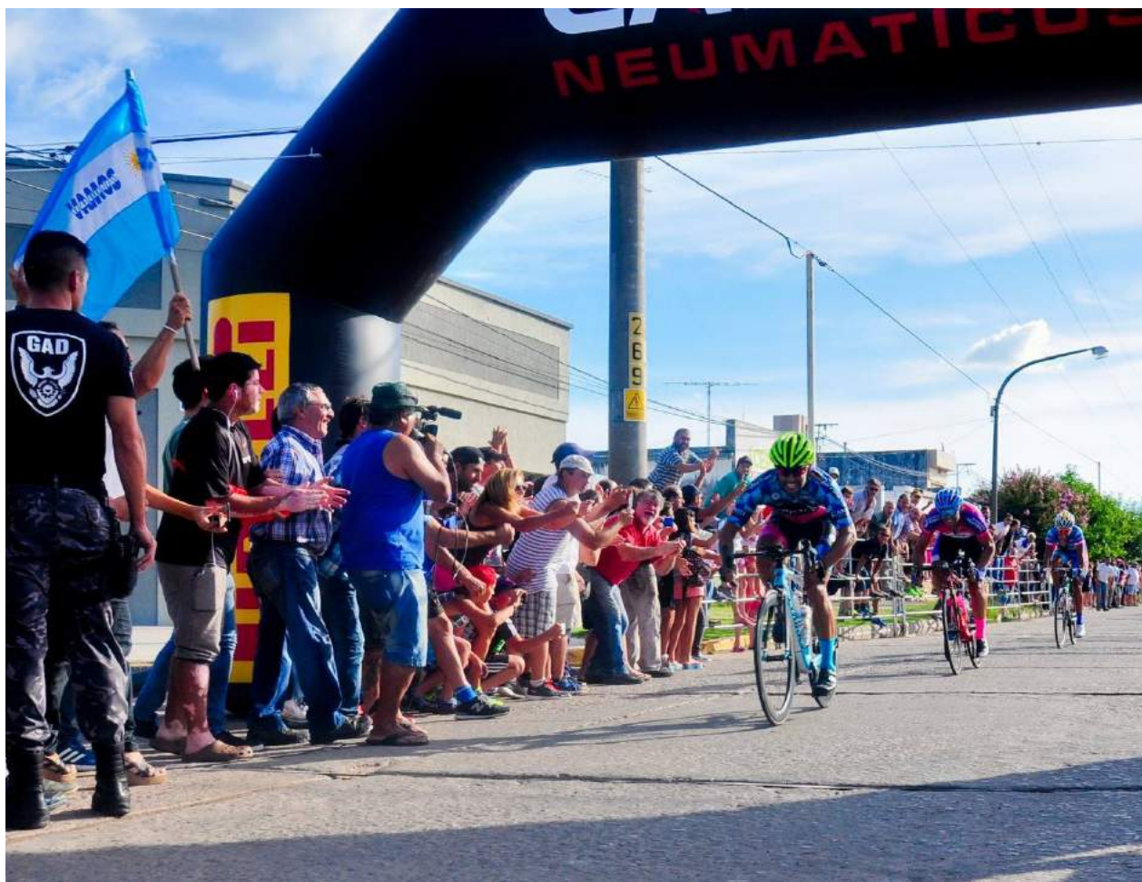
Como cada año, el público acompañó el paso de los ciclistas.