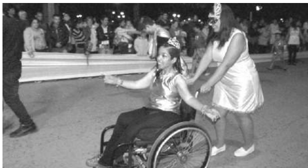
Una de las postales de "Haciendo Bulla", en plena acción.