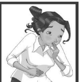
Náuseas o vómitos.