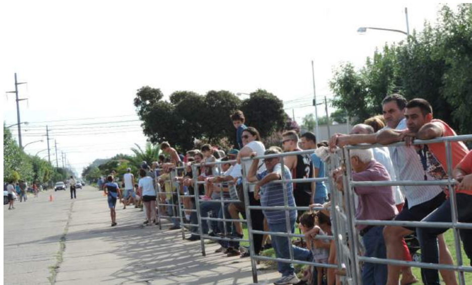
Una multitud disfrutó del espectáculo y acompañó el evento.