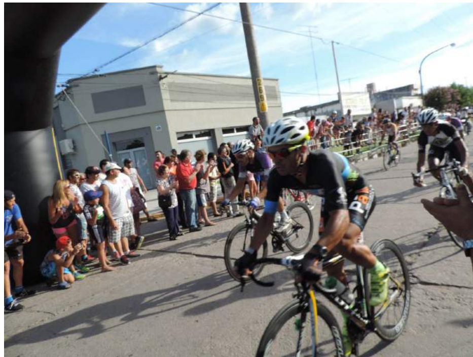
Ciclistas arribando al arco frente a la sede de FC Libertad.

La 82ª edición de la Doble Bragado - Copa Banco Provincia, tradicional competencia bonaerense llevada adelante por el Club Ciclista Nación y la empresa Imagen