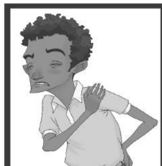
Dolores musculares, articulares o de espalda.

Si tenemos alguno de estos síntomas, no nos automediquemos y consultemos a un médico.