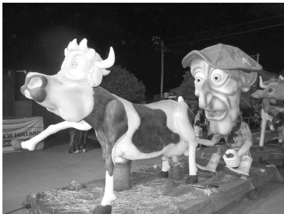
para una mejor atención del numeroso público que se cita en la localidad.

Asimismo, nuestra interlocutora destacó que se contará con dos cantinas de importantes dimensiones