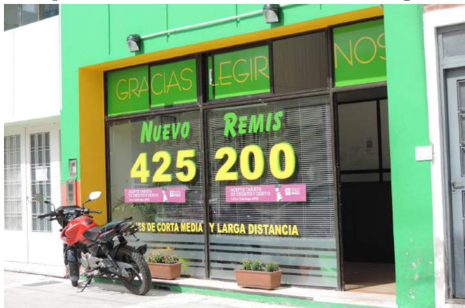
Frente del nuevo local de "Nuevo Remis".

La agencia de Remises 4-25-200, que el año pasado se viera afectada por un voraz incendio que afectó a los locales comerciales ubicados en la intersección de Avda. Vedia y Cavallari, superando numerosas dificultades, ha logrado encarar una nueva etapa para la prestación de su servicio -caracterizado por la seriedad y responsabilidad-, en su nuevo local de Avda. Vedia 560, junto a la agencia de PAMI.