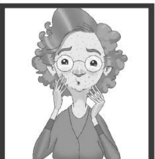
Erupciones o conjuntivitis.