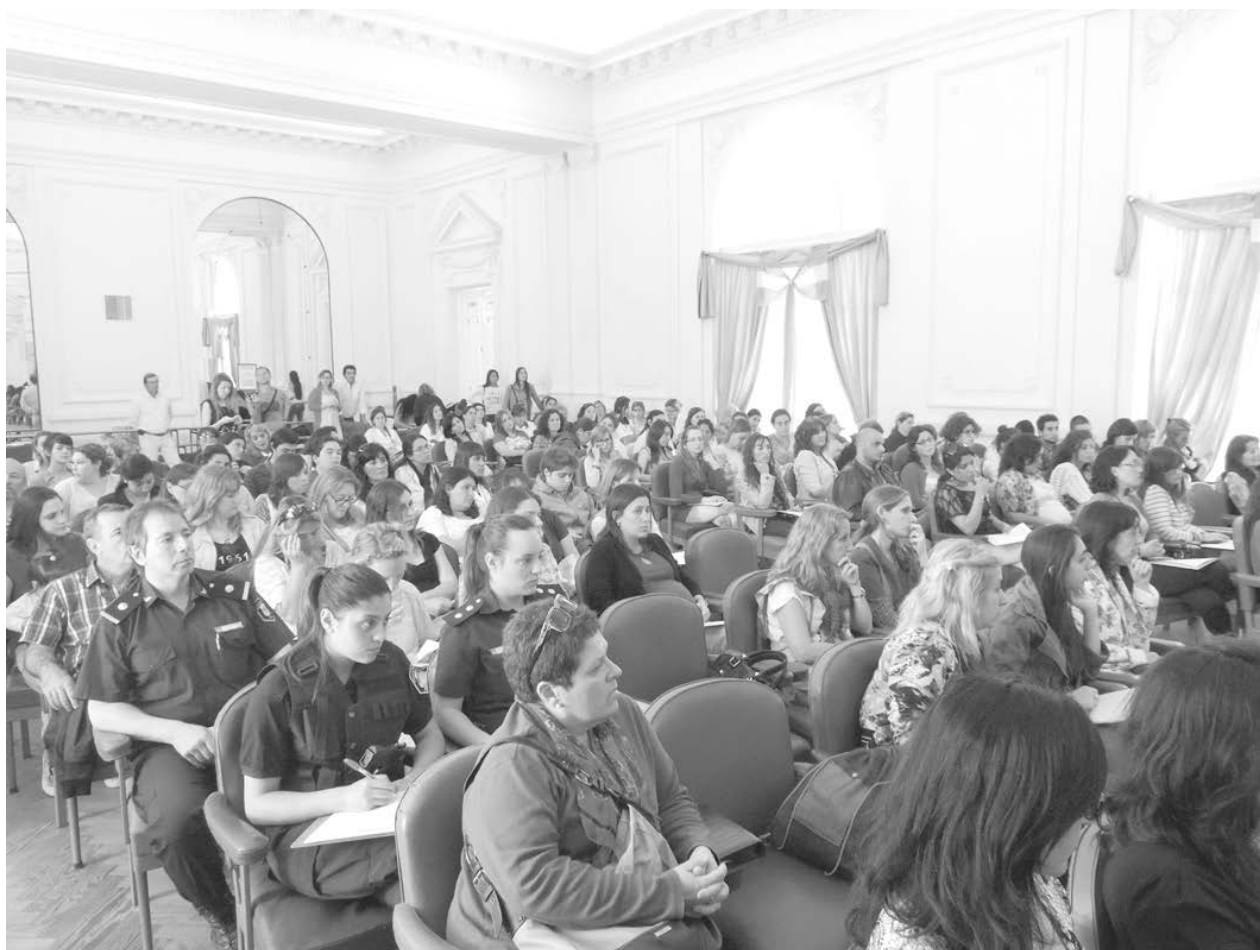
Asistentes a la importante jornada desarrollada ayer en el Salón Blanco.