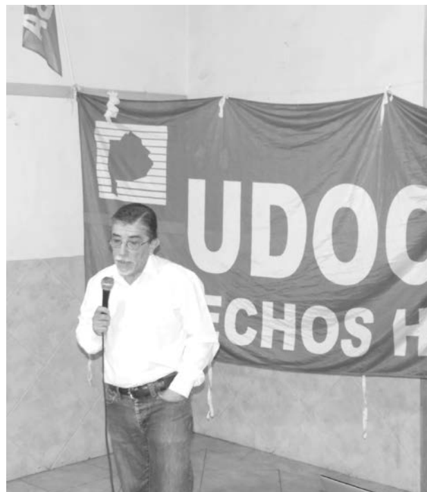
Importante capacitación sobre adicciones realizó UDOCBA.

talmente a la prevención de adicciones.