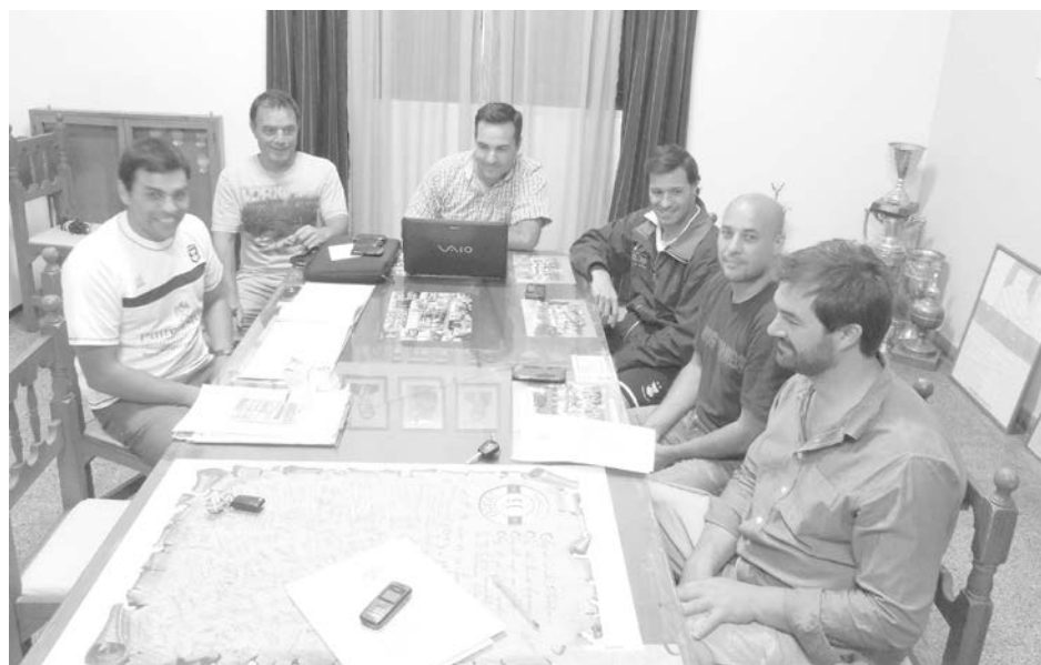
Integrantes de la Comisión del club y profesores adelantaron lo que se viene.