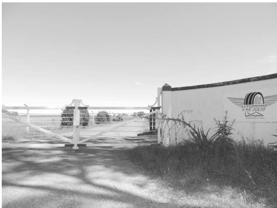
“El Coloso” descansa y espera su futuro inmediato,