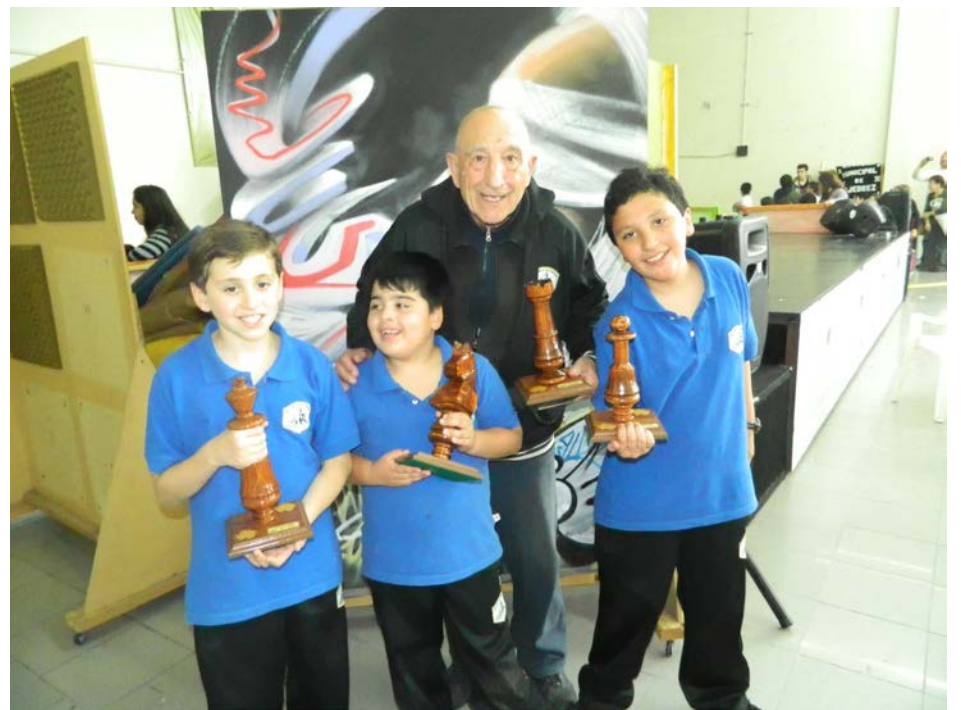
Los jugadores muestran los trofeos ganados.

Es de destacar que en esta categoría, los jugadores deben enfrentar a rivales de las categorías sub 18 y mayores en donde