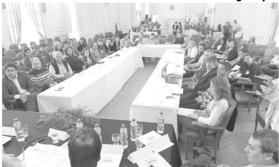
Importante concurrencia a la jornada de producción.