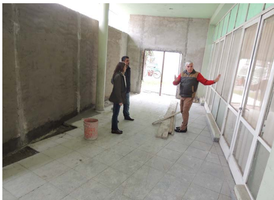
El Intendente recorre las obras.