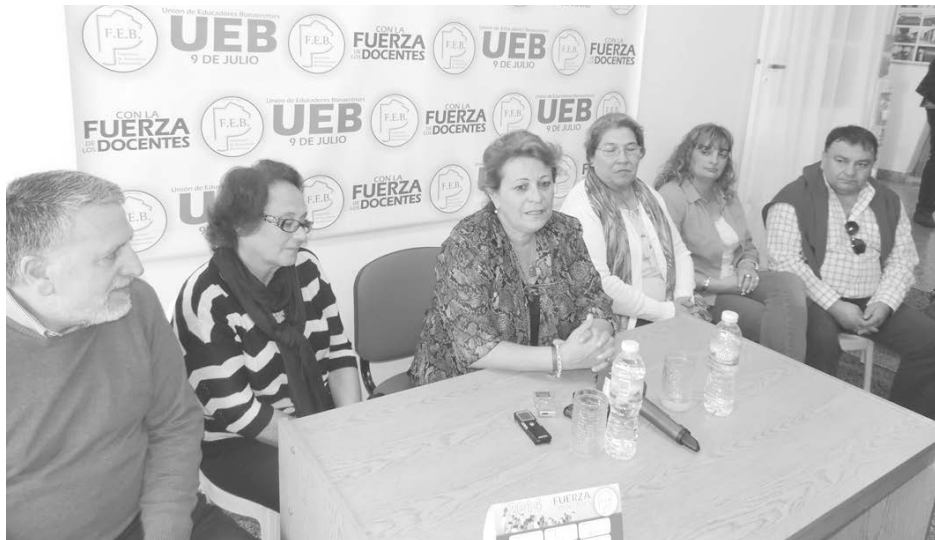
En conferencia de prensa las autoridades de FEB detallaron la actualidad.

La titular de FEB valorizó el trabajo que realiza la “Escuela Gremial” de la entidad.