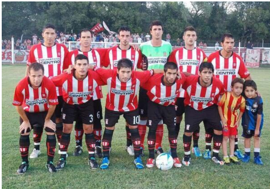
Plantel de Atlético 9 de Julio.

El resto de la fecha se juega el domingo, a las 15,30 hs.