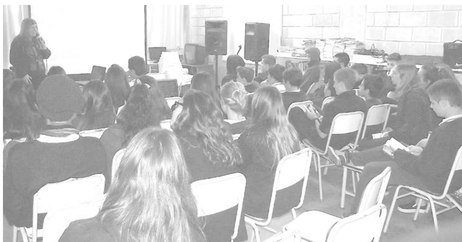
Alumnos junto a la docente y escritora disertante.