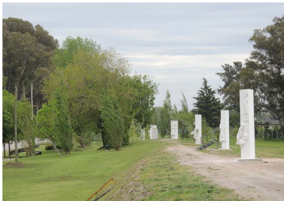
Vista del predio del Vía Crucis.

Días atrás, el Intendente Municipal de 9 de Julio, Dr. Walter Battistella, visitó la sede de la Universidad Popular "Arturo Illia", donde se llevan adelante importantes obras de ampliación de la misma, que comprende la construcción de nuevas aulas, que ampliarán la capacidad de la misma, posibilitando albergar a mayor cantidad de alumnos nuevas capacitaciones. Por otra parte, el jefe comunal nuevejuliense