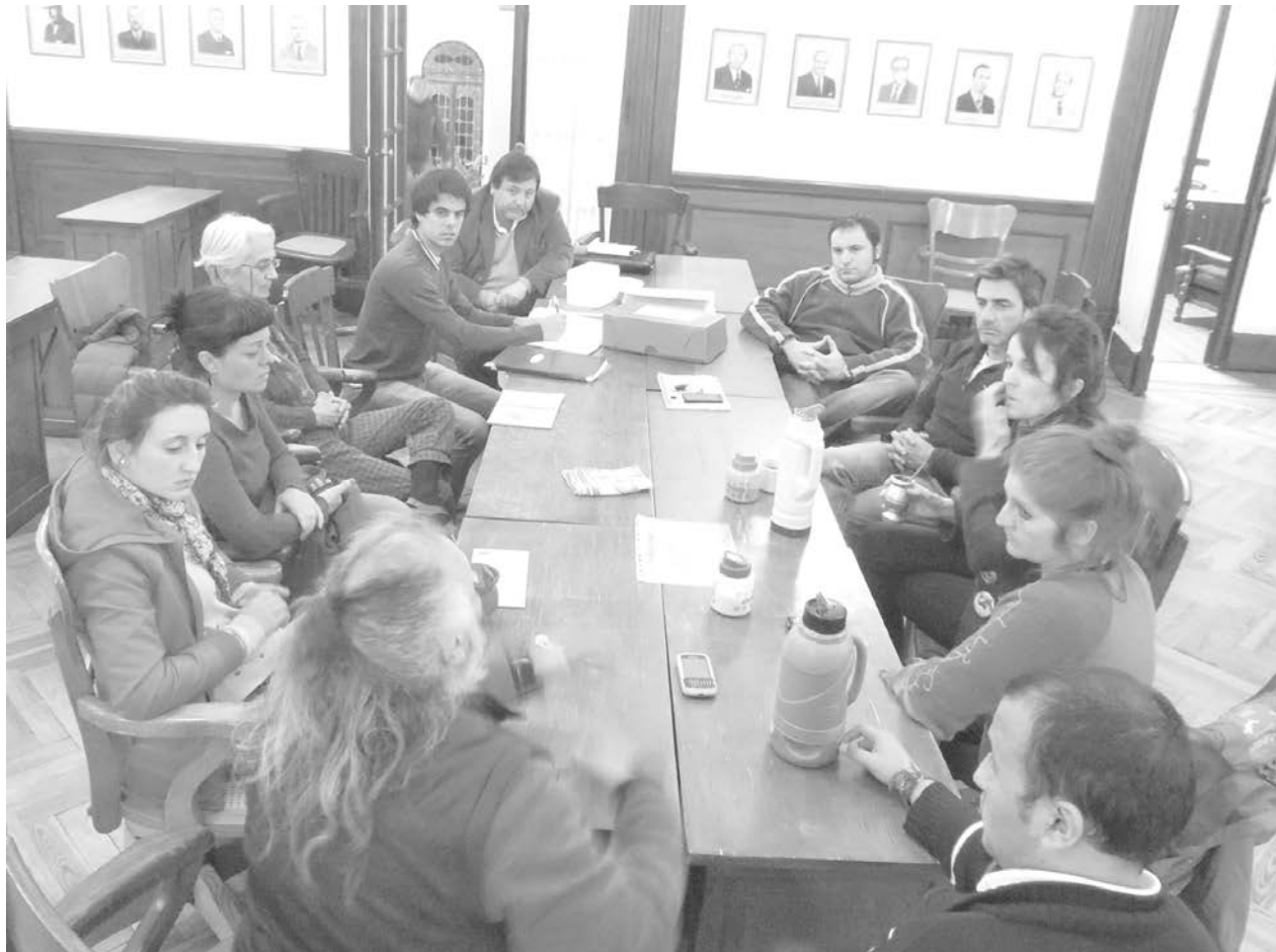
Concejales que integran la comisión de Cultura reunidos con los grupos de teatro.

Los grupos solicitaron apoyo económico y la participación de los mismos en la trascendente instancia. Inf. en Pág. 2.