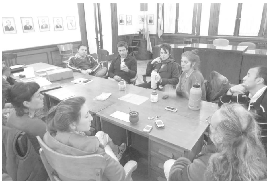
Importante reunión realizada el pasado martes en el HCD.