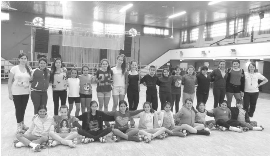
Uno de los grupos de Super Patín, posan para la foto.

Este próximo domingo, entre las 15 y 18 hs., y con el objetivo de acercar a los padres de las alumnas, el grupo de Super Patín de Centro Empleados de Comercio —que arriba a sus 25 años de ininterrumpida labor—, llevará adelante una