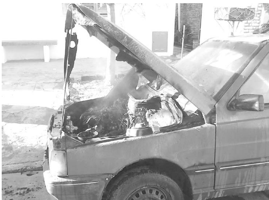
Personal de Bomberos trabajó para sofocar el incendio en la parte delantera del auto.