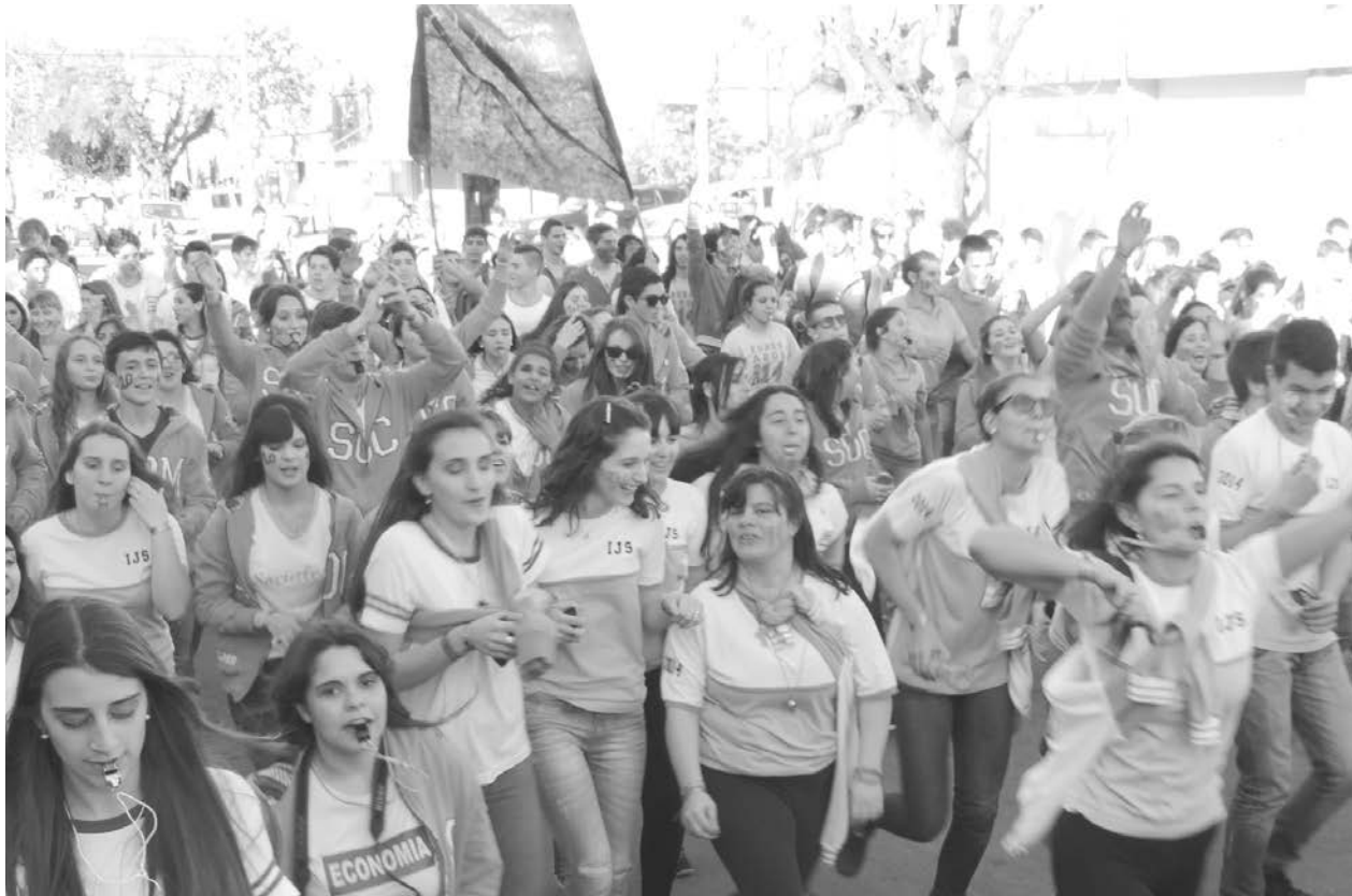
Toda la alegría y las ganas de la puesta en marcha de la Promo 2014.

Una intensa tarea del personal policial y de tránsito impidió el ingreso de motocicletas y bebidas alcohólicas, para que todo se desarrollara con absoluta normalidad y en clima de fiesta.