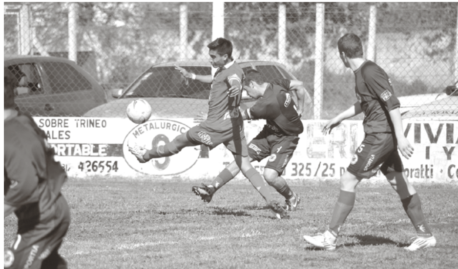
El Granate fue más y lo volcó en la red.

Millonarios y Albinegros consiguieron una victoria y volvieron a la cima de la tabla - San Agustín goleó a Agustín Alvarez.