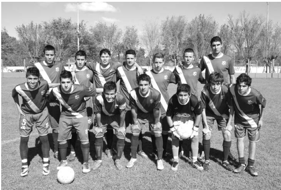
Quinta División de Once Tigres.