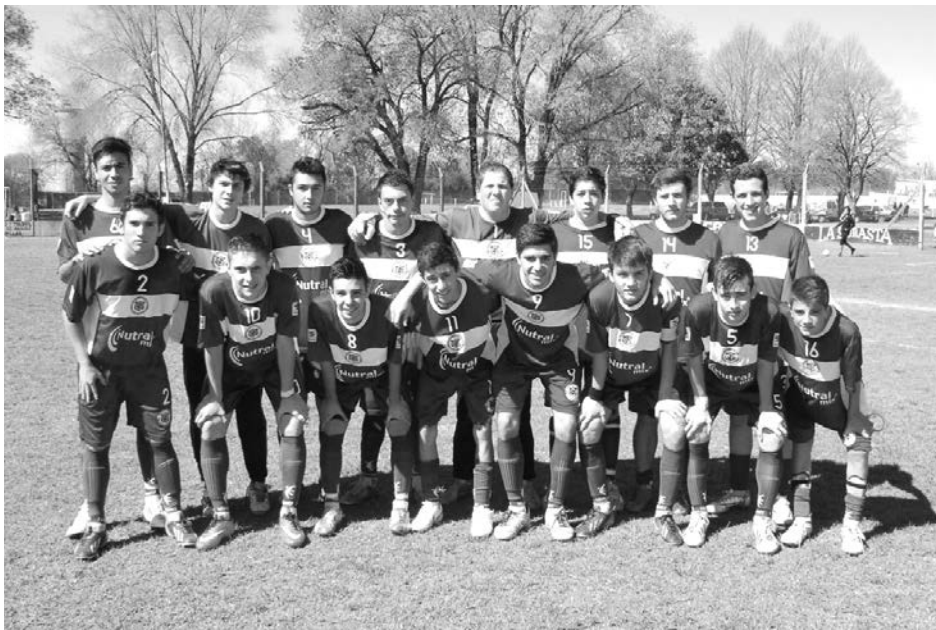
Quinta División de Deportivo San Agustín.