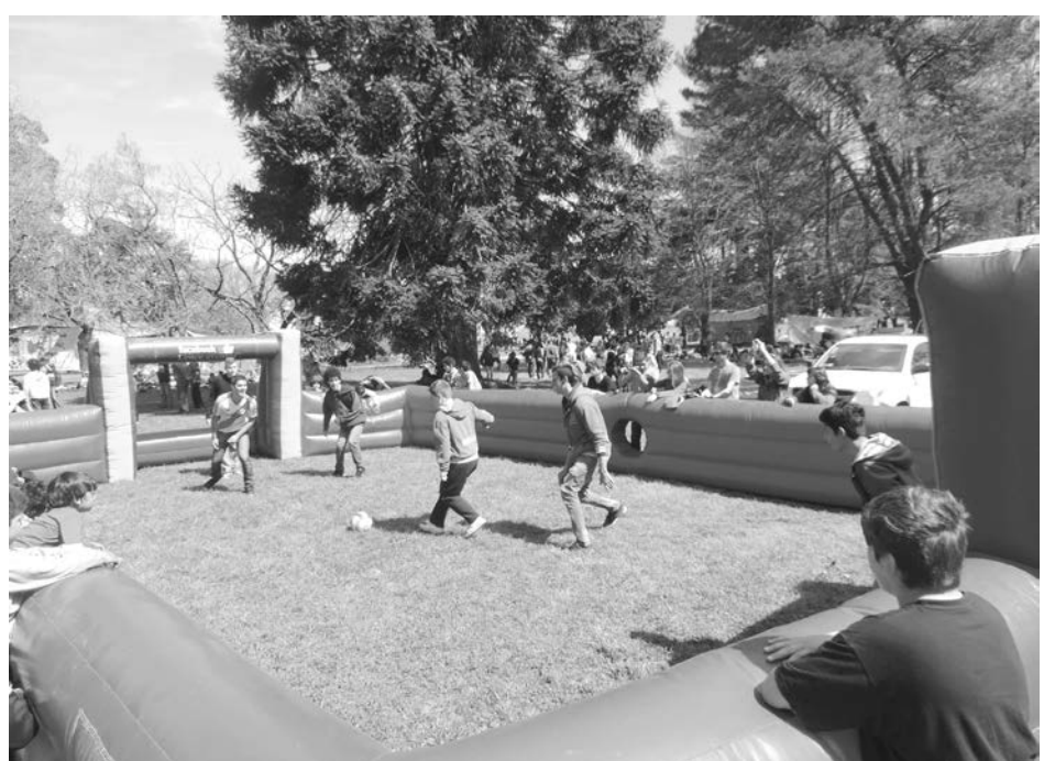
El "fulbito" también presente para los más habilidosos.