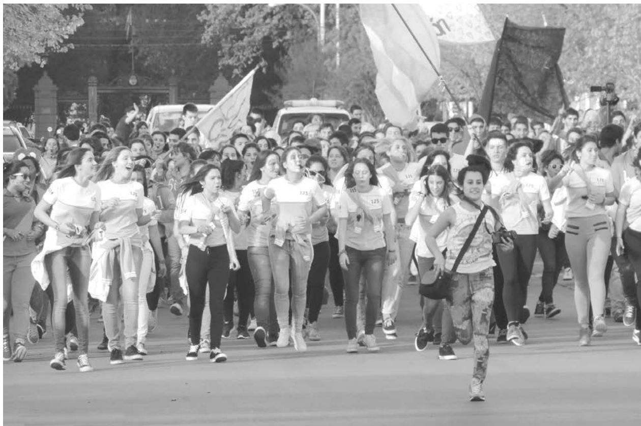
La Semana de la Promo 2014 comenzó el sábado con la tradicional Marcha por las calles de la ciudad.