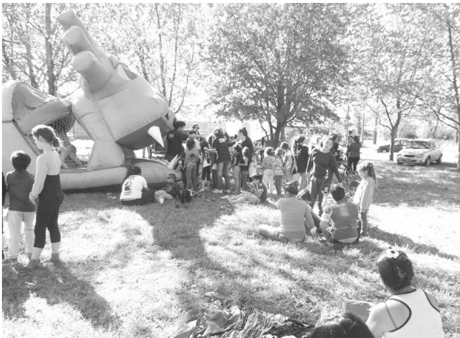
Niños y jóvenes disfrutaron de distintos juegos, música y refrigerios.

ORGANIZADO POR LA UNIDAD BASICA "JUAN DOMINGO PERON"