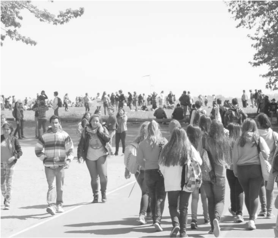
Miles de jóvenes llegaron con su vianda al aeródromo local.