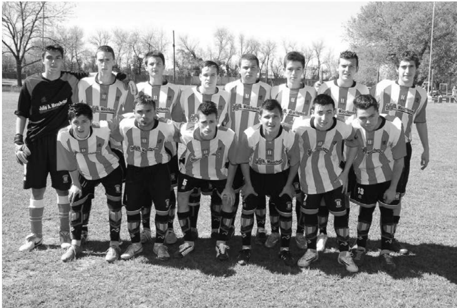
Quinta División de Atlético 9 de Julio.