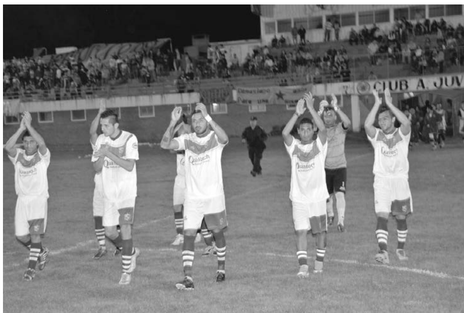
El plante saluda a los hinchas.