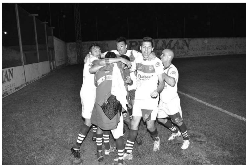
Todo Once Tigres celebra la igualdad.