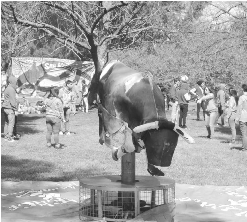
El toro mecánico espera el momento de su presentación en la jornada.