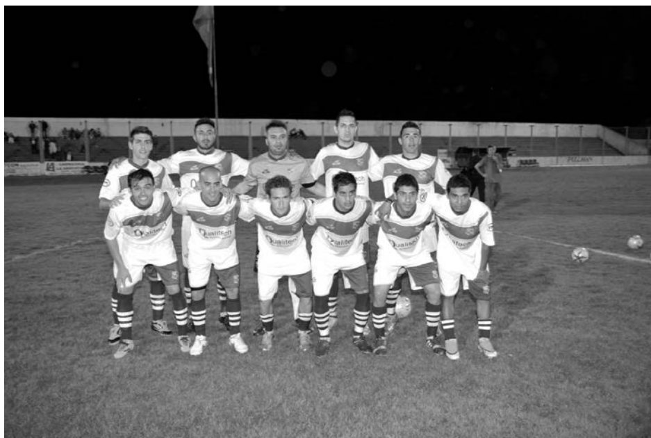
Once Tigres trajo un gran punto desde Pergamino.