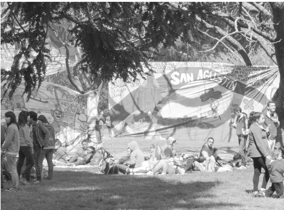
Juegos, mate y guitarra; y el evento animado musicalmente por "El Yeti" y en video Seba Videla.