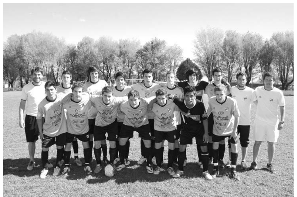
Quinta División de Atlético Quiroga.