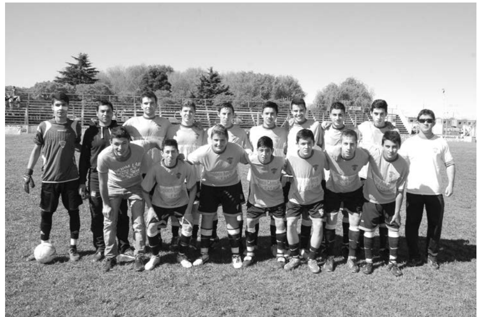
Quinta División de Atlético San Martín.