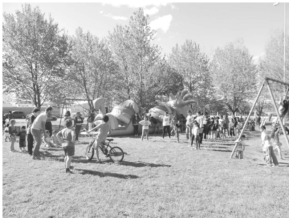
La Plaza de la Cooperación, elegida para festejar el inicio de la primavera.