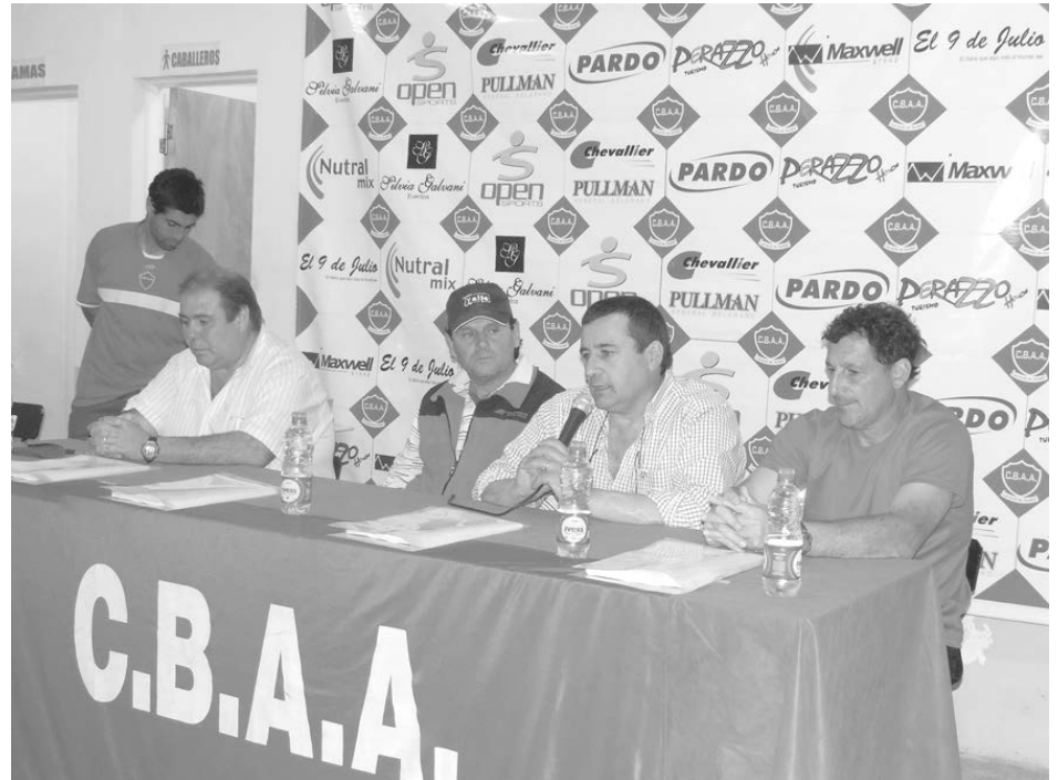
Autoridades del club y municipales dieron detalles del torneo.