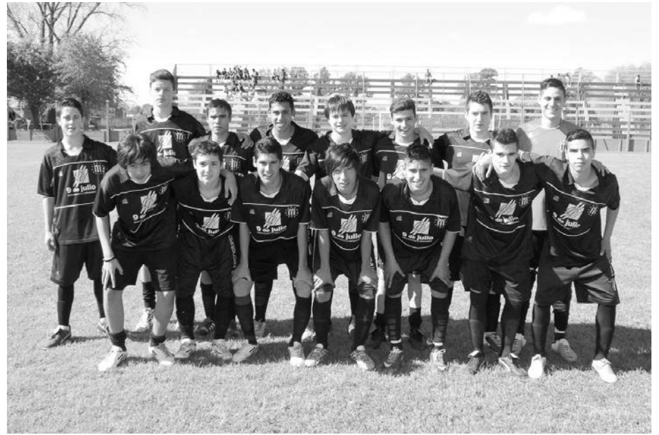
Quinta División de Atlético French.