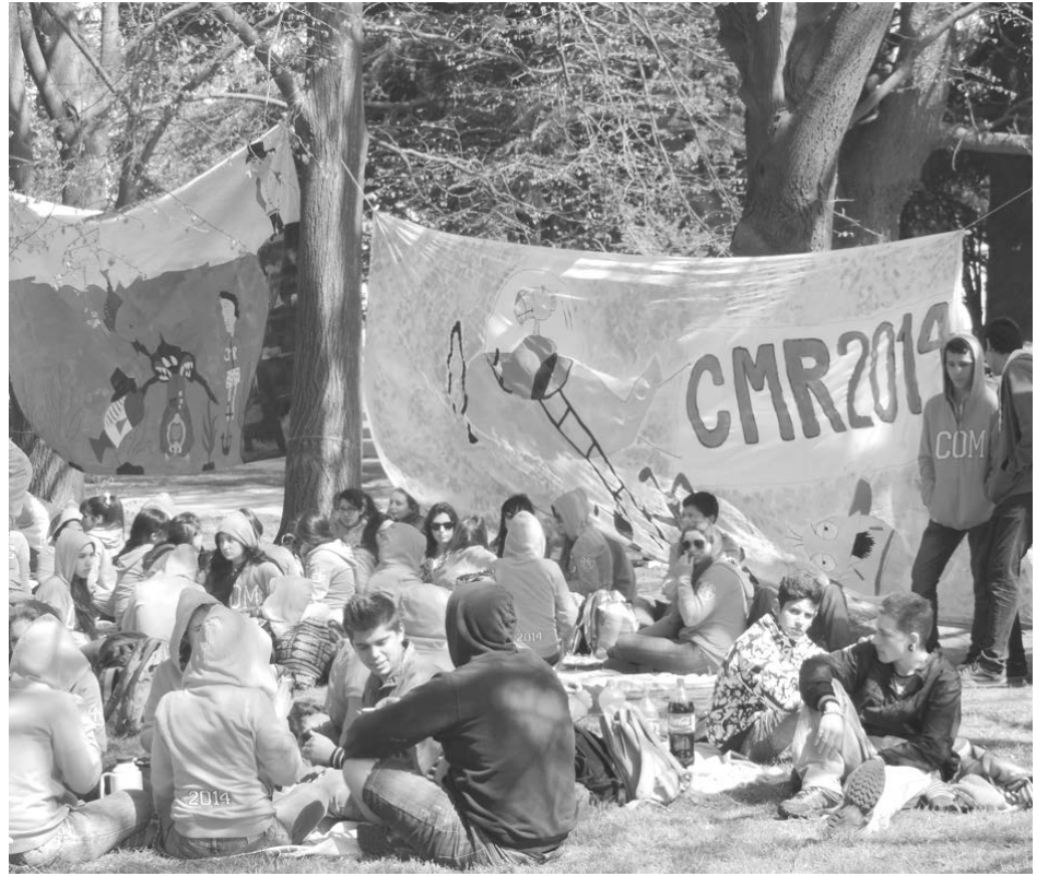
Cada grupo identificado con su bandera colgada.