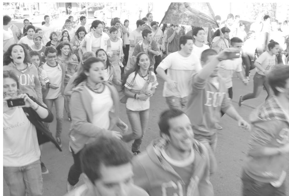
Estudiantes de los distintos establecimientos educativos disfrutaron de una semana distinta, llena de festejos y emociones.