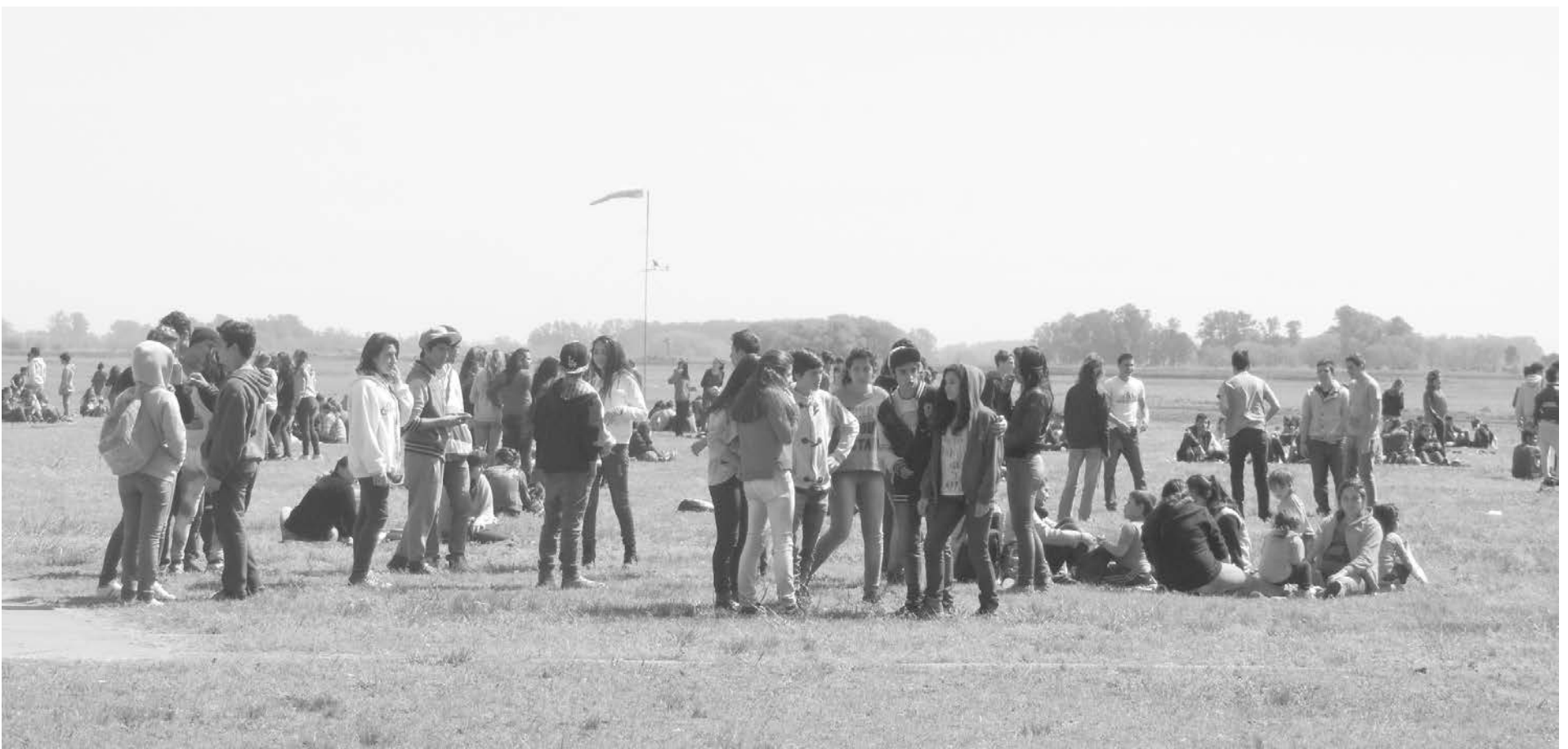
El Aero Club fue una vez más elegido por los jóvenes para la realización del pic-nic en la jornada de ayer.