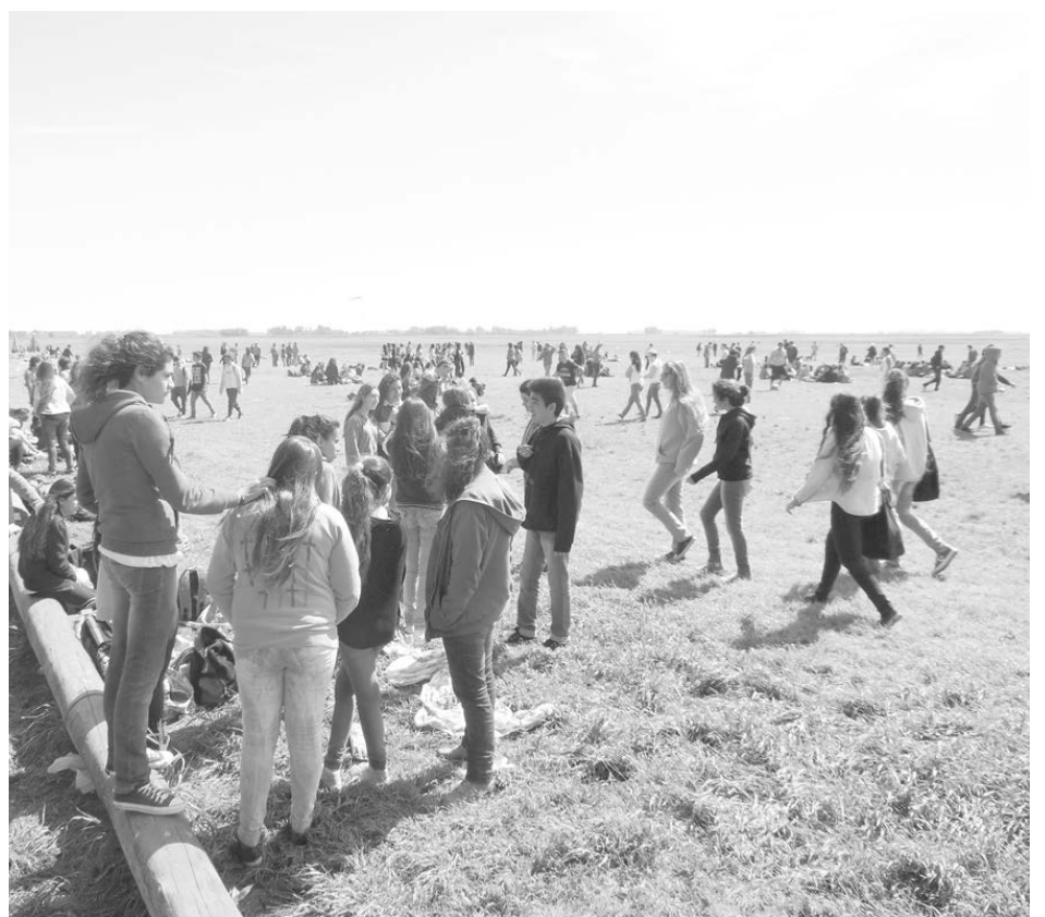
El campo totalmente ocupado por los chicos en un domingo primaveral.