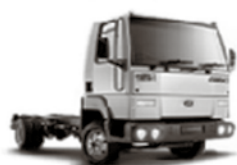
C 915 E

Cuotas fijas y en pesos. Aplicable a toda la línea cargo (**)