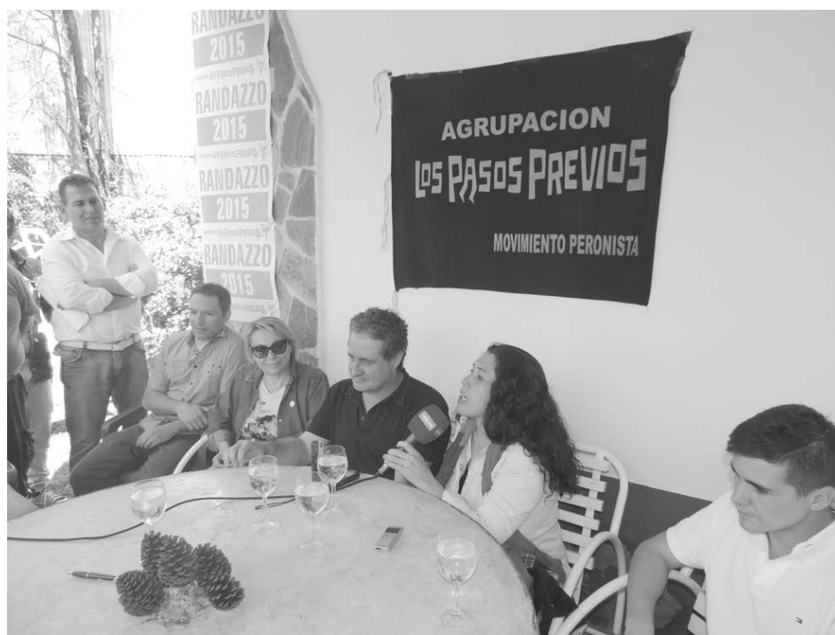
"Pasos Previos" se presentó el sábado en nuestra ciudad.