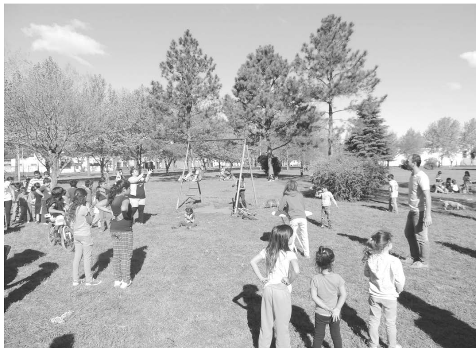
Integrantes de la U.B. "J. D. Perón" y jóvenes de La Cámpora animaron la jornada del sábado.