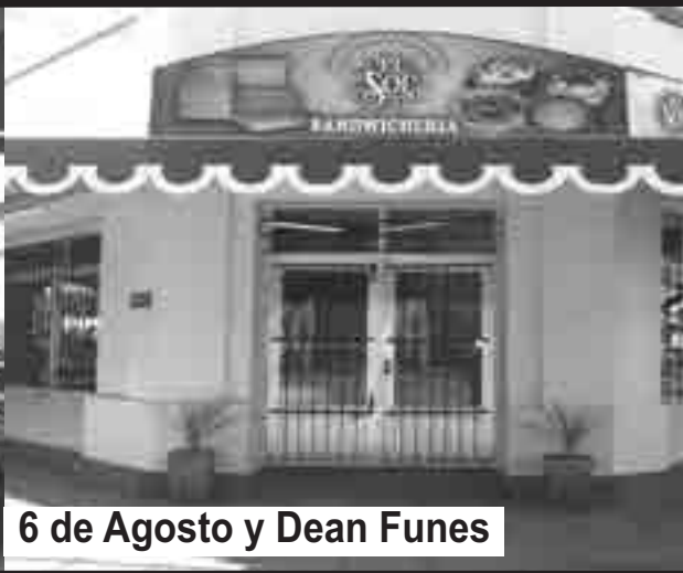
6 de Agosto y Dean Funes