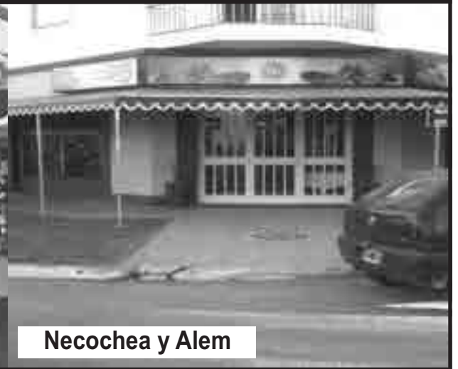
Necochea y Alem