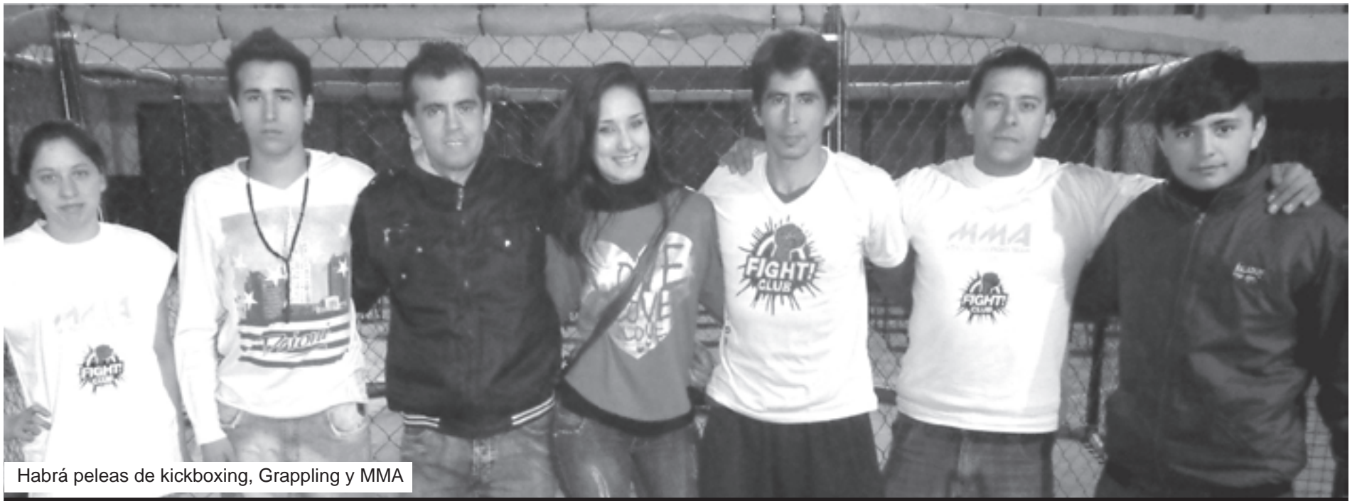
Habrà peleas de kickboxing, Grappling y MMA