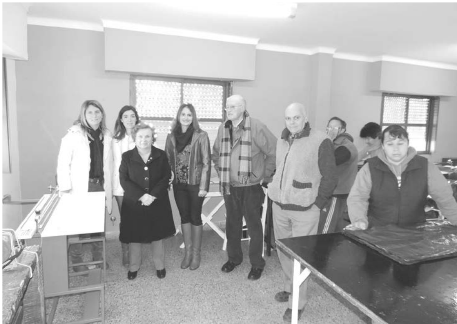
Autoridades del Club de Leones y del Taller junto a la nueva máquina donada.

El Taller Protegido recibió una nueva máquina para la producción de bolsas de residuos.