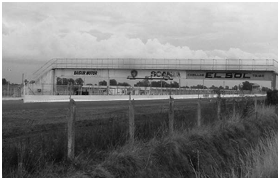
El "coloso" de la velocidad espera un futuro positivo para todos.