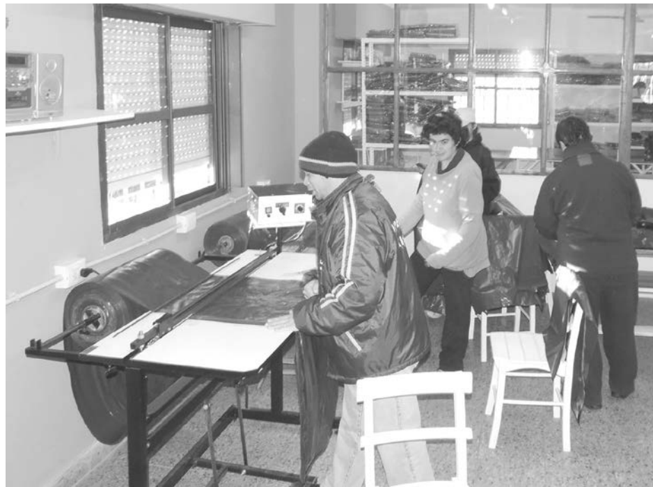
Este importante aporte ayuda a incrementar la oferta laboral.