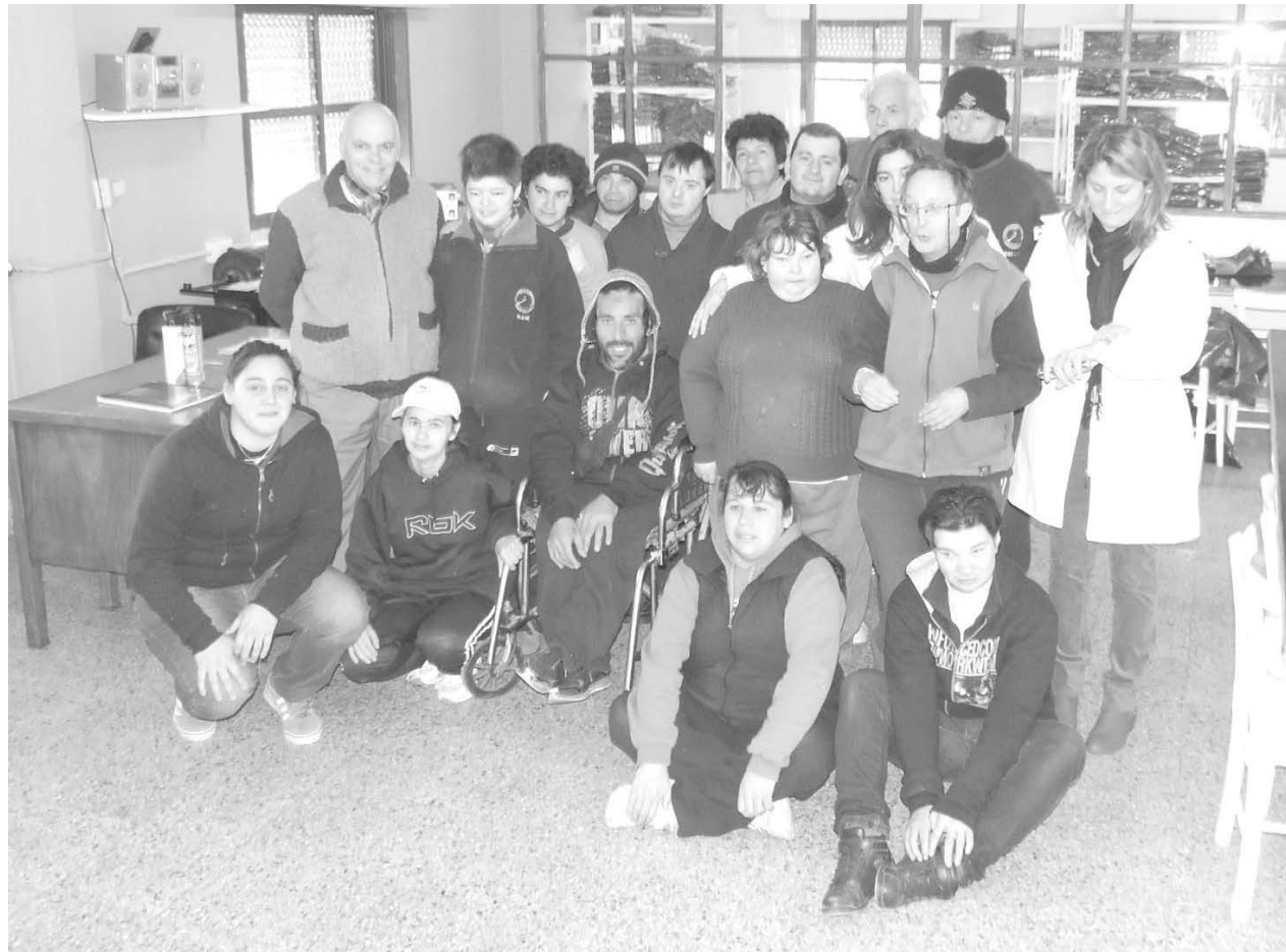
Operarios del Taller junto a integrantes del Club de Leones.

El Taller Protegido recibió una nueva máquina para la producción de bolsas de residuos. Inf. en Pág. 8.