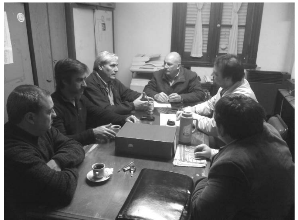
Concejales que integran la Comisión reunidos con el presidente de la Cámara de Comercio.

Por otro lado, se abordó el tema de la inseguridad que viven nuestros vecinos; sobre el particular se informó sobre la creación, dentro de la Cámara, de una comisión de trabajo de vecinos autoconvocados preocupados por la ola de asaltos. Al respecto como primer medida se confeccionará un mapa del delito, detallando todos los robos producidos en los últimos 2 años. Dado que una gran cantidad de ellos no son denunciados lo que impide habilitar la investigación penal. Los integrantes de la Comisión de Vecinos autoconvocados serán recibidos próximamente por el Concejo Deliberante próximamente.