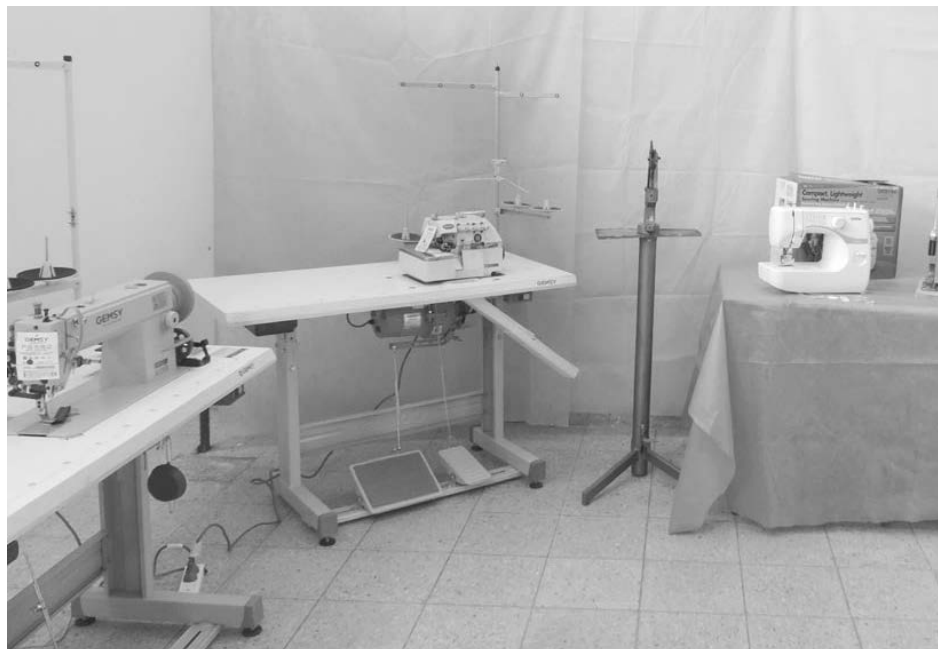
Maquinarias industriales entregadas en el día de ayer.

trabaja de aquí en más en áreas no explotadas, como lo que tiene que ver con diferentes artículos para vestir el hogar”.