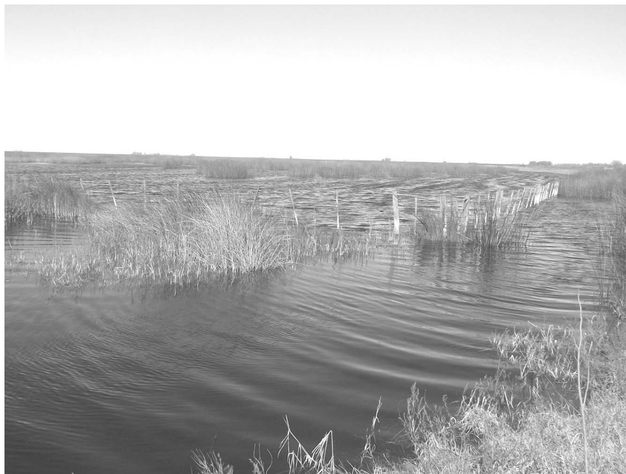
Importante masa de agua que se encuentra en campos cercanos a 12 de Octubre.

Se trata del sector de las localidades de Corbett y 12 de Octubre - Presumen que estarían ejecutadas por el distrito de Carlos Casares - Funcionarios y vecinos dejaron sus conceptos. Inf. en Pág. 2.