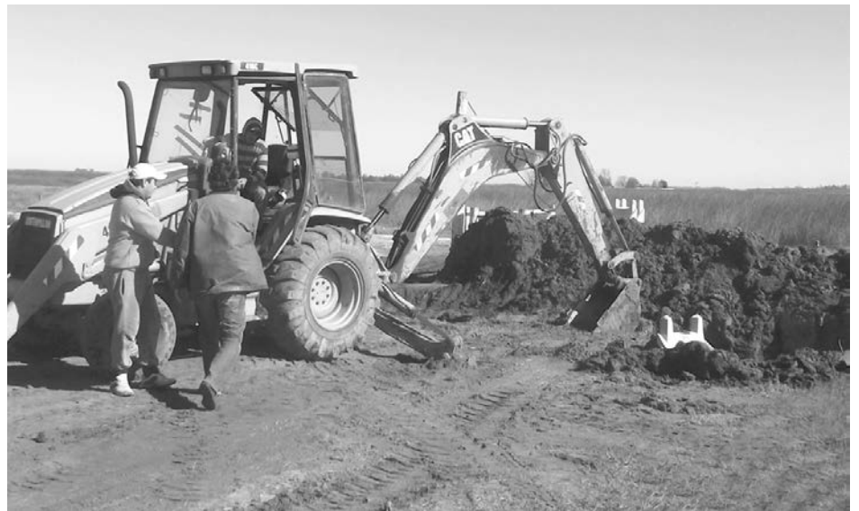
Maquinarias que trabajaban en el alcantarillado al límite de nuestro Partido.