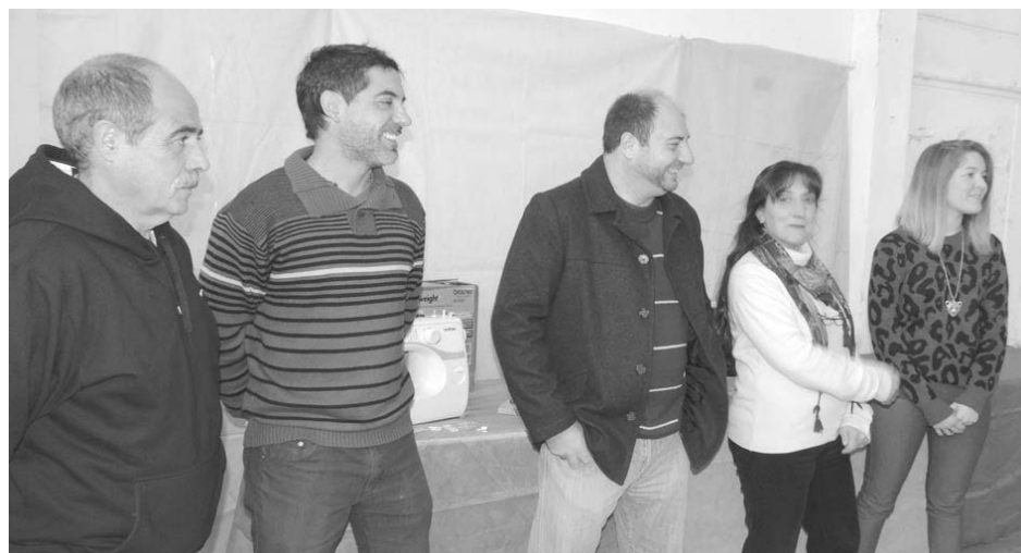
Integrantes de Desarrollo Social, Inspección, Consejo Escolar y el Centro de Formación Profesional Nro. 402 en el acto de entrega.