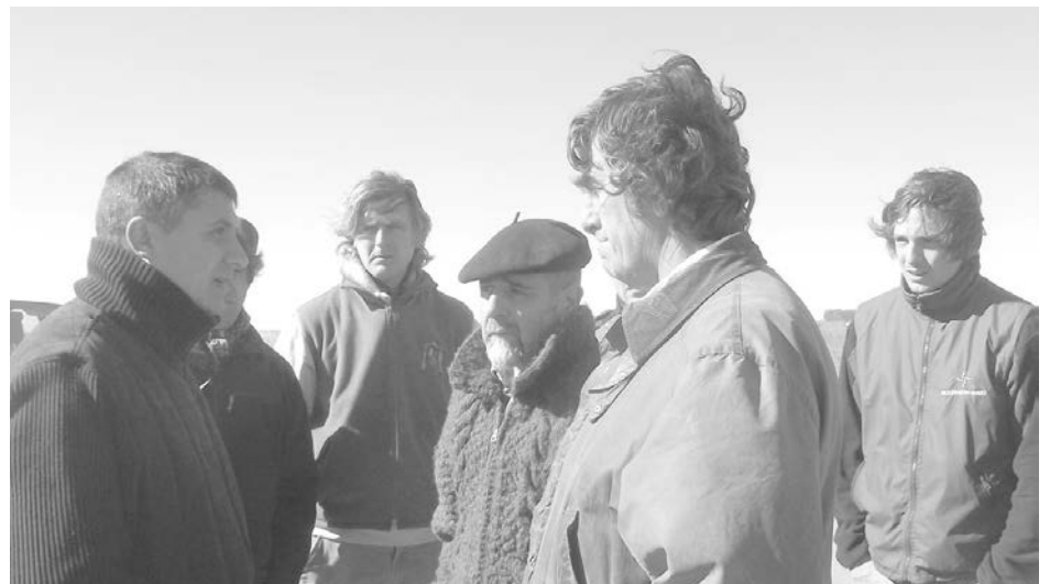
Autoridades y productores se hicieron presentes en el lugar.