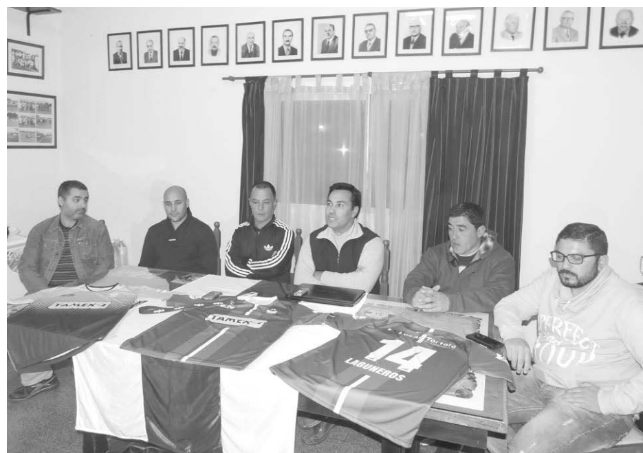
Las autoridades del Club desean participar del Torneo de Inferiores de la LNF.