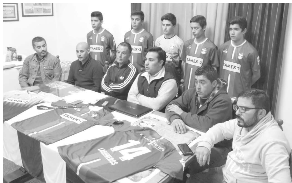
El Lagunero presentó la nueva indumentaria para su Quinta División.