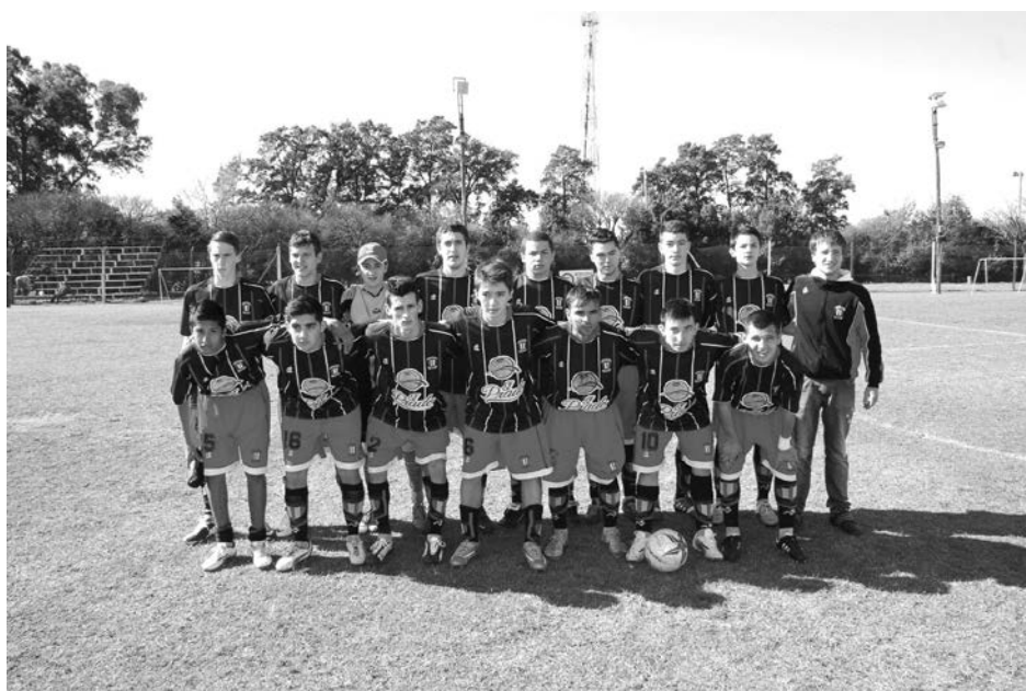
5ta. del Club Atlético 9 de Julio