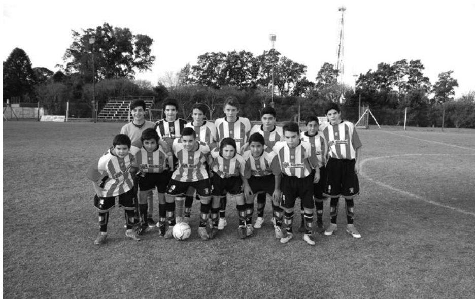
7ma. del Club Atlético 9 de Julio