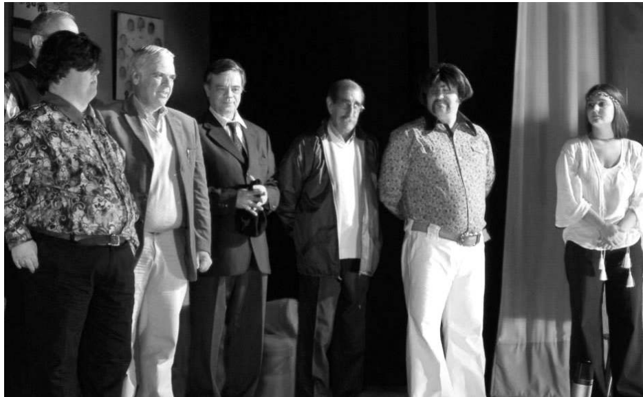
El Intendente acompañó el estreno.