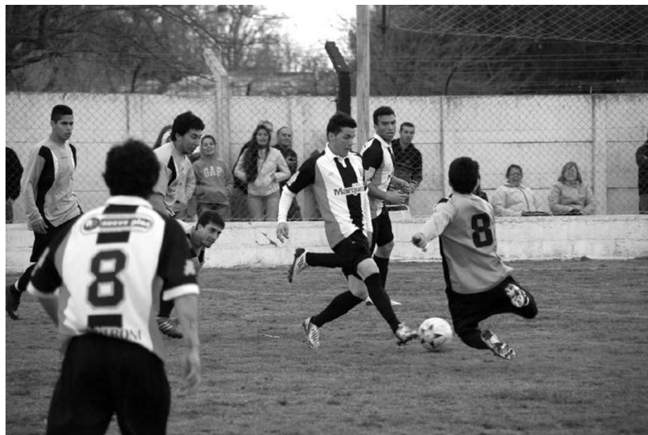
La Niña sigue sin encontrar el rumbo.