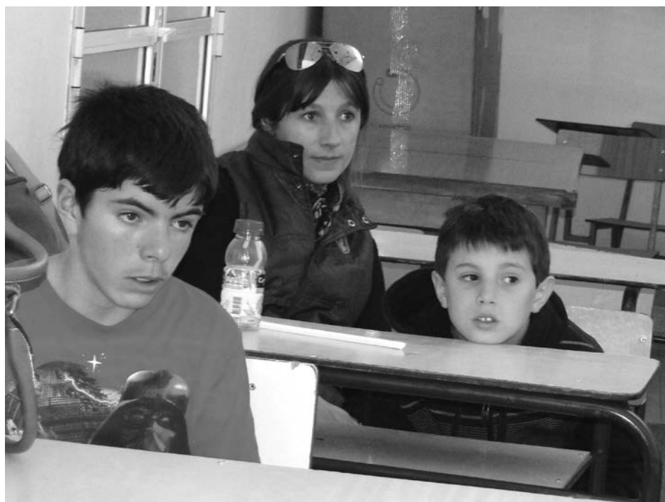
Pasaje de los talleres llevados a cabo los pasados viernes y sábado.