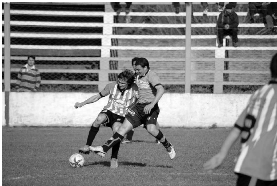
San Martín ganó por primera vez de local.