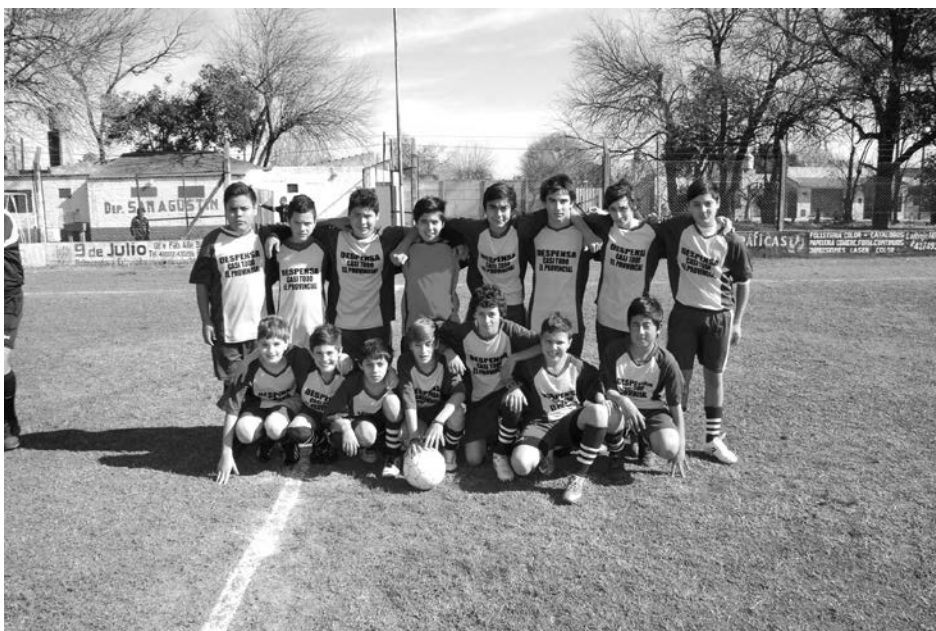
7ma. de 18 de Octubre.