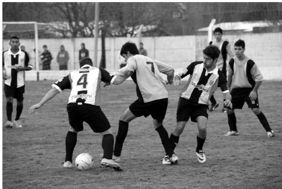
La quinta fecha de la Liga entregó cuatro victorias locales y un empate.