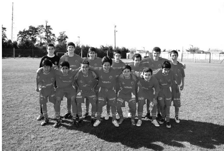
6ta. del Club Agustín Alvarez.