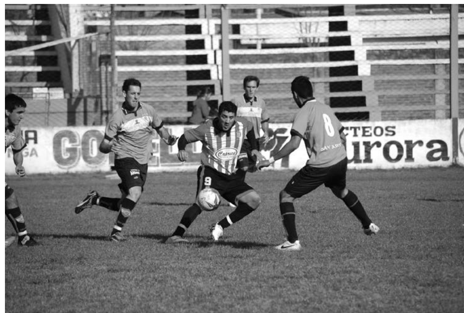
García Campos y Goya se fueron expulsados.

Todo había comenzado el sábado 9 de agosto, en el estadio "Santiago Noé Baztarrica", donde San Martín consiguió su primera victoria como local ante Dudignac,