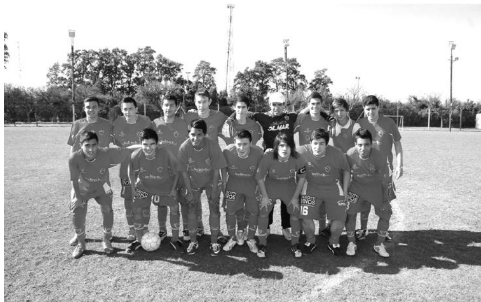
5ta. del Club Agustín Alvarez.