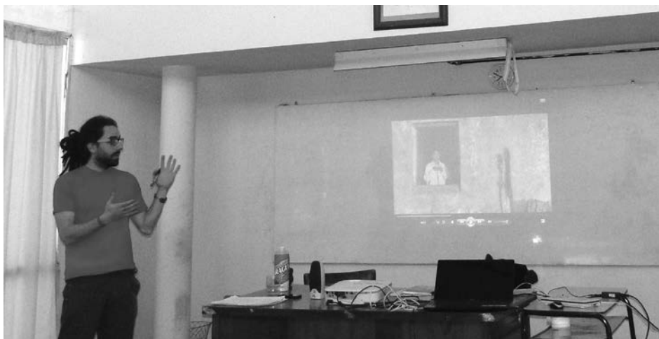
Damián Carretero, director nacional de cine.