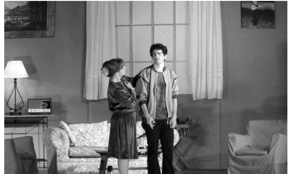
Pasajes de la obra estrenada el pasado fin de semana.