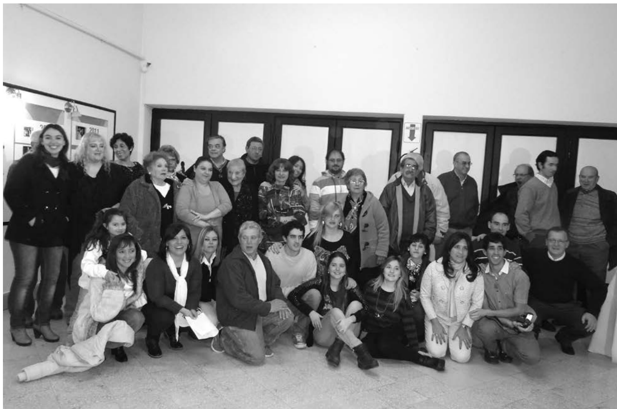
El Grupo de Teatro de Cáritas festejó sus 25 años de trayectoria.

EL TORNEO DE PRIMERA DIVISION DE LA LNF DISPUTO SU QUINTA FECHA