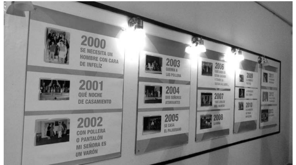
Obras llevadas a cabo en los 25 años.

En oportunidad de realizarse un sencillo acto en el hall central del Teatro Rossini, autoridades del H. Concejo Deliberante de 9 de Julio, encabezadas por su presidente,