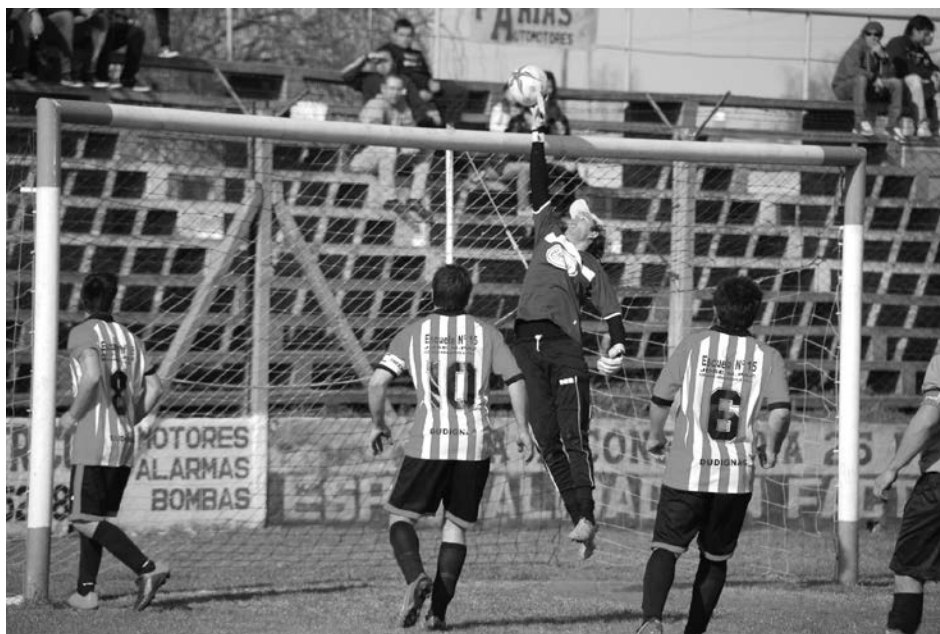
San Martín justificó su victoria.

Caía por 2 a 0 y jugaba con uno menos, pero se recuperó y alcanzó la igualdad – Victorias de San Martín, Once Tigres, French y Quiroga.