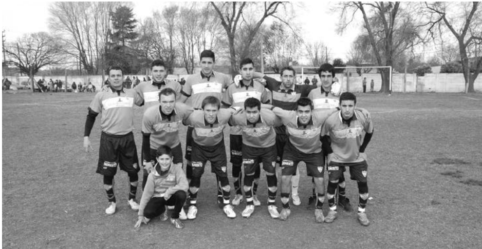
Equipo de San Martín.