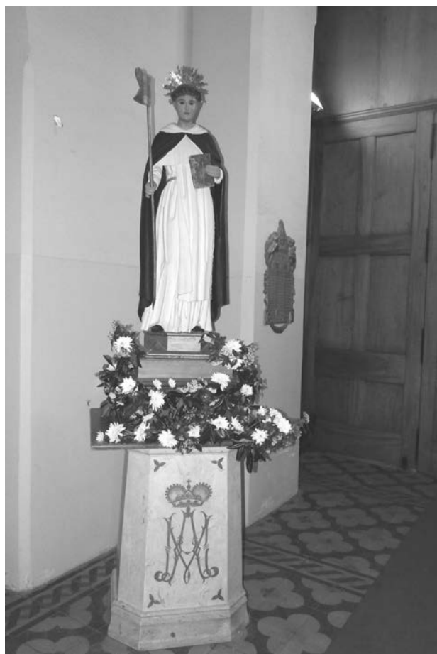
Imagen del Santo Patrono.

La celebración de las Fiestas Patronales de Santo Domingo de Guzmán –Santo Patrono de la Iglesia Catedral, de la ciudad de 9 de Julio y de nuestra Diócesis- se desarrollaron ayer, viernes 8 de agosto, con importante participación de los fieles. Luego de que a lo largo de los últimos días se llevara a cabo la Novena en distintas capillas de la ciudad, reflexionando sobre un tema en particular como son por caso la familia, la paz, los enfermos, la educación o el trabajo, ayer se desarrolló la Misa central en la Iglesia Catedral a las 19 hs., continuando con la Procesión con antorchas en torno de Plaza Belgrano y posteriormente una recorrida de la imagen de Santo Domingo por los diferentes barrios de nuestra ciudad.