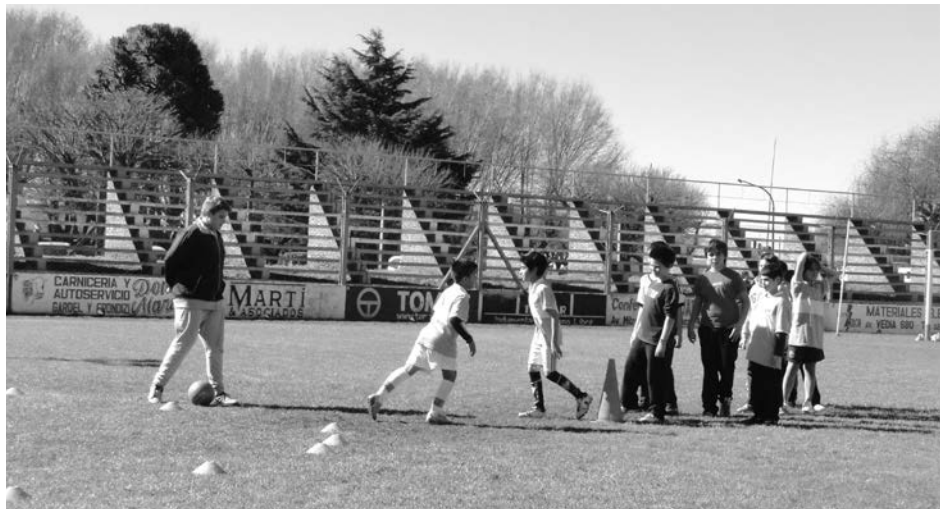
Los niños realizaron distintas actividades.