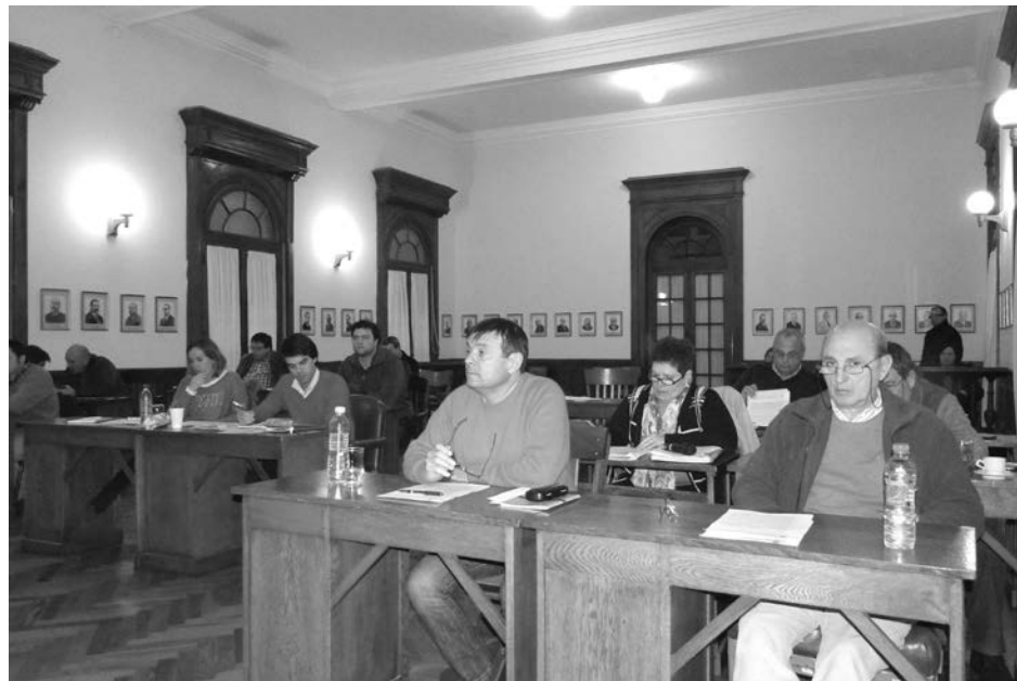
Bloques de concejales en la última sesión del HCD.

En la noche del pasado viernes, el H. Concejo Deliberante de nuestra ciudad desarrolló una nueva sesión ordinaria, oportunidad donde se trataron distintos temas de importancia, entre los cuales se destacó especialmente el tratamiento sobre tablas de una documentación del Frente Para la Victoria – Par-