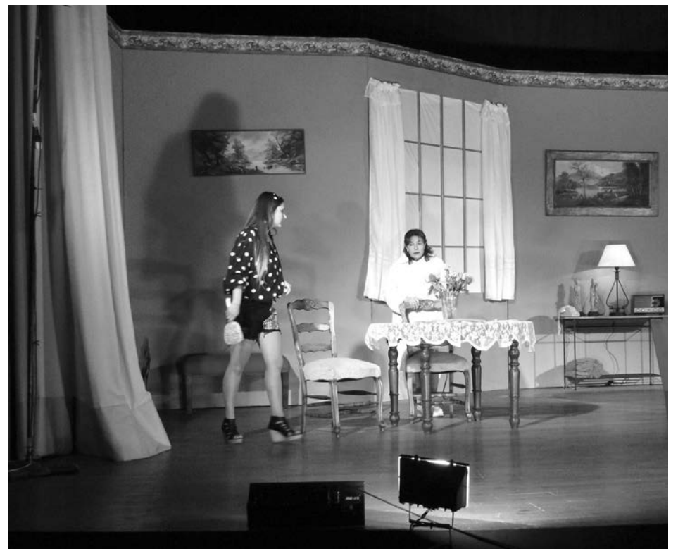
Pasaje de la obra durante su ensayo previo al debut.

Domingo: 24/8: C.E.C 802 Rayuela y Centro de Estimulación