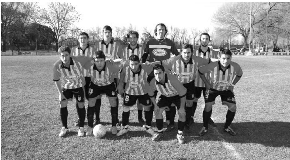
Plantel de Atlético Dudignac.

a Dudignac. En tanto, el domingo se completará la quinta fecha, que tiene como partido más atractivo el choque del puntero con sumatoria ideal, Atlético 9 de Julio, visitando a Agustín Alvarez, que viene invicto, en el Estadio Antonio Crosa. También el domingo, Once Tigres jugará en su cancha ante San Agustín, French recibirá a La Niña y Quiroga a El Fortín.