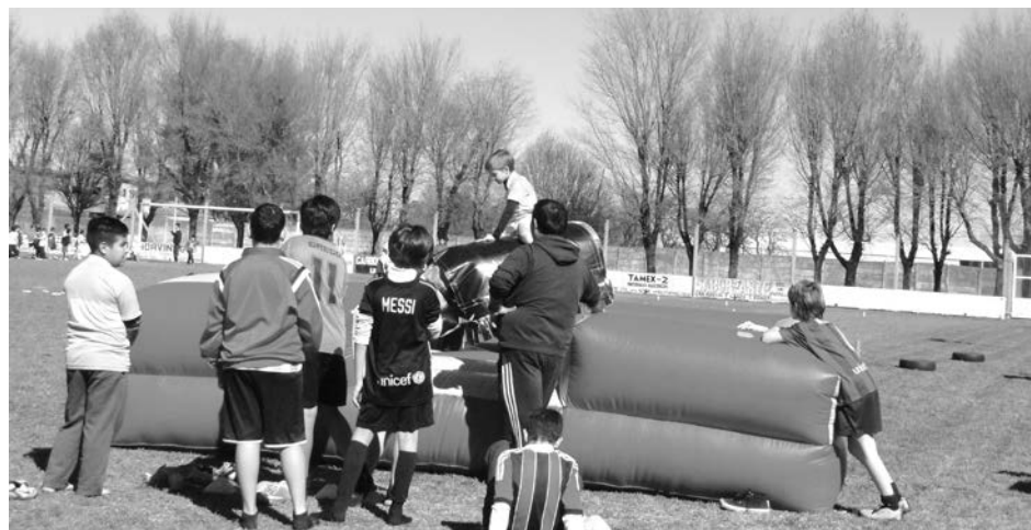
Los asistentes recorrieron distintas atracciones recreativas durante la jornada.