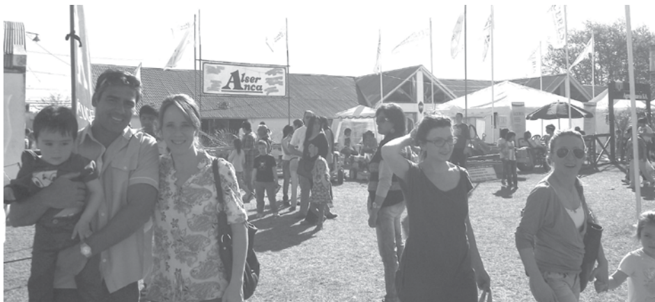
Imágenes de la última Expo Rural.