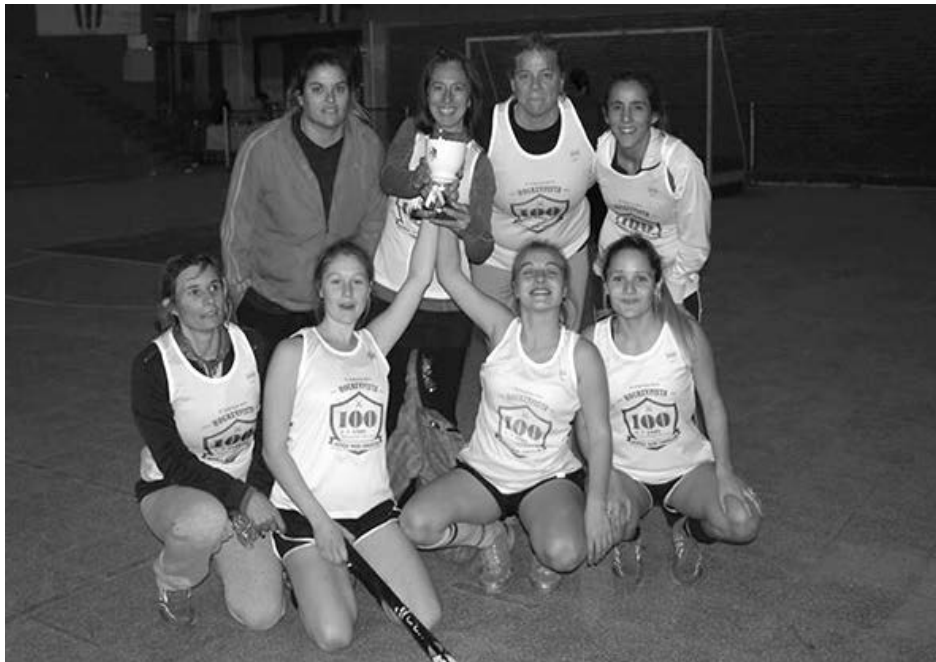
Forcam, arriba, La Aurora, abajo.