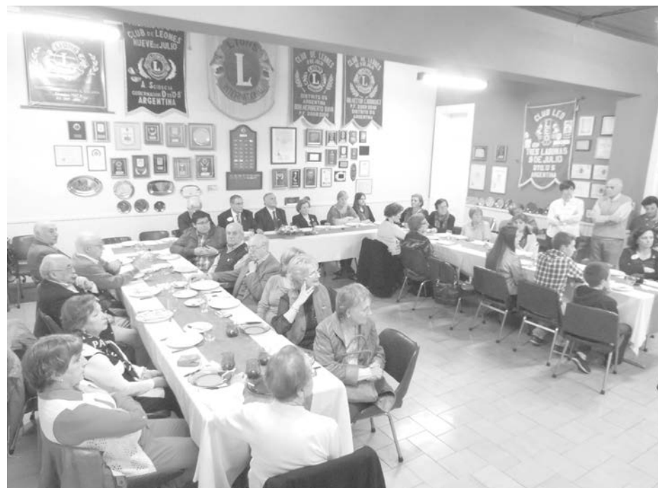
Vista de la reunión plenaria donde se realizó el cambio de autoridades.