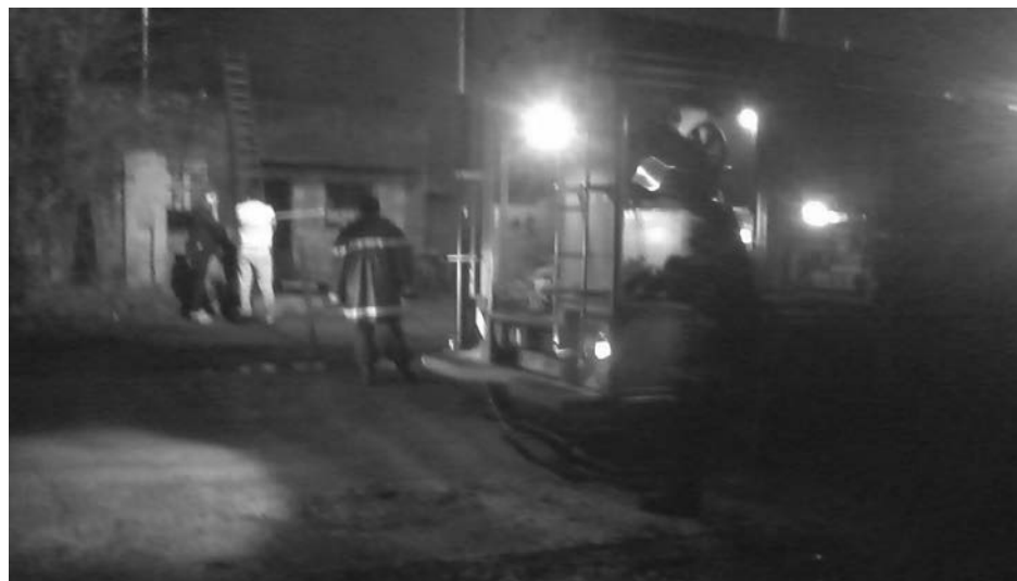
Importantes daños materiales sufrió la vivienda.