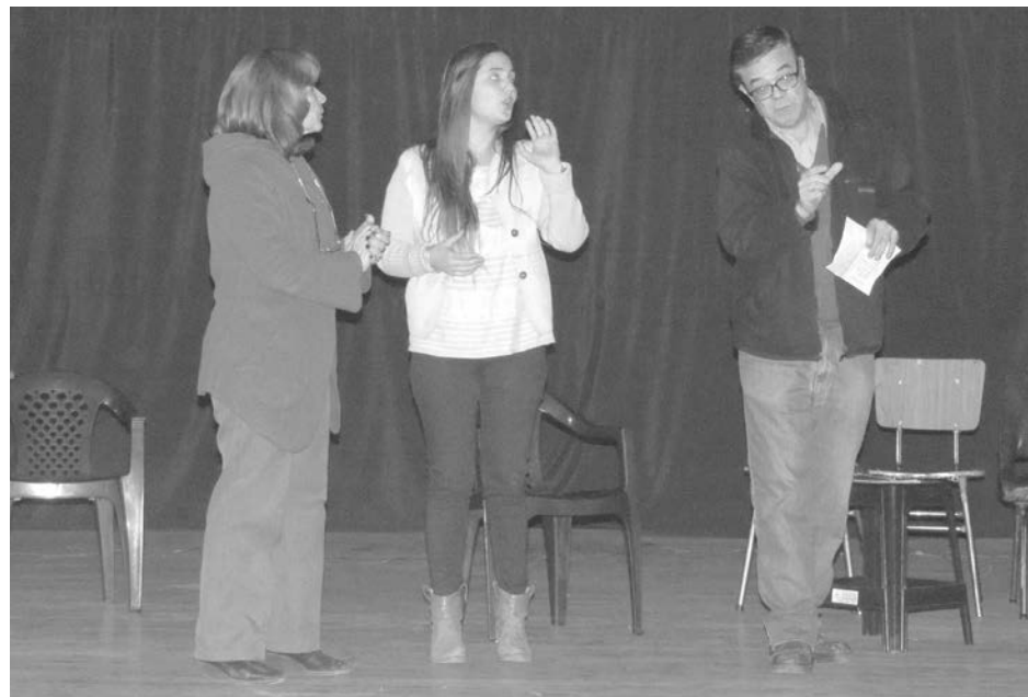
Ensayo previo al estreno de la obra "Las d'enfrente".