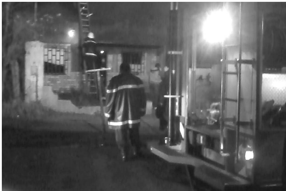
Personal de Bomberos trabaja en el lugar del siniestro.