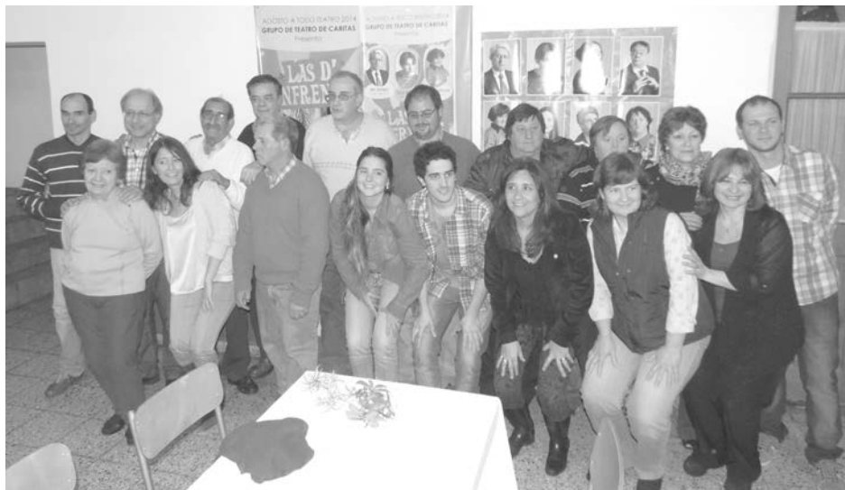
El elenco completo preparado para el debut.