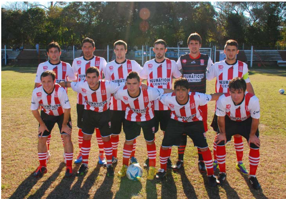
Primer equipo de Atlético 9 de Julio.