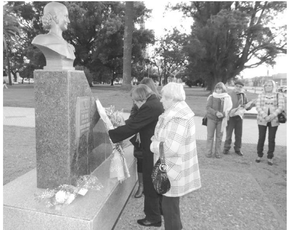
Mujeres del Partido Justicialista depositan una ofrenda floral en el busto de Evita.

Como estaba previsto en la jornada del sábado se cumplieron los actos programados en conmemoración de los 62 años de la muerte de Eva Duarte de Perón.