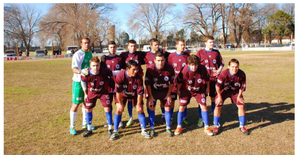
Dep. San Agustín.