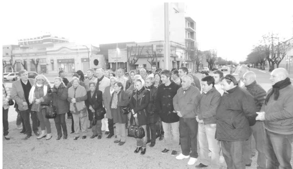
Asistentes al acto realizado en Plaza Belgrano.