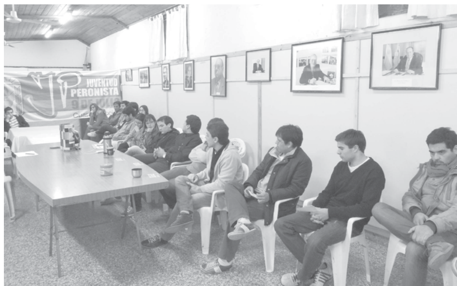
Importante presencia de jóvenes se reunieron en 9 de Julio.

centrales que tienen que ver con la inclusión social, con la participación de los habitantes y que se enfrenta a otro modelo de país que está representado por otros dirigentes que tienen intenciones de trasladar la toma de decisiones en lugar del interés del pueblo al interés de las minorías, donde el poder mediático, a la concentración económica tendrían la posibilidad de conducir el país. Convencidos del camino recorrido, desde los desafíos que se tienen por delante, las materias pendientes dentro del proyecto que ha sido beneficioso para todos los argentinos, creemos que continuando por este camino todo lo pendiente se puede ir saldando paso a paso".