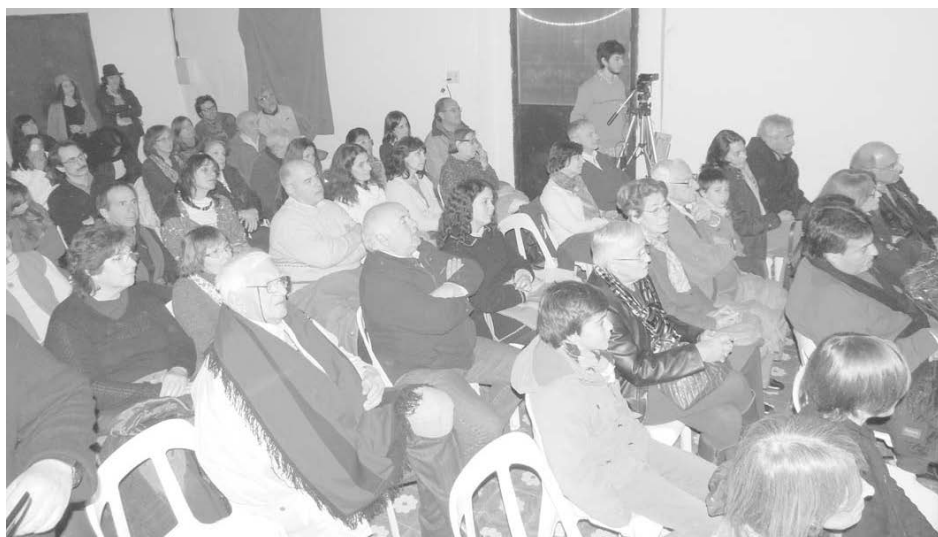
Gran concierto musical de primer nivel se presentó en La Esquina.

El pasado sábado en "La Esquina, arte y cultura" desde las 22 horas, se presentó el grupo musical "Reencuentro" integrado por reconocidos y consagrados músicos, ante un excelente marco de público.