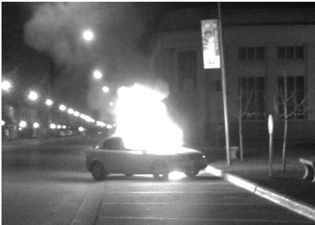
El rápido accionar de Bomberos impidió que el fuego se extendiera a los automóviles cercanos.