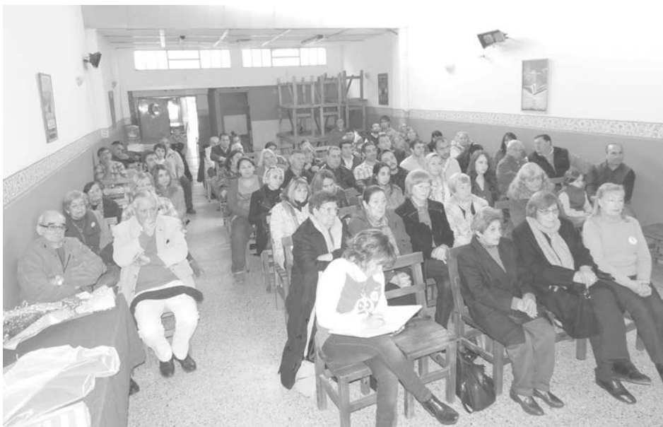
El inicio del acto fue con la segunda reunión del Consejo del Partido Justicialista.