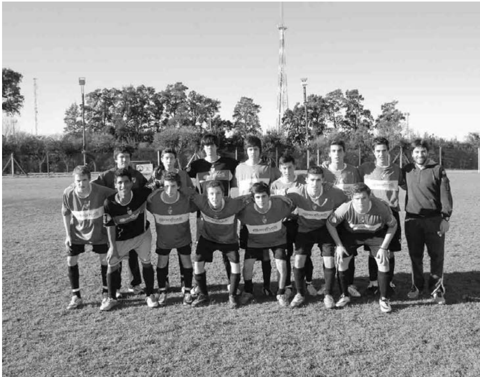
5ta. categoría de Atlético Quiroga