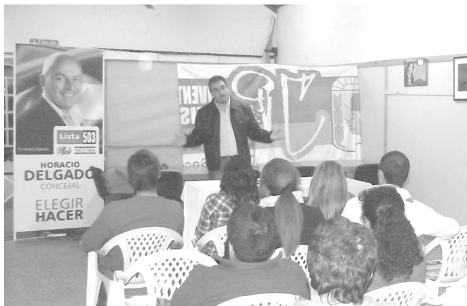
El pasado viernes se desarrolló la importante jornada en la UBJDP.