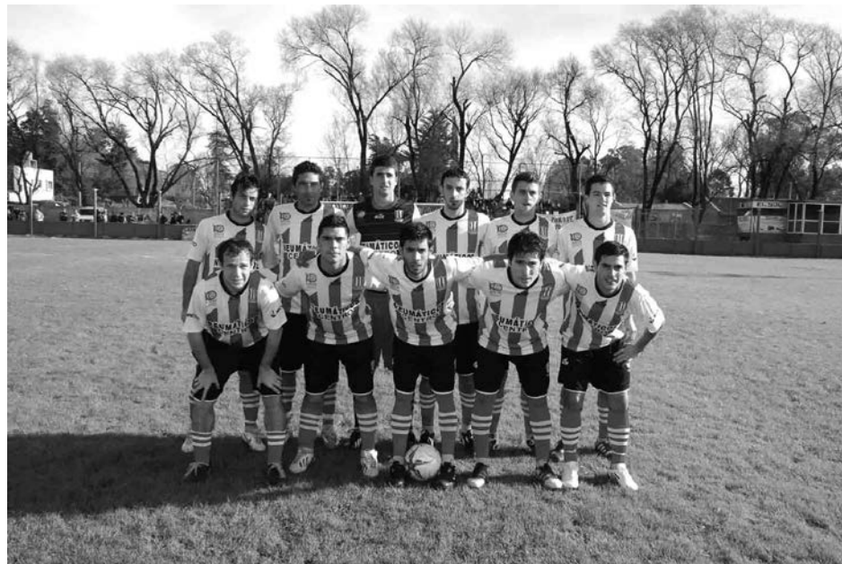
Equipo de Atlético 9 de Julio.