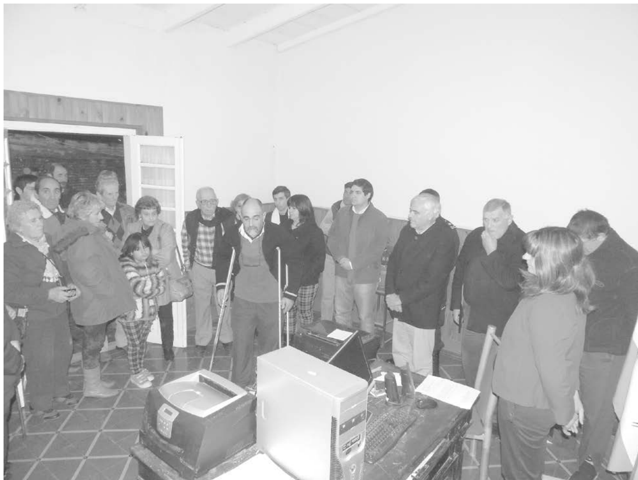
El Pte. de la Sociedad de fomento explicó como se trabajó en conjunto para recuperar el destacamento.