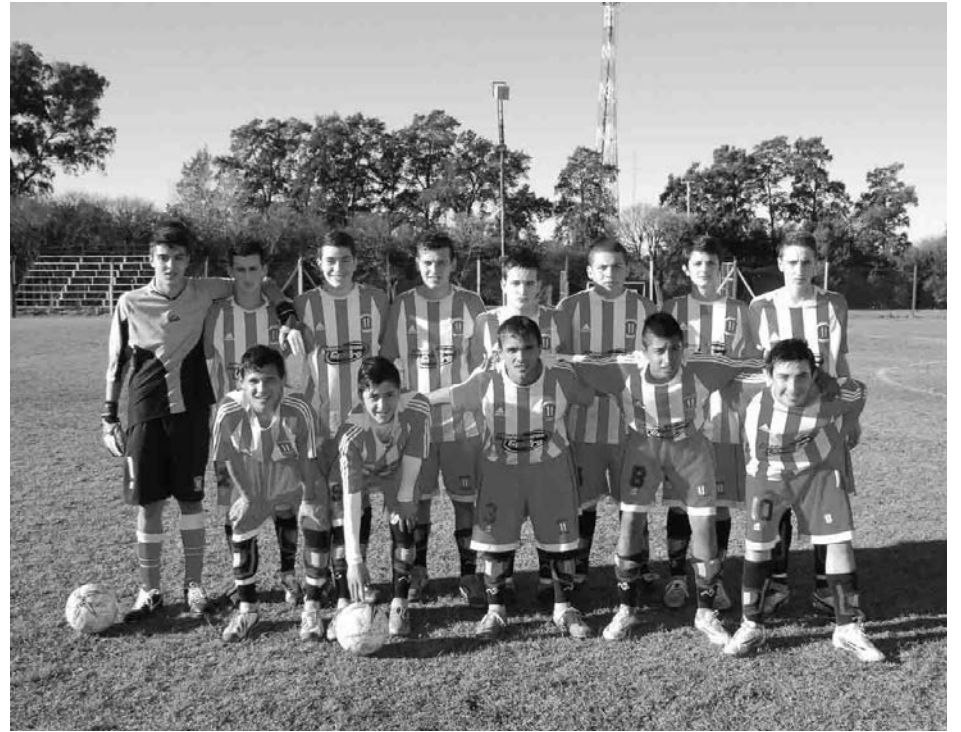
5ta. categoría de Atlético 9 de Julio