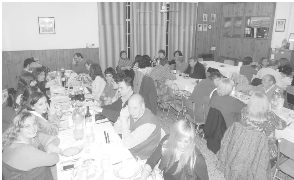
El periodismo local acompañó a la presentación del elenco de "Las d'enfrente".

puesta acorde a la época, tanto en el vestuario como la iluminación o el sonido". "Desde el inicio de nuestro trabajo quisimos colaborar con las instituciones y a lo largo de esta trayectoria el mismo se ha cumplido con creces, con el apoyo del público y la comunidad en general, destinataria de nuestro trabajo", agregó. Por otra parte, recordó que "ésta fue una obra que tuvo mucho éxito y está caracterizada en los años 70 y fue puesta en escena en los 80".