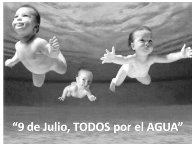
"9 de Julio, TODOS por el AGUA"

Viendo que aunque los anuncios se realizaron en marzo y aún no hay nada concretado de las obras a corto plazo, sugerimos dejar para futuras reuniones el tratamiento de las obras a mediano plazo. El Secr. León pidió paciencia, haciendo hincapié en el mal estado en el que fueron entregados los servicios por la CEyS y en la falta de experiencia y que "la idea es tener para antes del verano todo armado". Varios fuimos