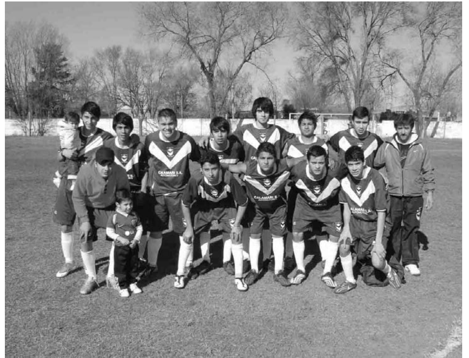
5ta. categoría de El Fortín