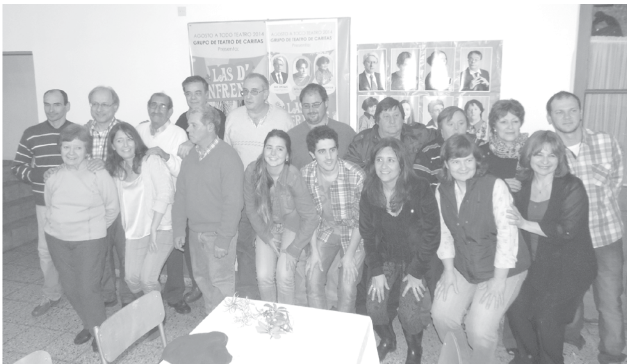
A pleno todo el grupo de teatro de caritas se presentó el pasado sábado.

Fue con la tradicional "raviolada" que agasaja al staff y a los medios periodísticos de la ciudad, desarrollada en la noche del sábado.