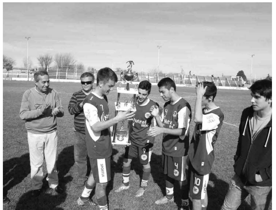
La 5ta. categoría de San Agustín recibe el trofeo de la División.