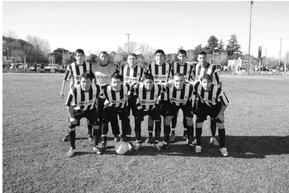
Equipo superior de Atlético French.

GAU ALMACEN DE RAMOS GENERALES MENDOZA casi MITRE