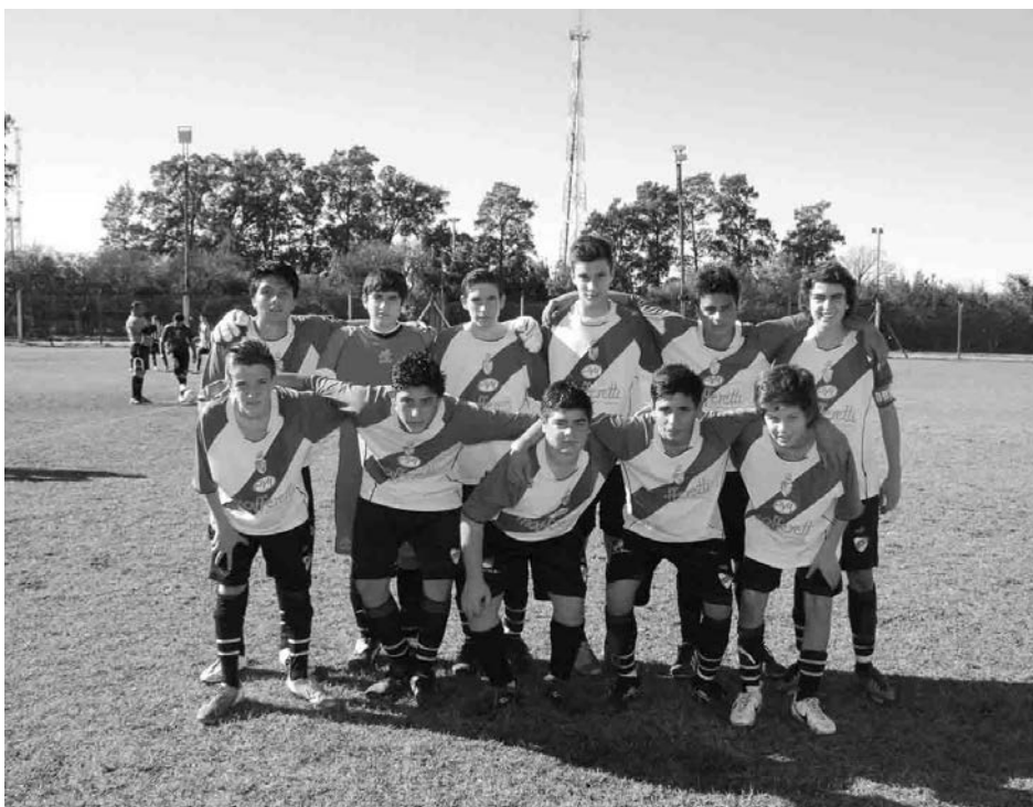
6ta. categoría de Atlético Quiroga