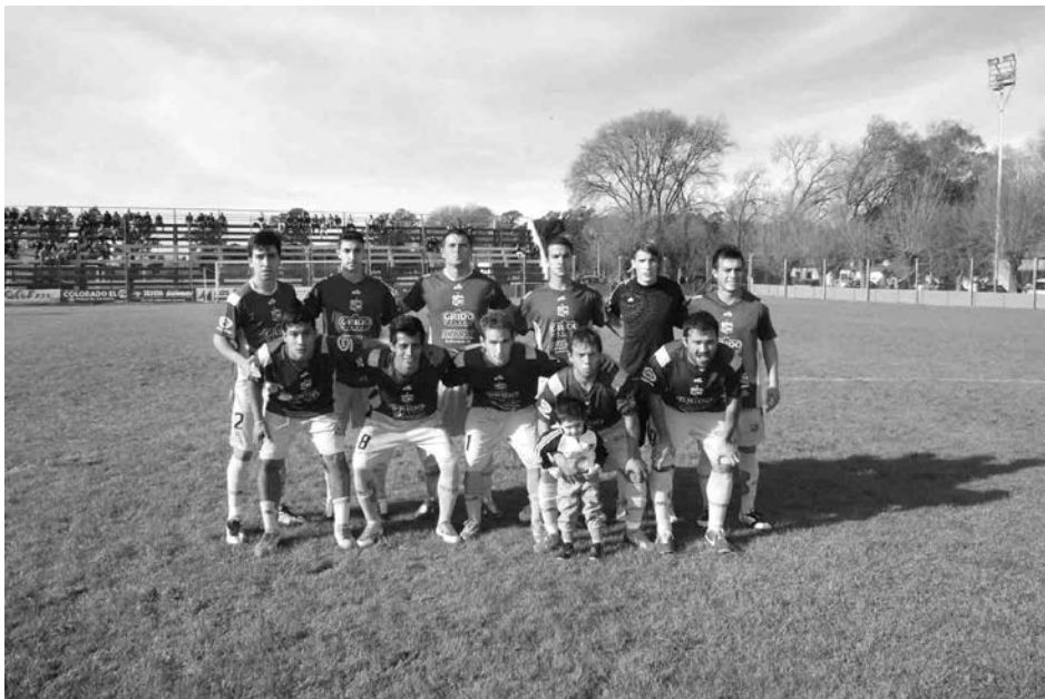
Plantel de Once Tigres.