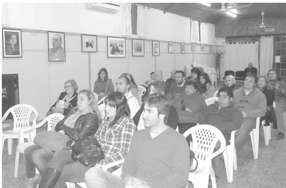
Dirigentes, Concejales y simpatizantes del PJ presentes.