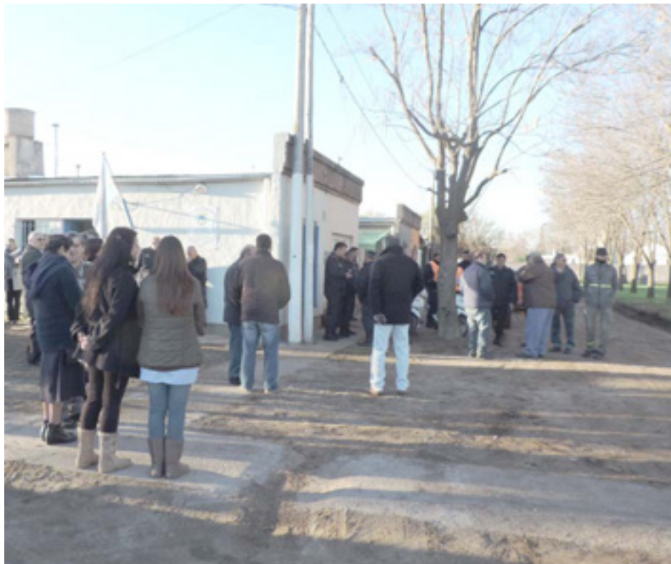
El Destacamento policial funciona frente a la Plazoleta "Héroes de Malvinas".

Contará con dos patrulleros fijos y dos motocicletas, 16 efectivos, un coordinador y el puesto de verificación policial de vehículos que funcionaba en la Estación de Policía Comunal.