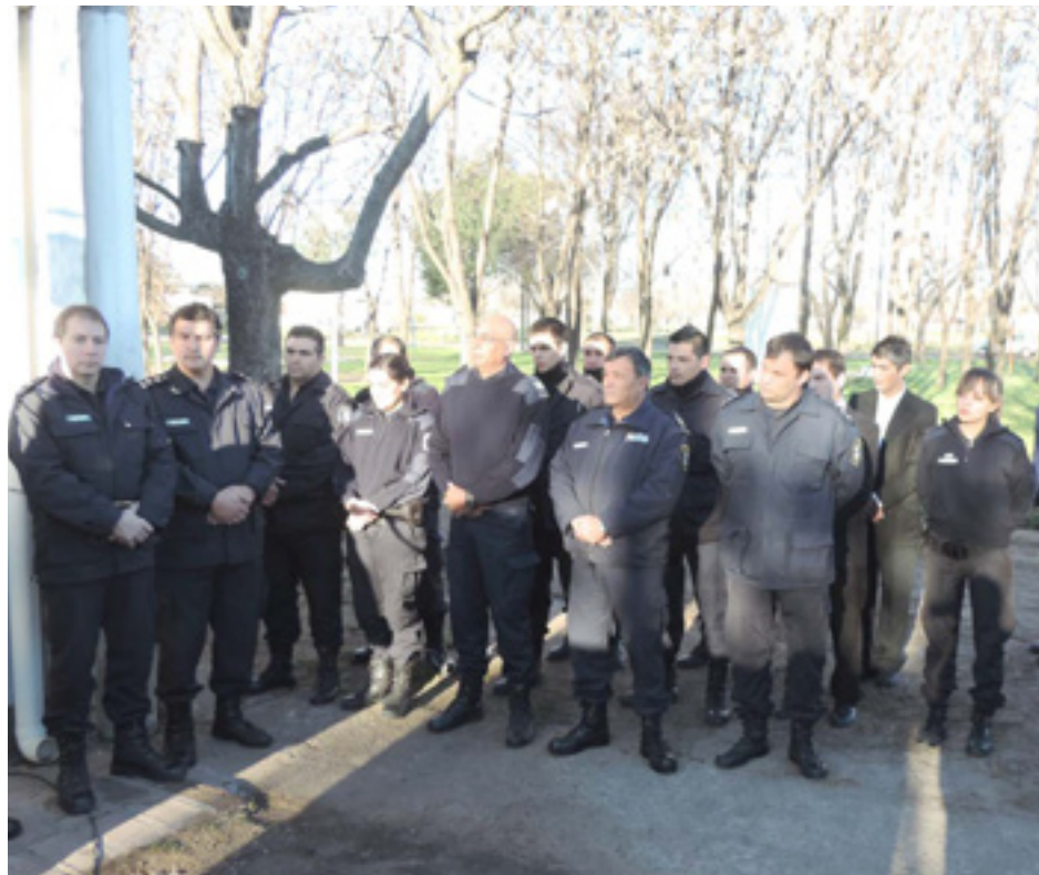
Autoridades policiales presentes en el acto de reapertura del Destacamento.