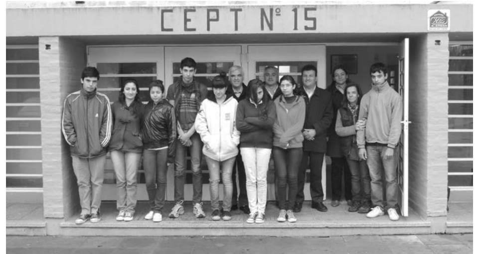
Alumnos del CEPT Nro. 15 junto a autoridades municipales.