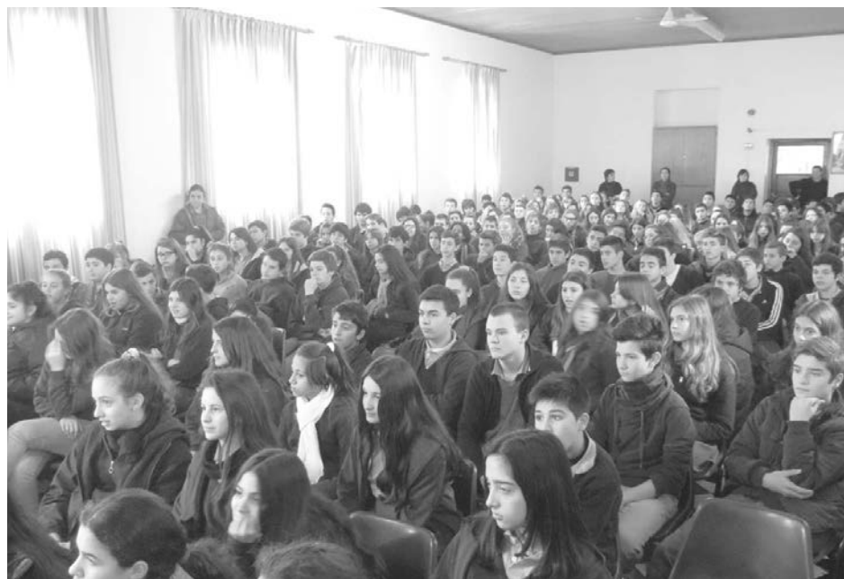
Los alumnos participaron atentamente de la importante jornada.