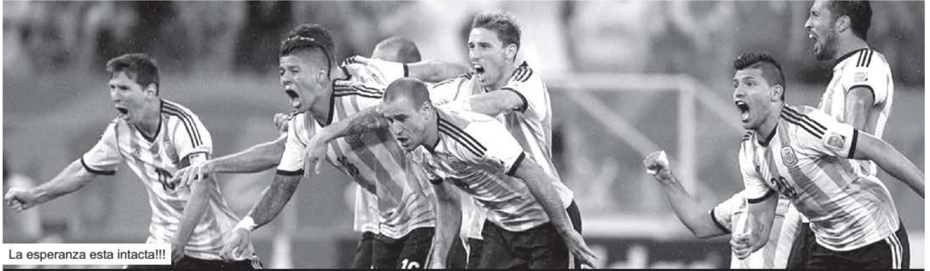
La esperanza esta intacta!!!