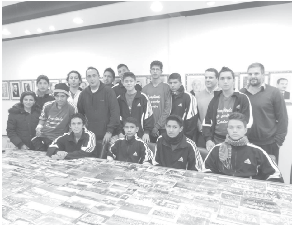
La delegación ecuatoriana junto a integrantes del Club Atlético 9 de Julio.

Como "Tiempo" lo adelantara, el día jueves arribó a nuestra ciudad la Selección de la Provincia de Napo, República de Ecuador, que participará del Torneo Internacional de Basquet organizado por el Club Atlético 9 de Julio, y que fue presentado ayer en una rueda de prensa. Se trata del Seleccionado categoría Sub 16, hasta 16