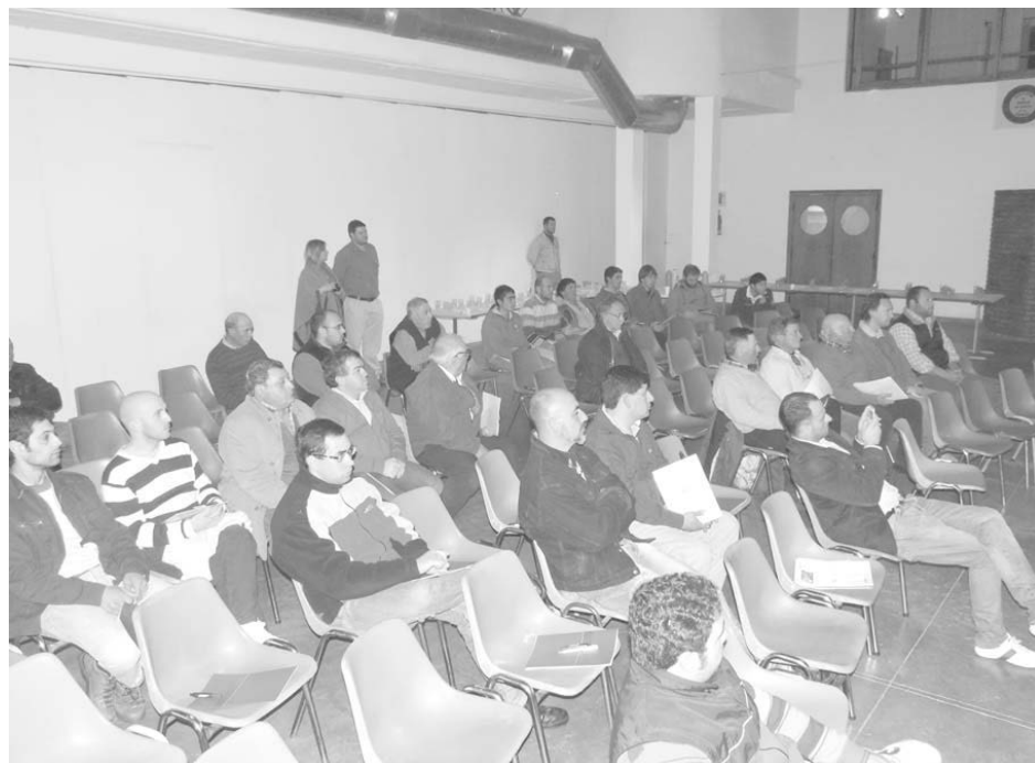
Asistentes a la jornada porcina en Sociedad Rural.