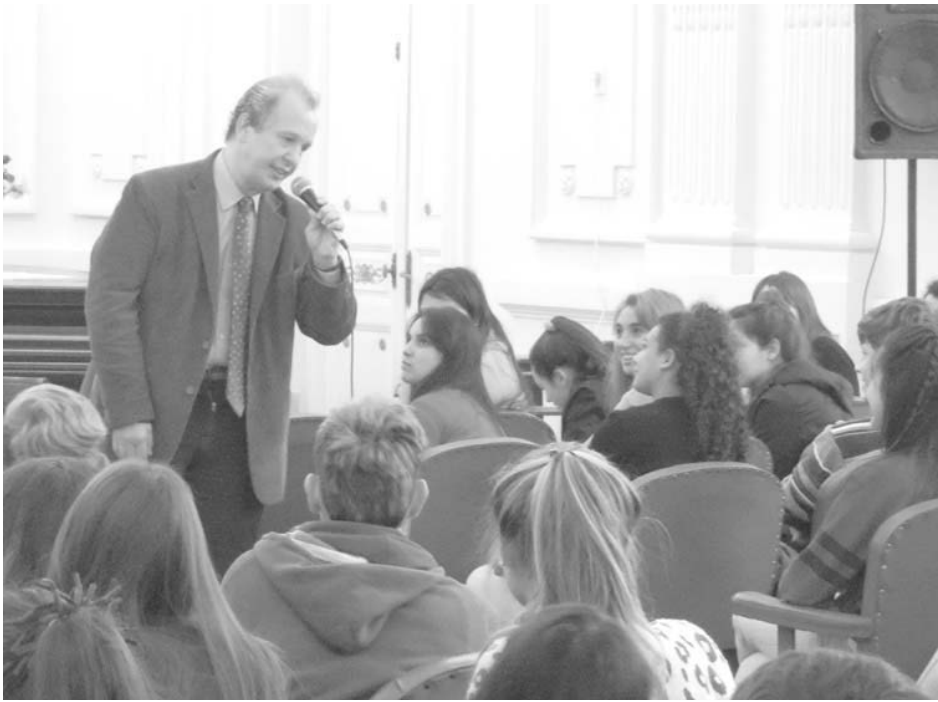
El disertante en contacto con los alumnos.