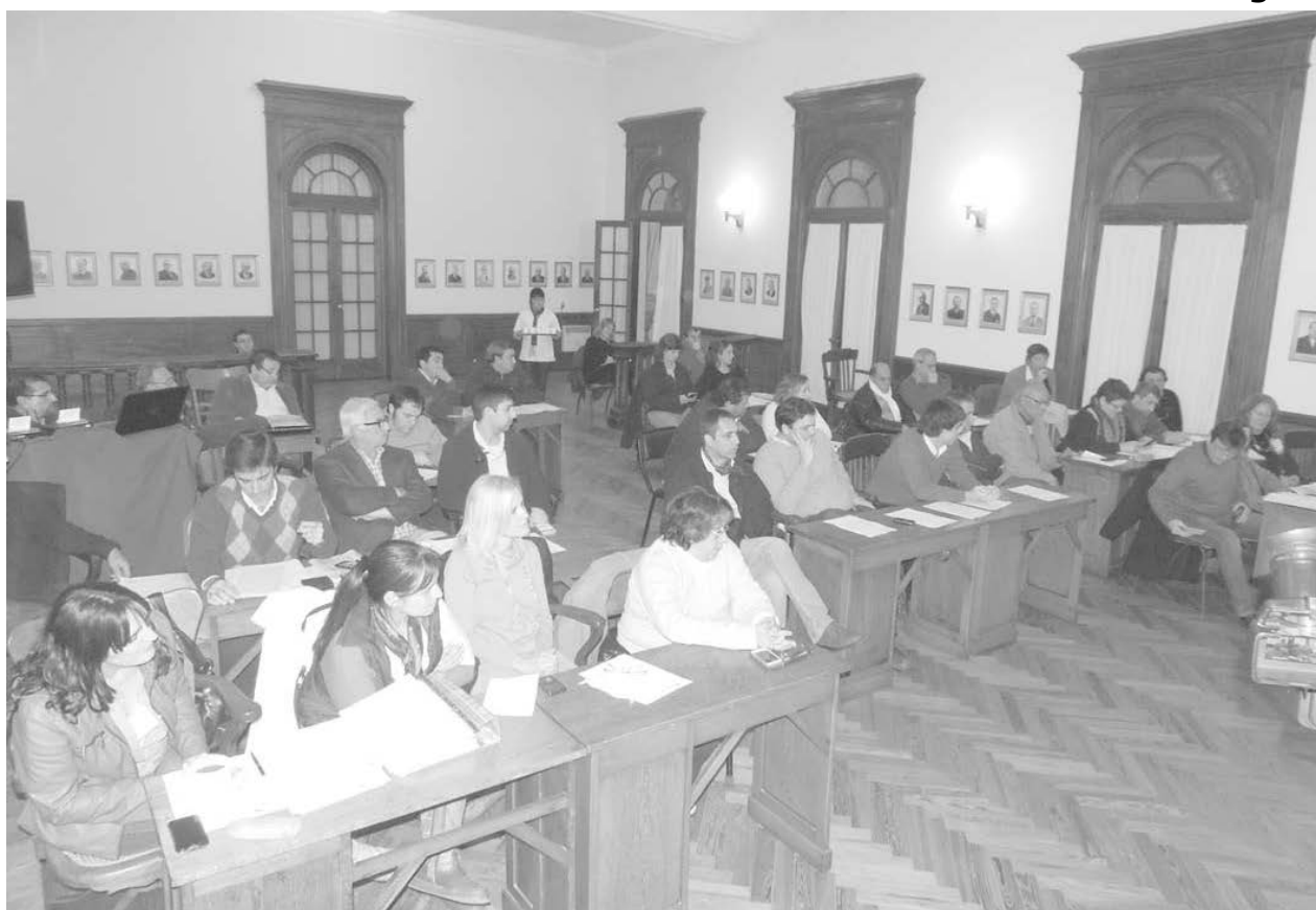
Anoche quedó aprobada por mayoría la nueva tarifa para el servicio de agua y cloacas para Ciudad Nueva y El Provincial.