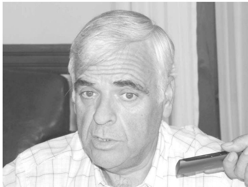
El Intendente explicó que la licitación del autódromo es abierta a todo el país.

cuando se efectuó la concesión anterior, "el contexto era totalmente distinto, ya que apenas existían cinco o seis autódromos en el país; y hoy hay seis por provincia". "Creemos que la mejor alternativa es la de solicitar al Concejo Deliberante que nos autorice el llamado a licitación, ya que de esta manera tendremos la posibilidad de quienes acerquen la mejor propuesta podrán hacer uso del mismo, exigiéndose una serie de obras que pongan el escenario a la altura de otros que paulatinamente nos han ido sacando la posibilidad de contar con competencias en nuestra ciudad", opinó el titular del Ejecutivo Municipal, marcando que las inversiones "abarcan hoy no solamente obras complementarias, sino las que deben ejecutarse en la pista, situaciones que deben estar naturalmente contempladas en el pliego, estableciéndose claramente los plazos y también realizándose una concesión prolongada para su debido recupero". "La licitación será abierta a nivel nacional, ya que esto debe ir concatenado con el trabajo que se viene desarrollando en pos del desarrollo turístico del distrito, buscando entregarle comodidades a todos los que se acerquen a disfrutar de las competencias", agregó.