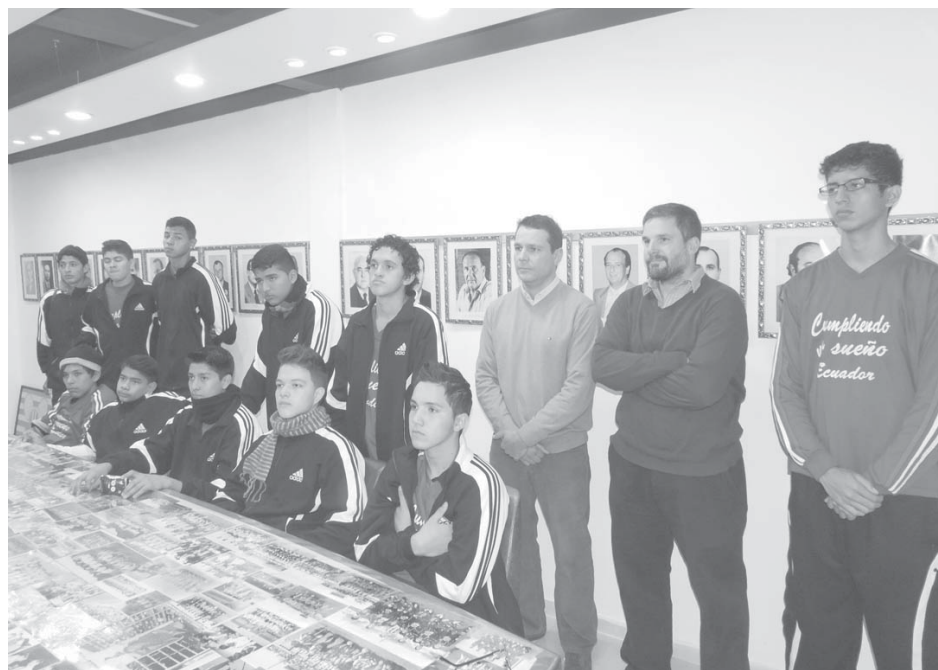
El Club Atlético 9 de Julio se prepara para el torneo internacional de básquet.