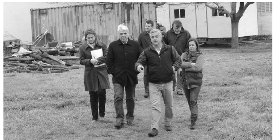
El intendente recorrió las instalaciones con directivos del Centro.

"La idea del Centro es que los chicos se arraiguen al medio rural, así que nos pareció sumamente interesante que pusieran en conocimiento las dos ex-