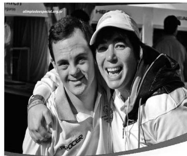
LA EDUCACIÓN FÍSICA Y EL DEPORTE; Para personas con y sin discapacidad intelectual (Deporte Unificado® de Olimpiadas Especiales)

Es el deporte de mayor popularidad en el mundo, y sin duda de la Argentina y lo tomamos como motivador para generar conocimiento, aceptación, y respeto hacia las personas con discapacidad intelectual, ofreciendo competencia sistemática a lo largo del año.