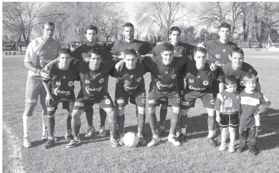
Equipo de San Agustín.

En razón de la presentación de la Selección Argentina en el Mundial de Fútbol Brasil 2014, no habrá hoy cotejos adelantados del torneo oficial de Primera División de la Liga Nuevejuliense de Fútbol, que por ende disputará íntegramente su tercera fecha el día domingo, desde las 15,30 hs. Cabe aclarar no obstante que en la jornada de hoy tampoco se disputará la fecha de inferiores. En esta jornada se destacan especialmente los choques que librarán ambos punteros. Por un lado, Atlético 9 de Julio visitará "El Coqueto" de Once Tigres, que viene de un magro arranque y buscará recuperarse frente a su clásico rival. Por otra parte, el restante líder, Atlético French visitará a Agustín Álvarez en el Antonio Crosa, en otro cotejo prometedor.