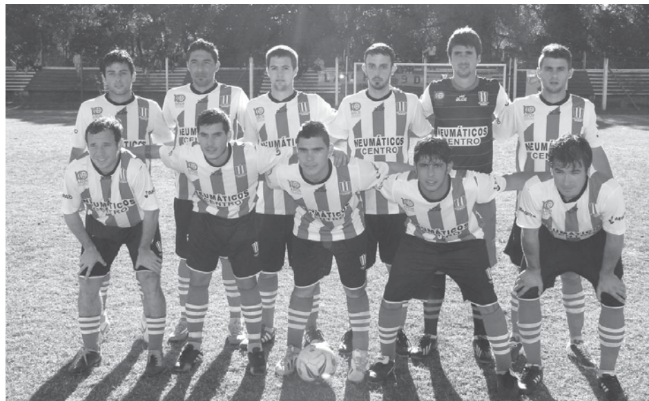
Atlético 9 de Julio, uno de los punteros y firme candidato.

En razón de la presentación de la Selección Argentina en el Mundial de Fútbol Brasil 2014, no habrá hoy cotejos adelantados del torneo oficial de Primera División de la Liga Nuevejuliense de Fútbol, que por ende disputará íntegramente su tercera fecha el día domingo, desde las 15,30 hs. Cabe aclarar no obstante que en la jornada de hoy tampoco se disputará la fecha de inferiores. En esta jornada se destacan especialmente los choques que librarán ambos punteros. Por un lado, Atlético 9 de Julio visitará "El Coqueto" de Once Tigres, que viene de un magro arranque y buscará recuperarse frente a su clásico rival. Por otra parte, el restante líder, Atlético French visitará a Agustín Álvarez en el Antonio Crosa, en otro cotejo prometedor.