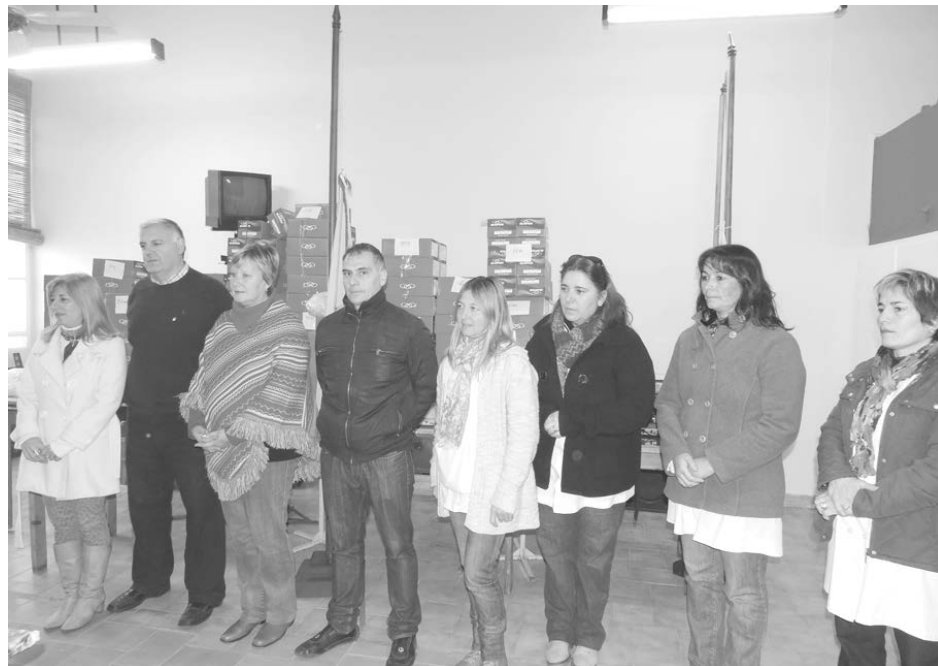
Distintos establecimientos educativos fueron beneficiados por la importante entrega de calzado deportivo por parte del Club de Leones.