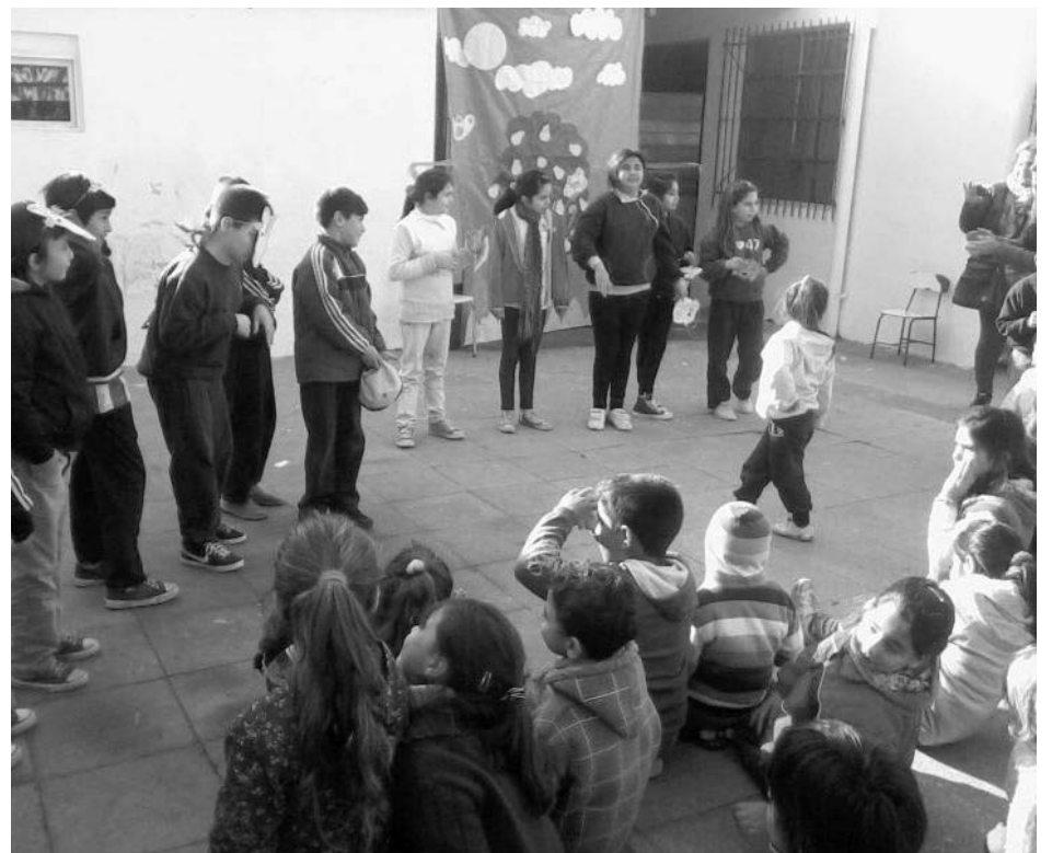
Los chicos celebraron ayer el 48° aniversario de Pibelandia.

Al cumplirse el día 5 del corriente un nuevo aniversario de la fundación del Centro Educativo Complementario N° 801, creado en el año 1966 con la denominación de Centro Asistencial, modificándose en el año 1968 bajo el nombre de Centro Asistencial Complementario conocido en nuestra ciudad como "Pibelandia"; el HCD de 9 de Julio felicita a la institución por tan feliz acontecimiento, y la insta a proseguir por ese camino emprendido, expandiendo y complementando los conocimientos adquiridos en la Escuela, la Familia y la comunidad a un grupo de 179 niños provenientes de distintos jardines y escuelas de educación primaria y secundaria de la ciudad, brindando servicios didácticos, pedagógicos, socio comunitario y alimenticio (desayuno, almuerzo y merienda).