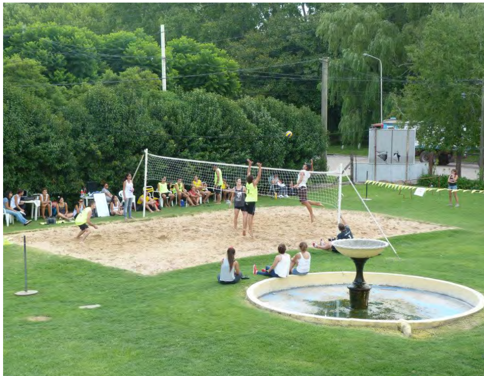
Cancha de arena del Club Atlético 9 de Julio.

Resultó realmente muy activa y deja un saldo muy positivo tanto para los jugadores como para la Sub Comisión de Voley del Club Atlético, excelente organizadora de todas las competencias.