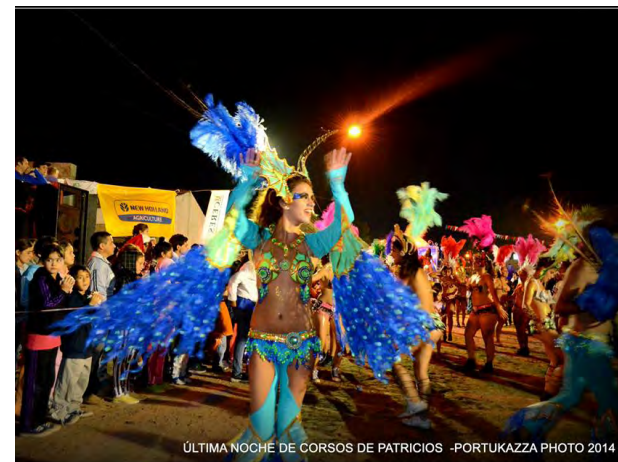
ÚLTIMA NOCHE DE CORSOS DE PATRICIOS -PORTUKAZZA PHOTO 2014