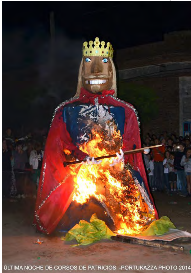
ÚLTIMA NOCHE DE CORSOS DE PATRICIOS -PORTUKAZZA PHOTO 2014