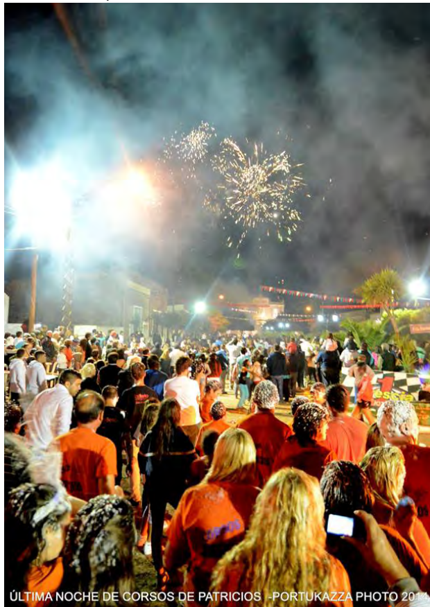
ÚLTIMA NOCHE DE CORSOS DE PATRICIOS

y una banda en vivo, cerrándose la fiesta con la quema del Rey Momo.