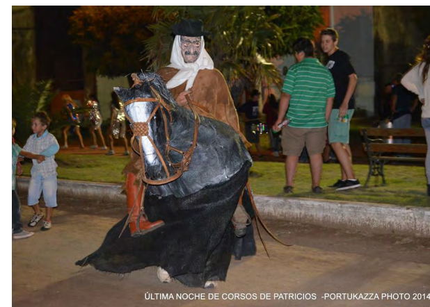
ÚLTIMA NOCHE DE CORSOS DE PATRICIOS -PORTUKAZZA PHOTO 2014