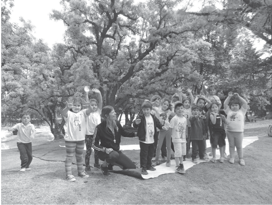
Los pequeños realizaron distintas actividades recreativas en el Parque.