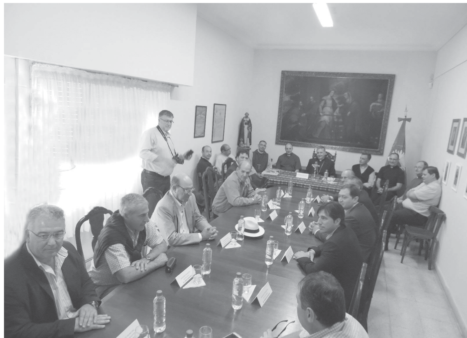
Intendentes de varias ciudades que se encuentran dentro de la Diócesis, estuvieron presentes en el importante encuentro con el Obispo.

Con la intención de coordinar "cuestiones concretas de cada municipio y parroquia que puedan hacer al mutuo interés para el bien común de nuestro pueblo, dialogando y buscando a la luz de la Doctrina Social de la Iglesia, las iniciativas que permitan abrir el futuro para una Argentina cada vez más fraterna y solidaria, más pacificada y reconciliada, y trabajar, como nos pide el Papa Francisco, poniéndonos la Patria al hombro" –según se expresaba en la invitación, en la mañana de ayer, el Obispo Diocesano de 9 de Julio, Ariel Torrado Mosconi, recibió en la sede religiosa de calle Edison a Intendentes y funcionarios de los distritos que componen nuestra Diócesis, en un importante encuentro.