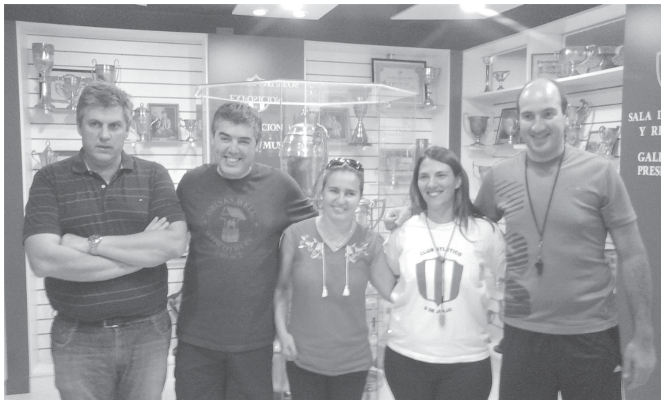
Autoridades del club y profesores brindaron detalles del inicio de la temporada de pileta y colonias.