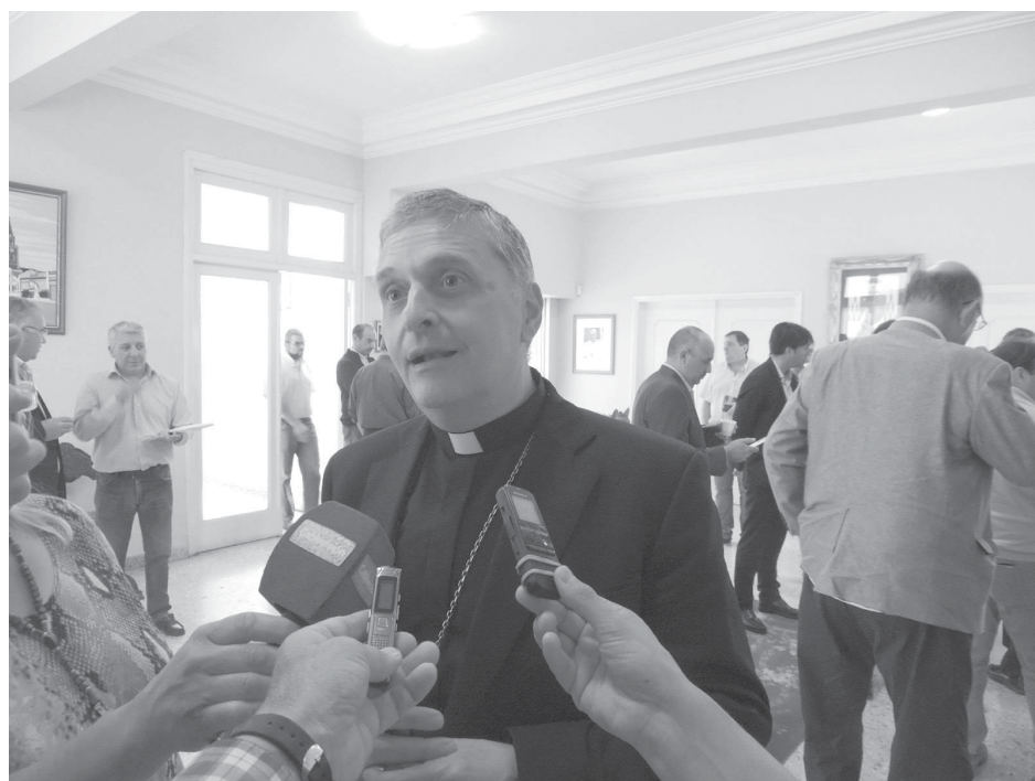
Monseñor Ariel Torrado Mosconi en rueda de prensa.

En este marco, señaló que una de las cuestiones fundamentales abordadas en la oportunidad fue "la temática de los jóvenes y cómo podemos trabajar en conjunto entre la Iglesia, el Estado y otras instituciones en lo que tiene que ver con la prevención y recuperación en de las adicciones, con la posibilidad de crear un centro de asistencia". Además, distinguió como una gran necesidad "trabajar en las comunidades y barrios más carenciados, de manera que los mismos puedan desarrollarse y crecer" y adelantó que antes de fin de año se habrá de reunir en el mismo sentido con representantes de ONGs y sindicatos.