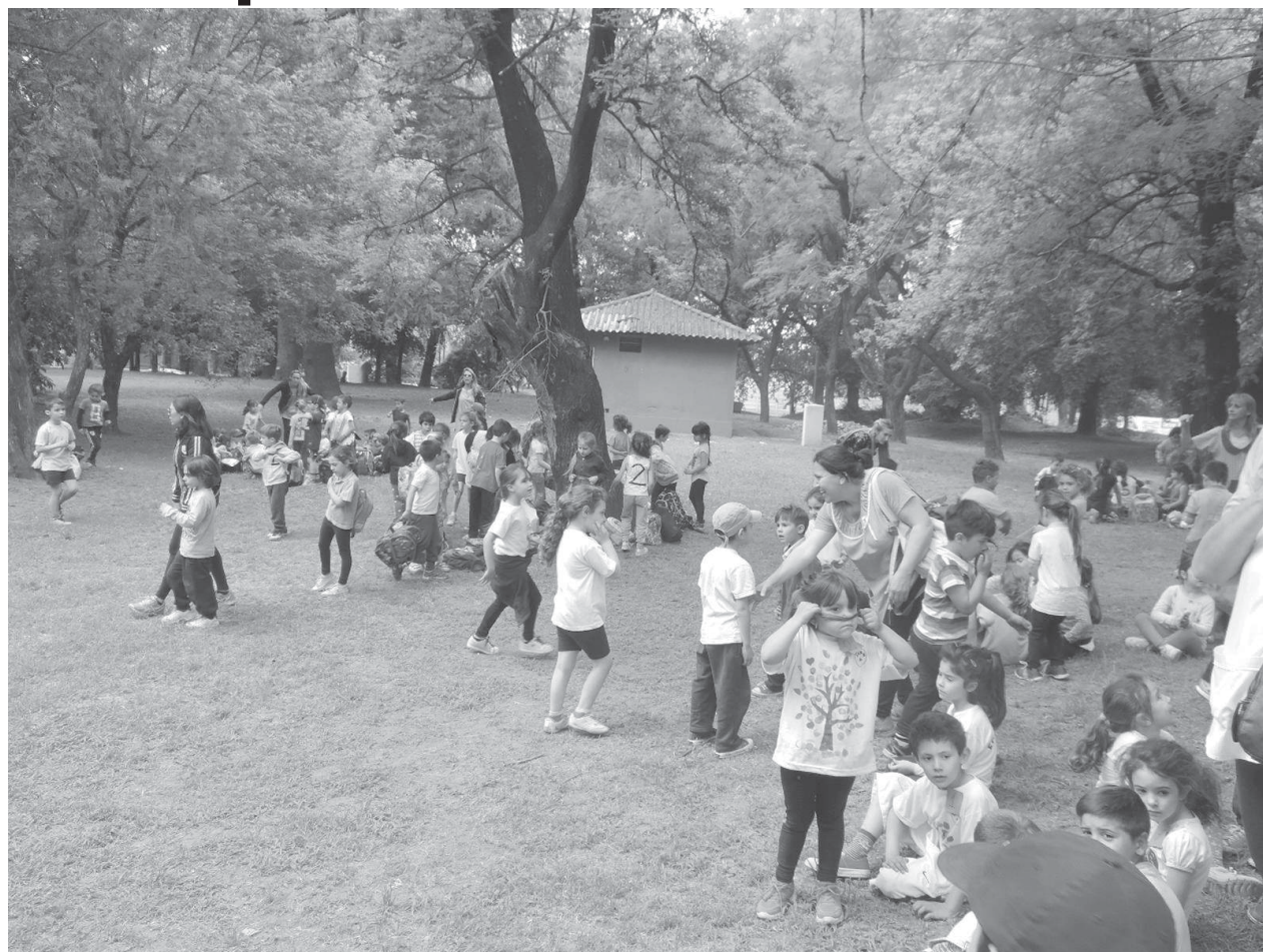
Jornada masiva del Nivel Inicial en el Parque General San Martín, en el día de ayer.