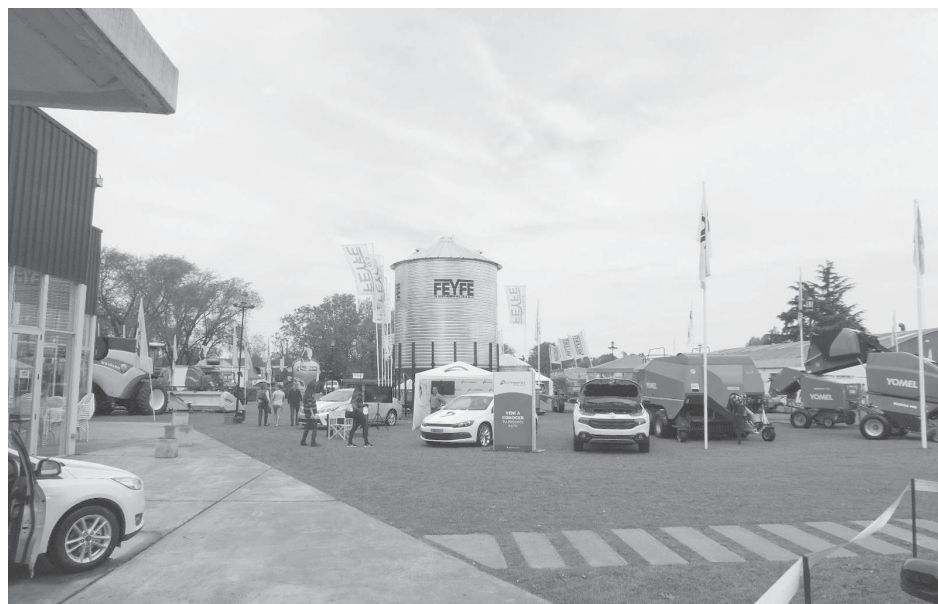
Una vista de los stands externos de la Expo Rural.

Hoy viernes, desde las 18 hs. se desarrollará la Jornada Técnica de Ganadería, donde se realizará la presentación de la Prueba