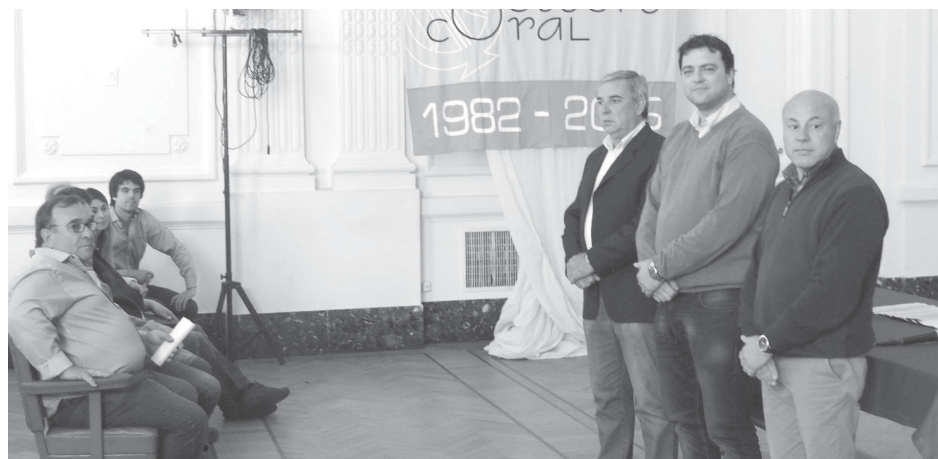
Autoridades municipales presentes en el acto de asunción.