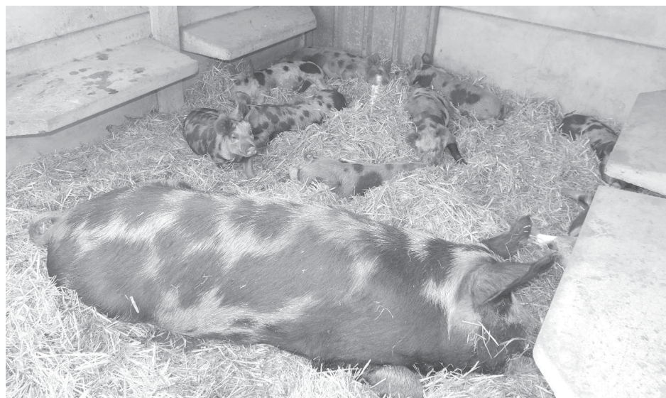
Una tierna imagen de la muestra, la chancha con sus crías.