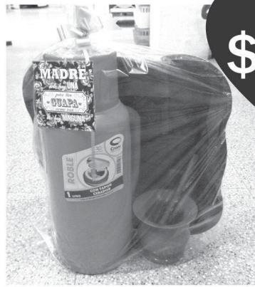
Mate + bombilla