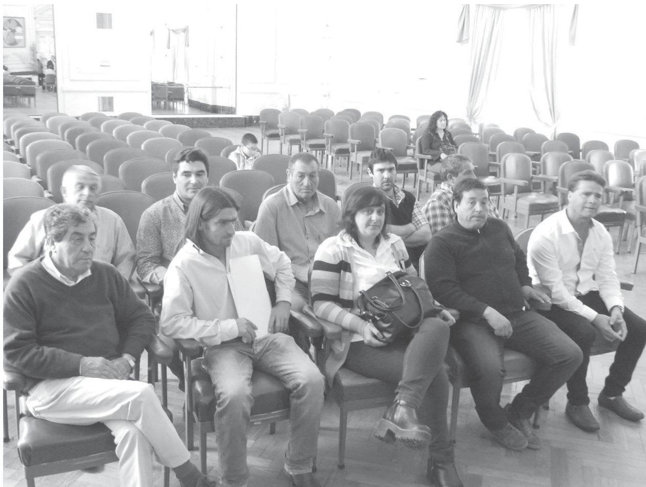
Delegados a cargo de las distintas localidades del Partido de Nueve de Julio.