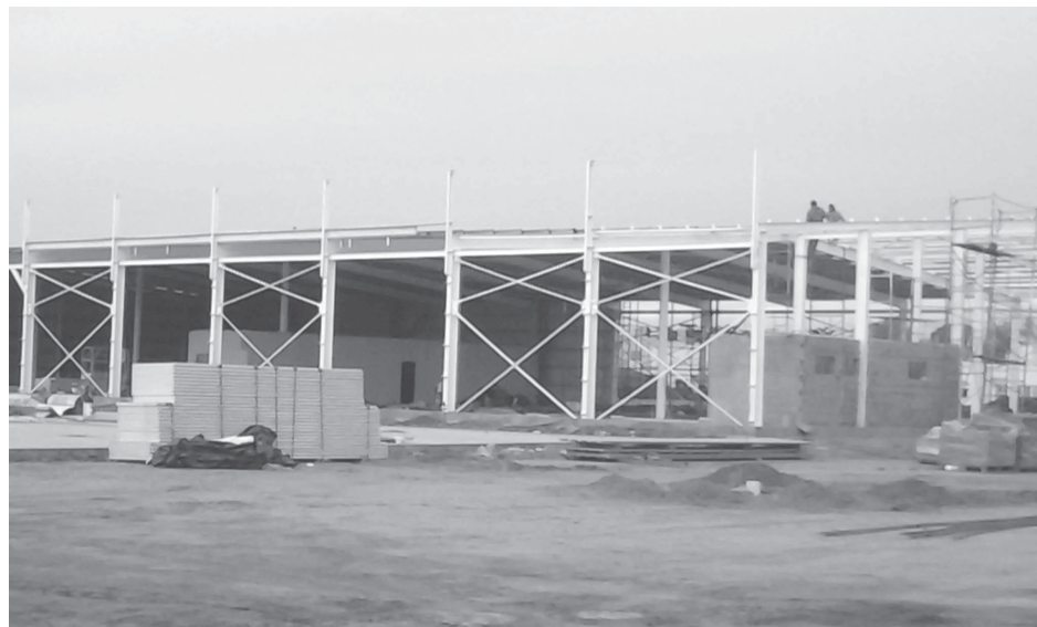
Vista de la imponente obra que lleva adelante en nuestra ciudad Supermercados "La Anónima", que se desarrolla en intersección de avenidas Avellaneda y Agustín Alvarez.

Con un marcado ritmo avanzan las obras de lo que será el local comercial de la sucursal de nuestra ciudad de supermercados "La Anónima", ubicado en la intersección de Avdas. A. Alvarez y Avellaneda.