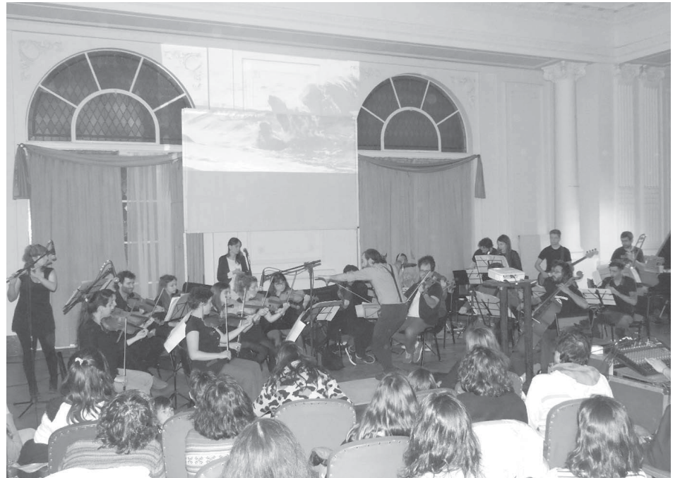
Brillante show musical presentó “Airelíquido”.