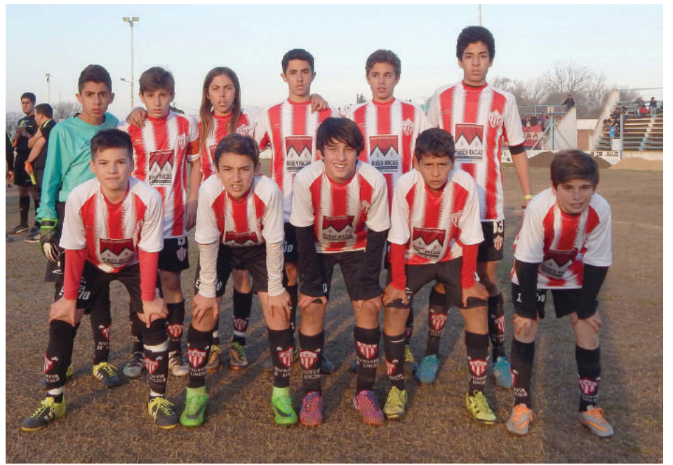
Rivadavia de Lincoln.