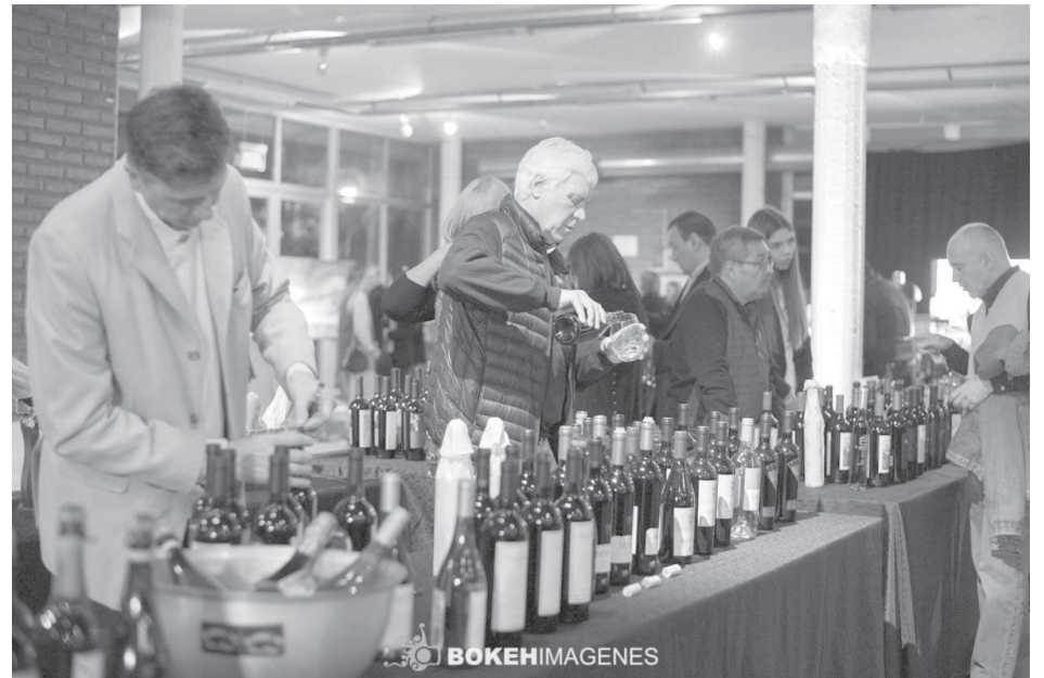
Las principales bodegas y sabores estuvieron presentes en un evento único para la ciudad.