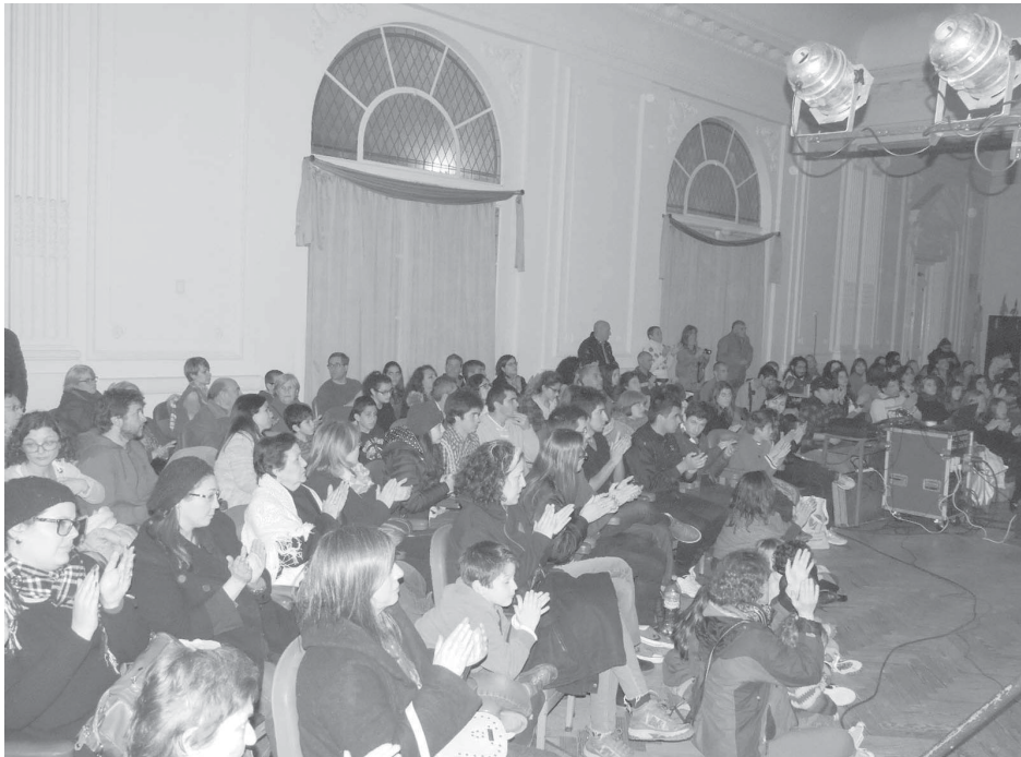
Asistentes al concierto realizado el pasado domingo en el Salón Blanco municipal.

En el Salón Blanco municipal, con entrada libre y gratuita, y en el marco de los festejos por los 200 años de nuestra Independencia, se desarrolló en la tarde del pasado domingo el concierto de la agrupación “Aire Líquido”, organizado por la ONG “Con los