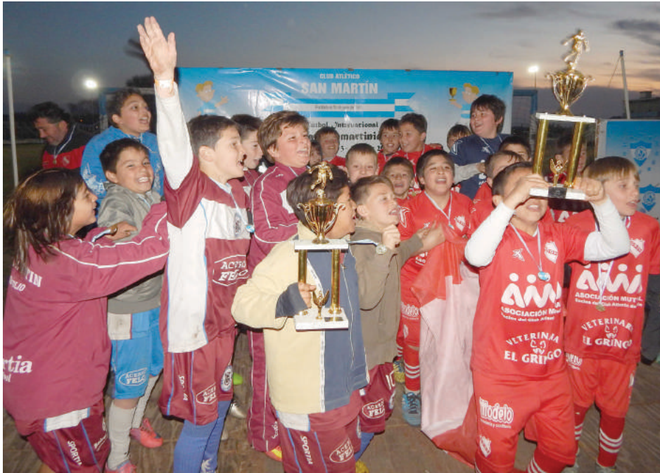
San Agustín y Atlanta, campeones cat. 2005.