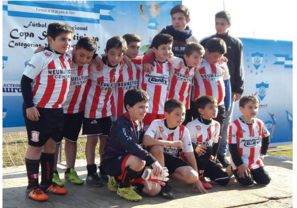
Atlético 9 de Julio.