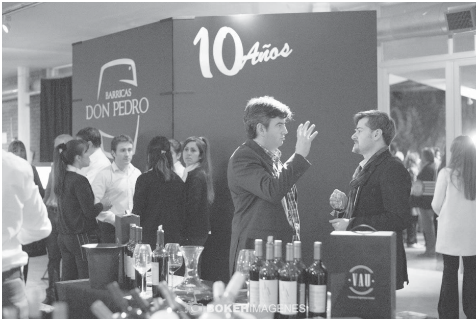
Barricas Don Pedro presentó una gran noche celebrando su aniversario.