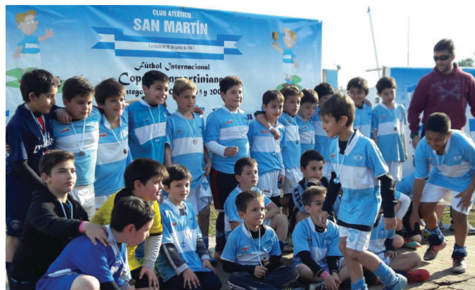
San Martín, ganador de la Copa Bicentenario.