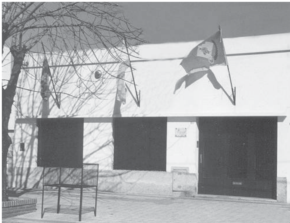
Frente de la casa del CUN en calle 10 que necesita ayuda para obras.

¡Conectate YA! Sin teléfono Vení y consultá nuestros planes Te esperamos en LIBERTAD Y LA RIOJA LOCAL 10