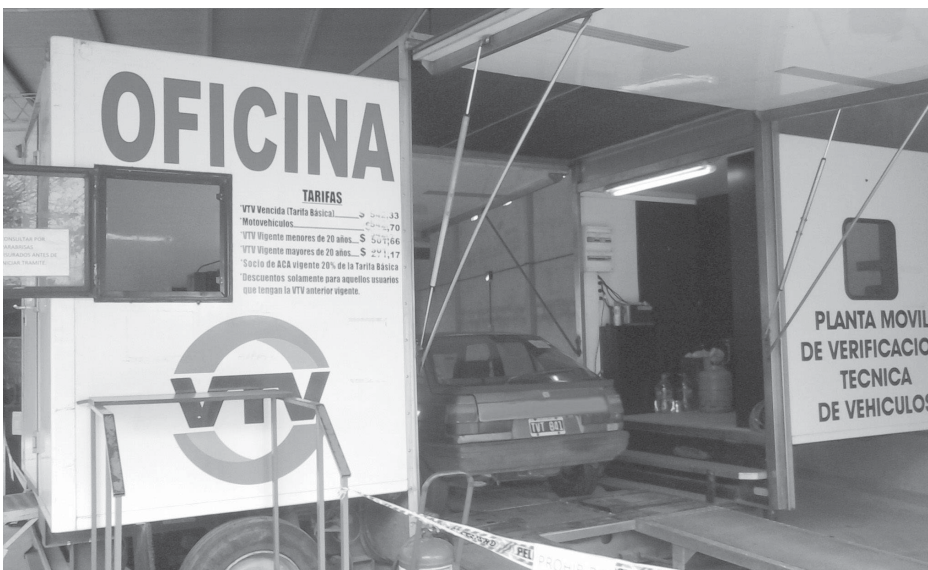
A buen ritmo se sigue realizando la verificación vehicular.