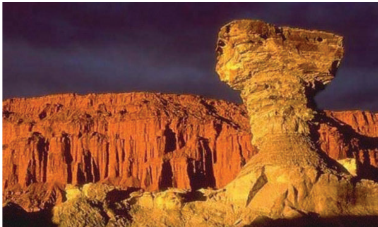
Buen nivel de turistas durante la primera semana de vacaciones en San Juan.

Según el Ministerio de Turismo y Cultura de la provincia, la mayoría de los visitantes provino de Santa Fe, Buenos Aires y Córdoba. La ocupación hotelera fue del 81 por ciento. La cifra se desprende del promedio entre la Ciudad de San Juan, Calingasta, Iglesia, Jáchal y Valle Fértil.