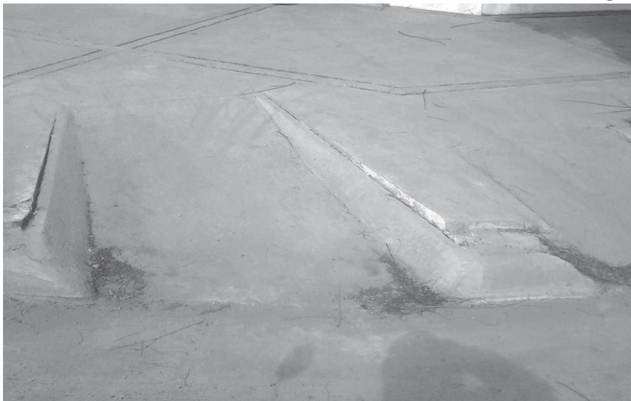
Se realizan rampas suplantando las anteriores que se encuentran mal hechas.