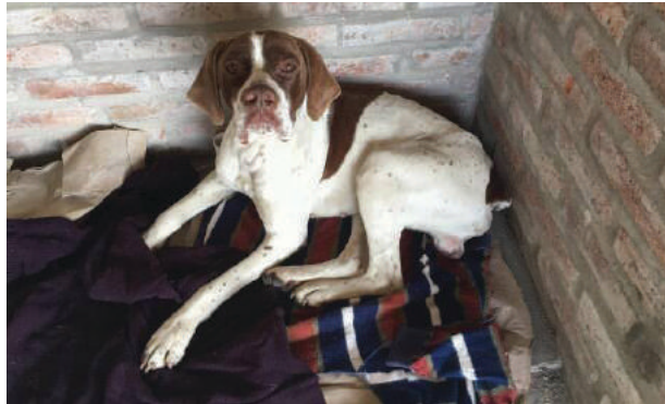
En la zona de El Provincial. llamar al 2317474665