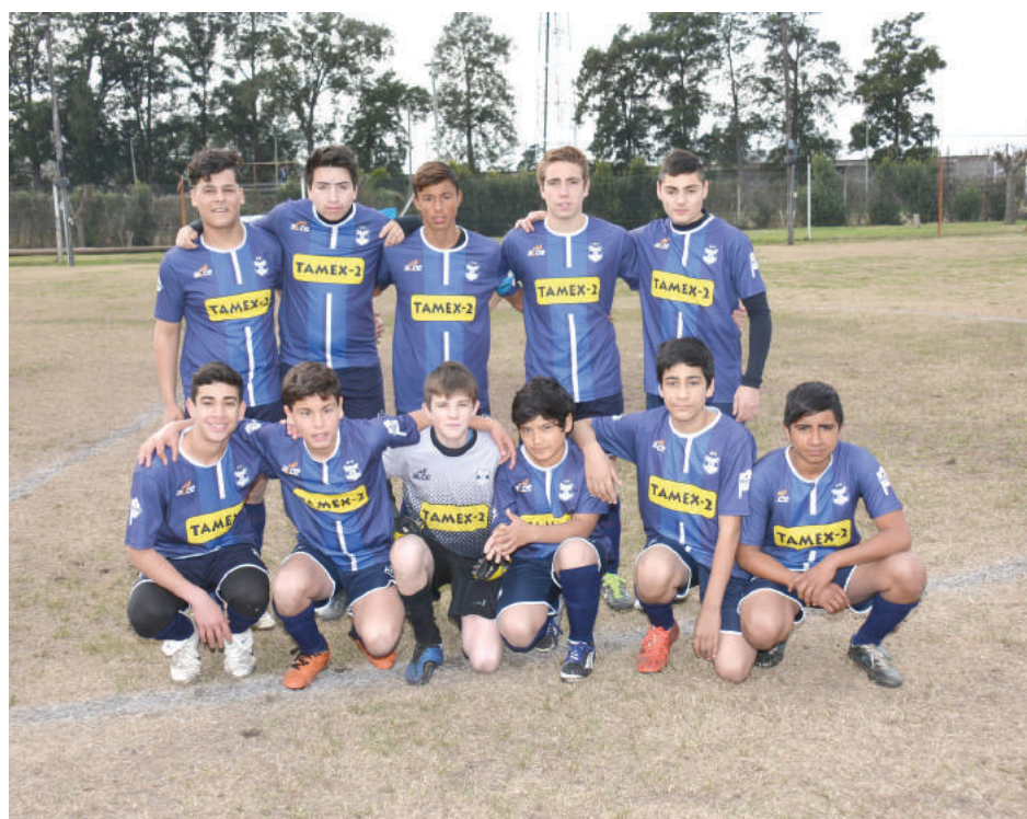
Sexta División Foot Ball Club Libertad.