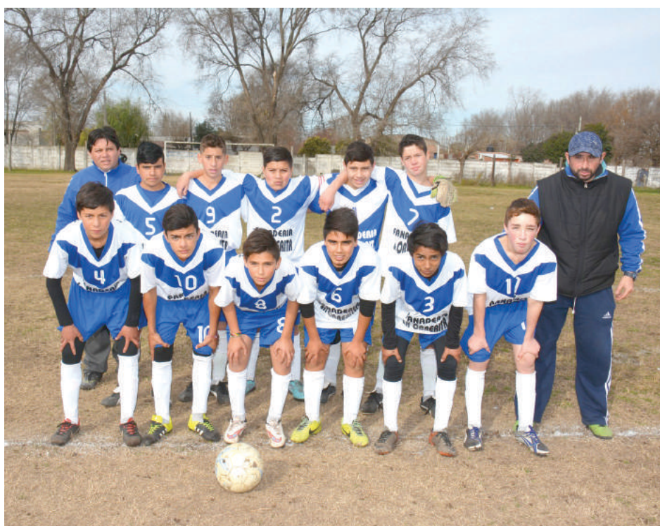
Sexta División Club El Fortín.