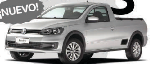
Saveiro Cab. Simp.