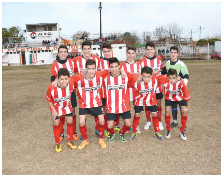
Sexta División Atlético 9 de Julio.