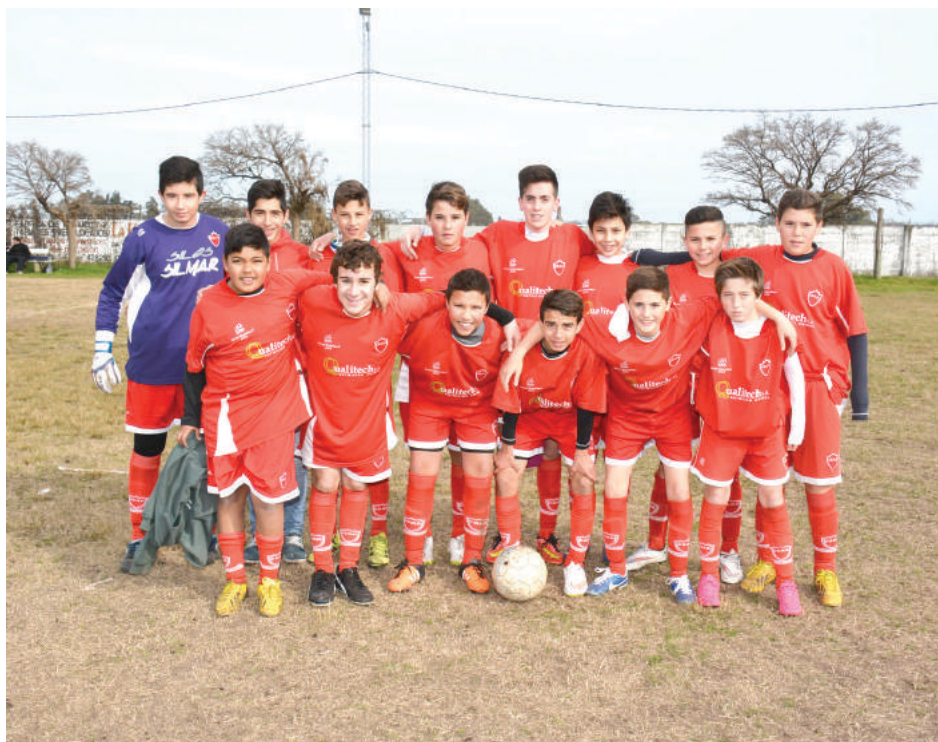
Sexta División Club Agustín Alvarez.