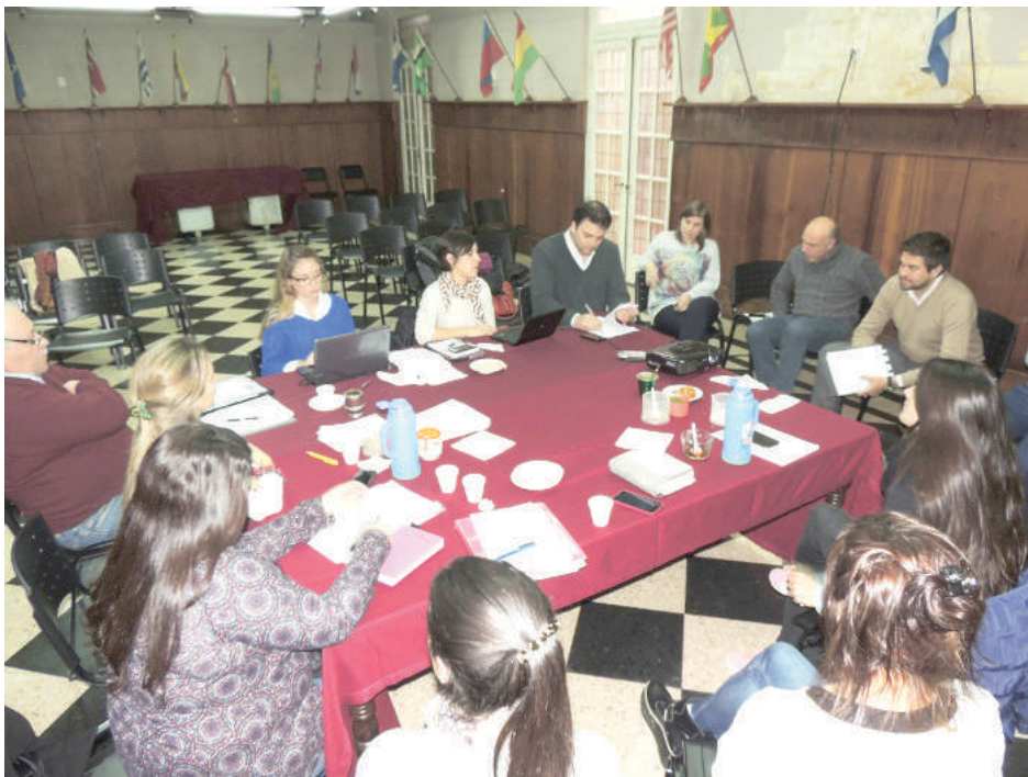
El propio intendente Barroso junto a funcionarios municipales participó de la firma del acta acuerdo.