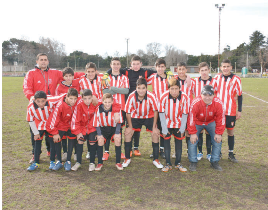
Sexta División Social y Deportivo Dudignac.