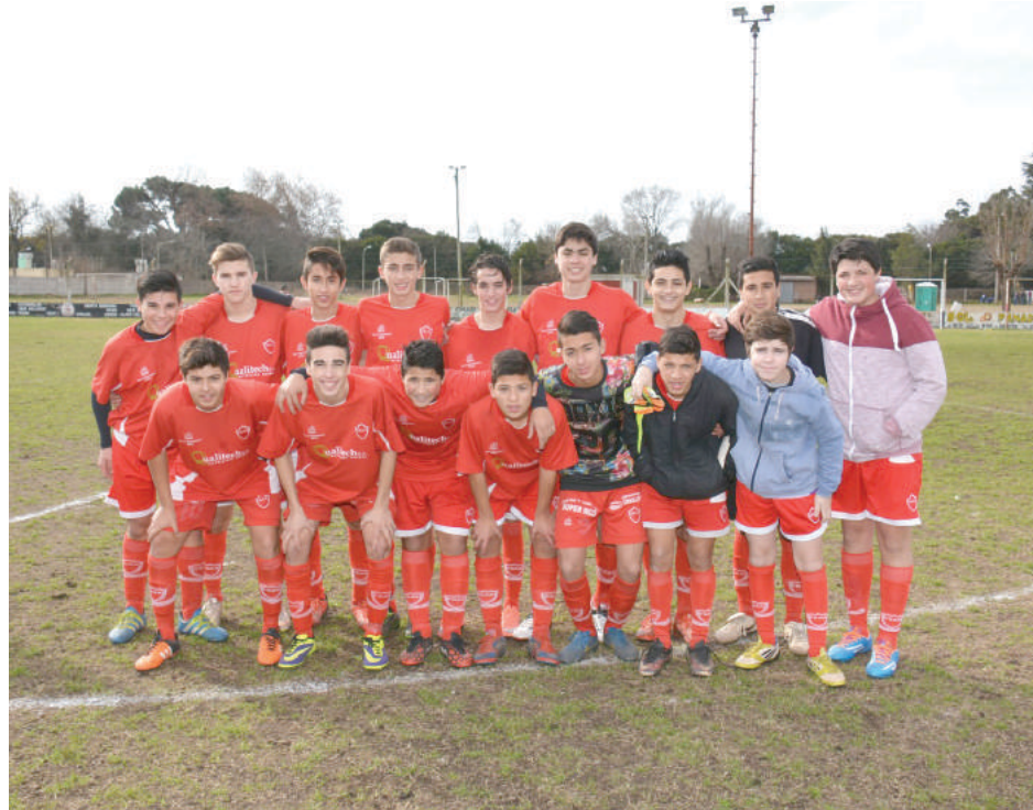
Sexta División Escuela Galvani.