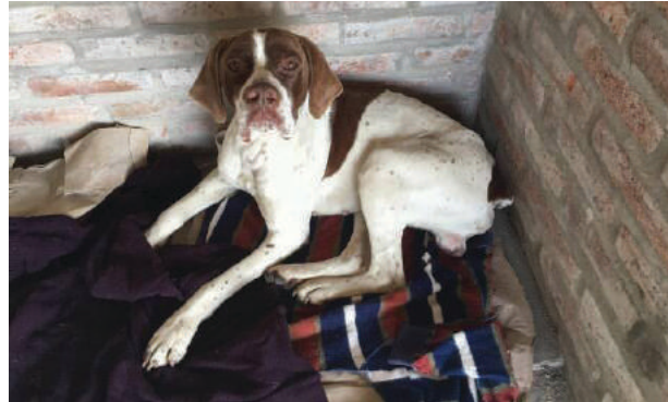
En la zona de El Provincial. Llamar al 2317474665