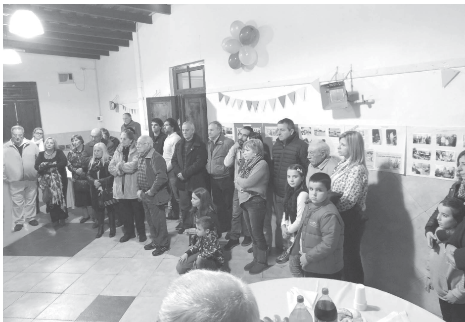
Vecinos de la barriada, ex integrante de la Sociedad de Fomento y representantes de instituciones, presentes.