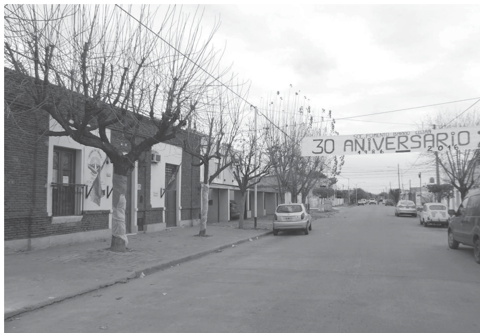
Pasacalle que engala la calle Ramón N. Poratti, frente a la sede de la entidad que cumplió 30 años de servicio a la barriada.

gan distintas actividades de gimnasia, danzas y talleres de cocina”, agregó el presidente, agradeciendo el acompañamiento de todos los frentistas del barrio.