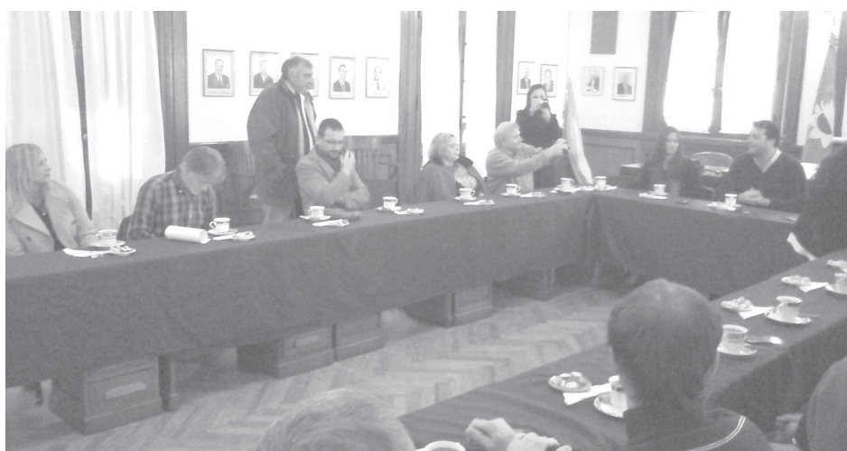
Los distintos medios de comunicación local desayunaron con el Intendente.