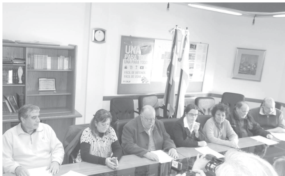
En conferencia de prensa se lanzó el 25to. concurso educativo.

Los trabajos deberán realizarse en equipos de entre tres y cinco miembros, sumándose a ellos un adulto que guiará (padre, docente, ex-alumno o un dirigente cooperativo) en el trabajo.