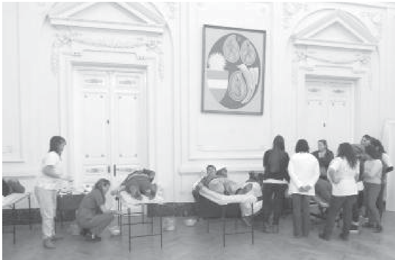
Importante cantidad de donantes se acercaron ayer al Salón Blanco municipal.