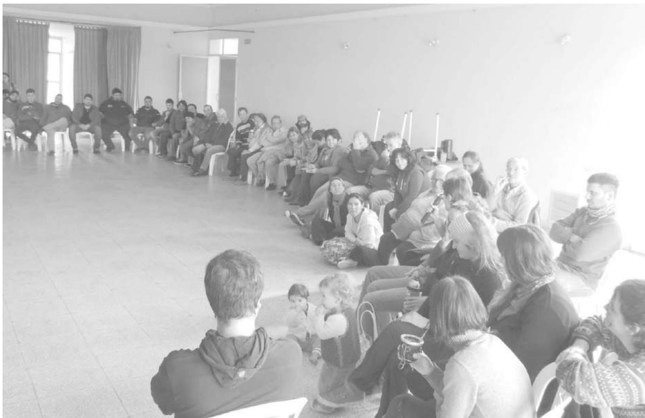
Artistas de todos los géneros se sumaron a la convocatoria.

Con una notable convocatoria, tuvo lugar el día sábado, en el salón de fiestas del Club y Biblioteca Agustín Alvarez, el desarrollo de la 1era. Asamblea de Artistas