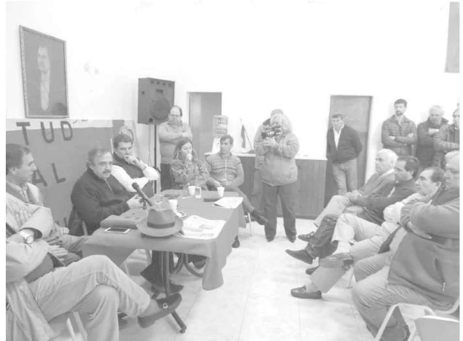
El Radicalismo trabaja para fortalecer el centenario partido.