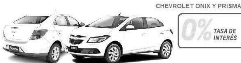
CHEVROLET ONIX Y PRISMA

BONIFICACION HASTA EL 15 DE JUNIO!! - TU MOMENTO ES HOY!!