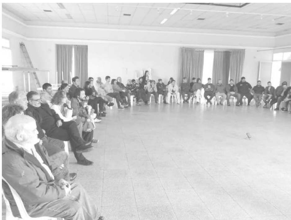
Importante concurrencia de artistas en la tarde del sábado.

las obras y producciones locales, pensar y accionar colectivamente sobre la realidad de la actividad, reconocer trayectorias, expresar necesidades y consensuar propuestas". La Secretaria de Cultura,