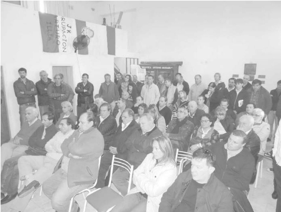
Legisladores y dirigentes de la Cuarta Sección participaron de la jornada.

fuerzas políticas, ya que el Gobierno no posee mayoría en las cámaras, y ya sea por necesidad o por virtud, se habrá de recuperar el diálogo y por ende la política". Alfonsín confió, por otra parte que "a partir del segundo semestre comenzarán a generarse cambios progre-