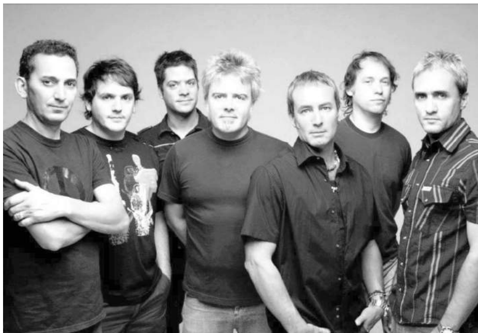
Los Pericos realizarán el cierre de AcercArte.

Se presentarán las bandas "Miranda" y "Los Pericos", en forma totalmente libre y gratuita, en Plaza Belgrano - Además se contará con espectáculos para niños, talleres y obras de teatro para adultos, con artistas de gran renombre.