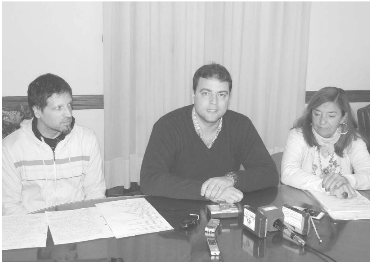
El Intendente junto a funcionarios adelantó el evento a la prensa local.