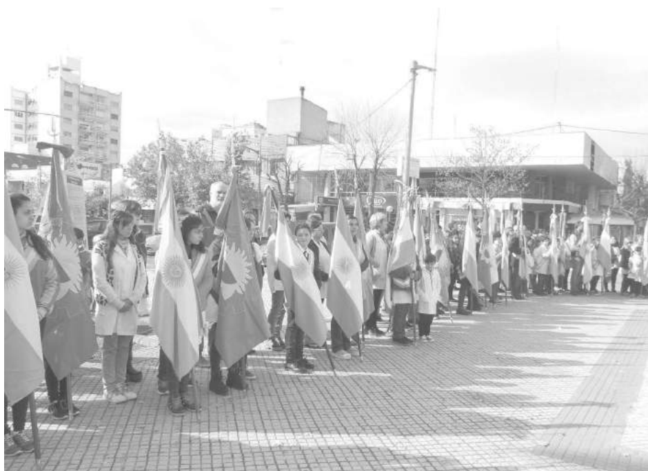
Abanderados de distintos establecimiento educativos que participaron del acto.