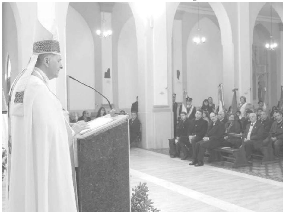
El Obispo llamó a la reflexión a las autoridades y saber interpretar el mensaje de la Iglesia al ser el Año de la Misericordia.

En primer lugar, sabedores de coexistir en una sociedad plural con personas de diversas convicciones y sensibilidades, no creyentes y creyentes de otras confesiones, sin embargo, reunidos en la Iglesia católica es recordar nuestro origen como nación y por lo tanto nuestra propia identidad como pueblo. En