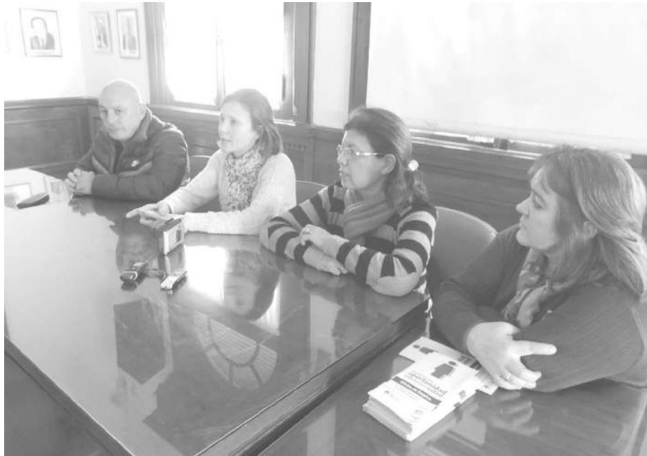
Los concejales Delgado, Gentile, Vallejos y Gil brindaron detalles de la sesión.