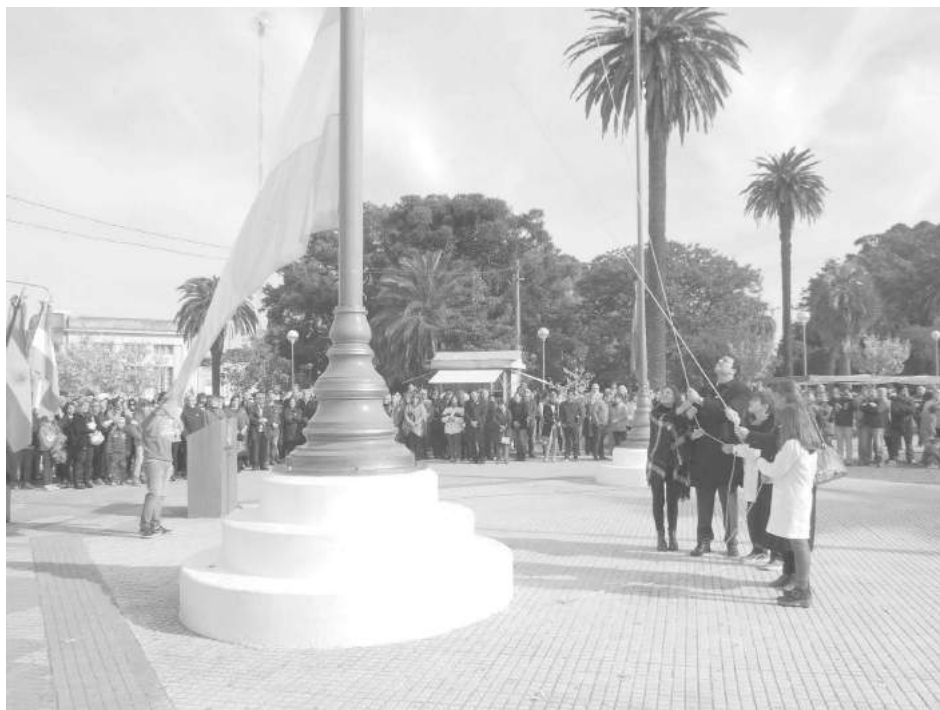
El Intendente junto a la presidente del HCD, la Inspectora Jefe Distrital y dos alumnos izan la Bandera Nacional.

Al cumplirse en la víspera Municipalidad de Nueve de Julio llevó adelante los actos en Plaza General Belgrano. Los mismos se iniciaron a las 10,00 hs. con la re- el 206to. aniversario de Julio llevó adelante los actos Los mismos se iniciaron a las 10,00 hs. con la re- la Revolución de Mayo, la oficiales conmemorativos a las 10,00 hs. con la re-