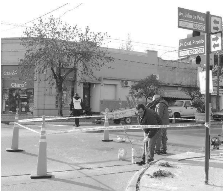
La Municipalidad de Nueve de Julio, a través de la Dirección General de Tránsito, procede a realizar demarcación horizontal en la intersección de Avda. Cardenal Pironio y Vedia, en tanto que posteriormente se continuará por otros sectores de la comunidad.