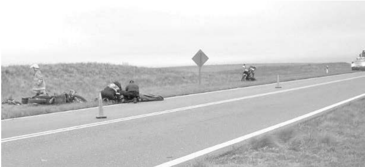
Lugar del trágico accidente.

Ocurrió cerca de las 15 hs. de ayer, en el kilómetro 666 de la Ruta Nacional N° 188, a unos 30 kilómetros de Unión, en la provincia de San Luis - Viajaba junto a un grupo de motociclistas a un encuentro en General Alvear, Mendoza.