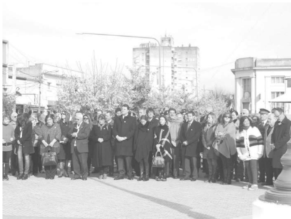
Autoridades municipales, eclesiásticas y concejales presentes.

cepción de autoridades en asistentes, el que se sirvió Posteriormente, a las 10,30 el Palacio Municipal y un en el hall de entrada del hs., se ofreció el tradicional chocolate para los alumnos Palacio Municipal. Te Deum en la iglesia Ca-