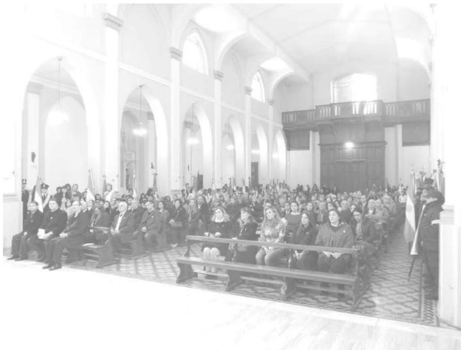
Asistentes al Tedeum desarrollado ayer en Iglesia Catedral.

vivencia social e inhiben todo desarrollo, avance y crecimiento de una nación. ¡Encuentro, diálogo y acuerdos superadores deberían ser consigna y propósito permanente de nuestra tarea cotidiana! En esto consiste nuestra oración de hoy y a ello apuntan las reflexiones pastorales que ponemos de manifiesto. Permítanme, ahora, ex-