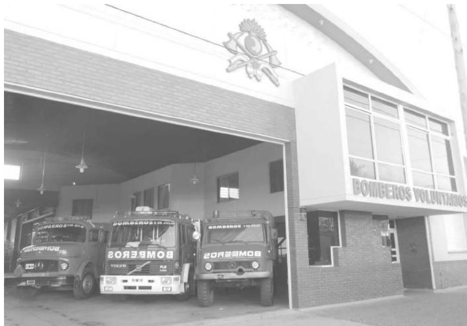
Frente del cuartel de Bomberos ubicado en Avda. Vedia al 400.