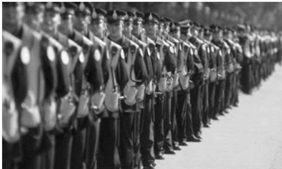
“Desde hace años los vecinos de los distintos partidos de la Provincia, reclaman mayores medidas de seguridad”, describieron los mandatarios.

Unos 54 jefes comunales que integran la Federación Argentina de Municipios (FAM) reclamaron a la gobernadora de la provincia de Buenos Aires, María Eugenia Vidal, que implemente medidas para aumentar la seguridad en esos distritos. Reclaman que las diferentes fuerzas estén presentes en todos los distritos y solicitaron la intervención del gobierno nacional por ser una temática que atraviesa todo el país.