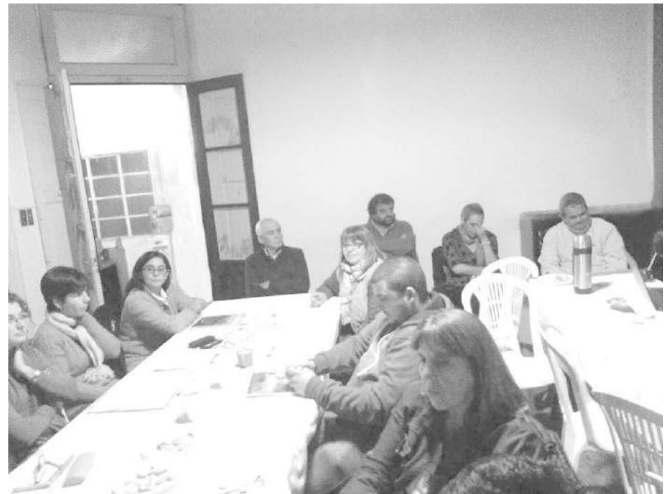
Imágenes de la nueva jornada realizada por el GEN el pasado miércoles y donde los participantes presentaron 10 proyectos a evaluar.

El miércoles, en el Partido GEN de nuestra ciudad, se llevó adelante un nuevo encuentro de Formación Política abierto a todos los interesados en profundizar el conocimiento sobre los gobiernos locales.