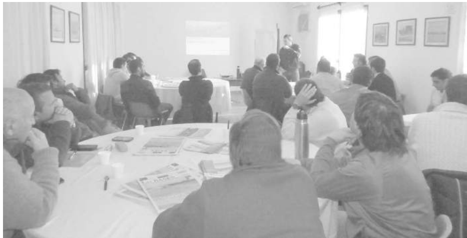
Productores presentes en el taller de trigo realizado en Sociedad Rural.

En la mañana de ayer, la Sociedad Rural de 9 de Julio llevó adelante en sus instalaciones un "Taller de Trigo", abordando aspectos de "Comercialización y Calidades", a través de la Consultora Globaltecno. "A mediados y fines de este mes comienza la siembra de los trigos de ciclo largo, y ante la toma de decisiones por los distintos potenciales, creemos que esta charla es de suma importancia para todos los productores", evaluó en diálogo con los medios de prensa con