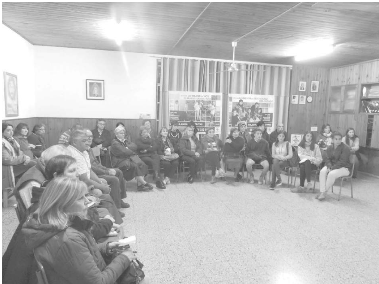
Integrantes de Cáritas, instituciones y colaboradores; presentes en la reunión informativa.