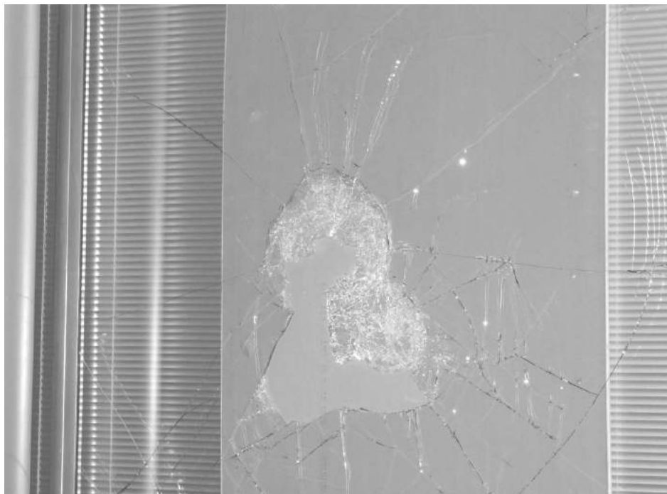
Rotura del vidrio por la que el malhechor extrajo la netbook.