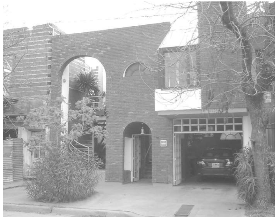
El hecho delictivo se produjo en la madrugada de ayer mientras los dueños descansaban.