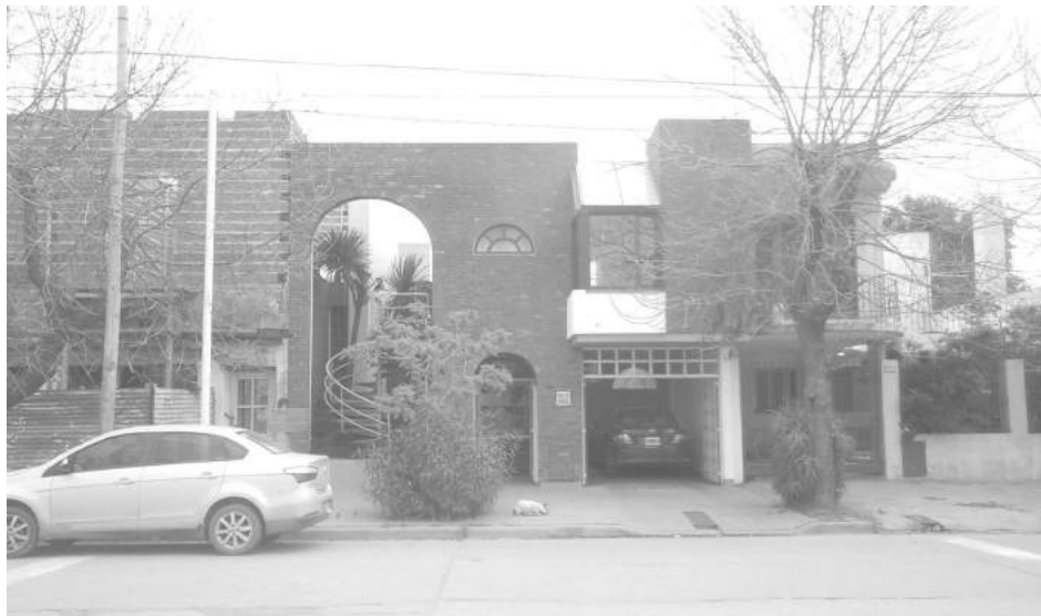
Conmoción en los vecinos tras el episodio vivido.

El primer hecho ocurrió en horas de la madrugada, el otro aproximadamente a las 21.15, ambos en la jornada de ayer - Un matrimonio de profesionales fue sorprendido cuando descansaba por dos delincuentes encapuchados esgrimiendo un arma de fuego golpearon al propietario de la vivienda y se alzaron con una importante suma de dinero y joyas - Por la noche, tras la rotura de una vidriera se apoderaron de una notebook. - Nuestro medio dialogó con las víctimas de ambos ilícitos. Inf. en Págs. 3 y 20.