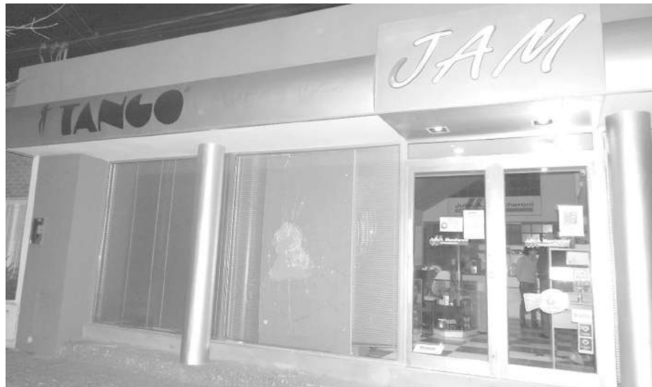
Frente del local de "Julio A. Mascheroni" donde se observa la rotura del vidrio.