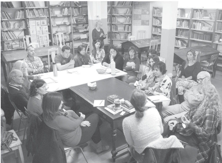
Asistentes al taller dictado el pasado sábado.