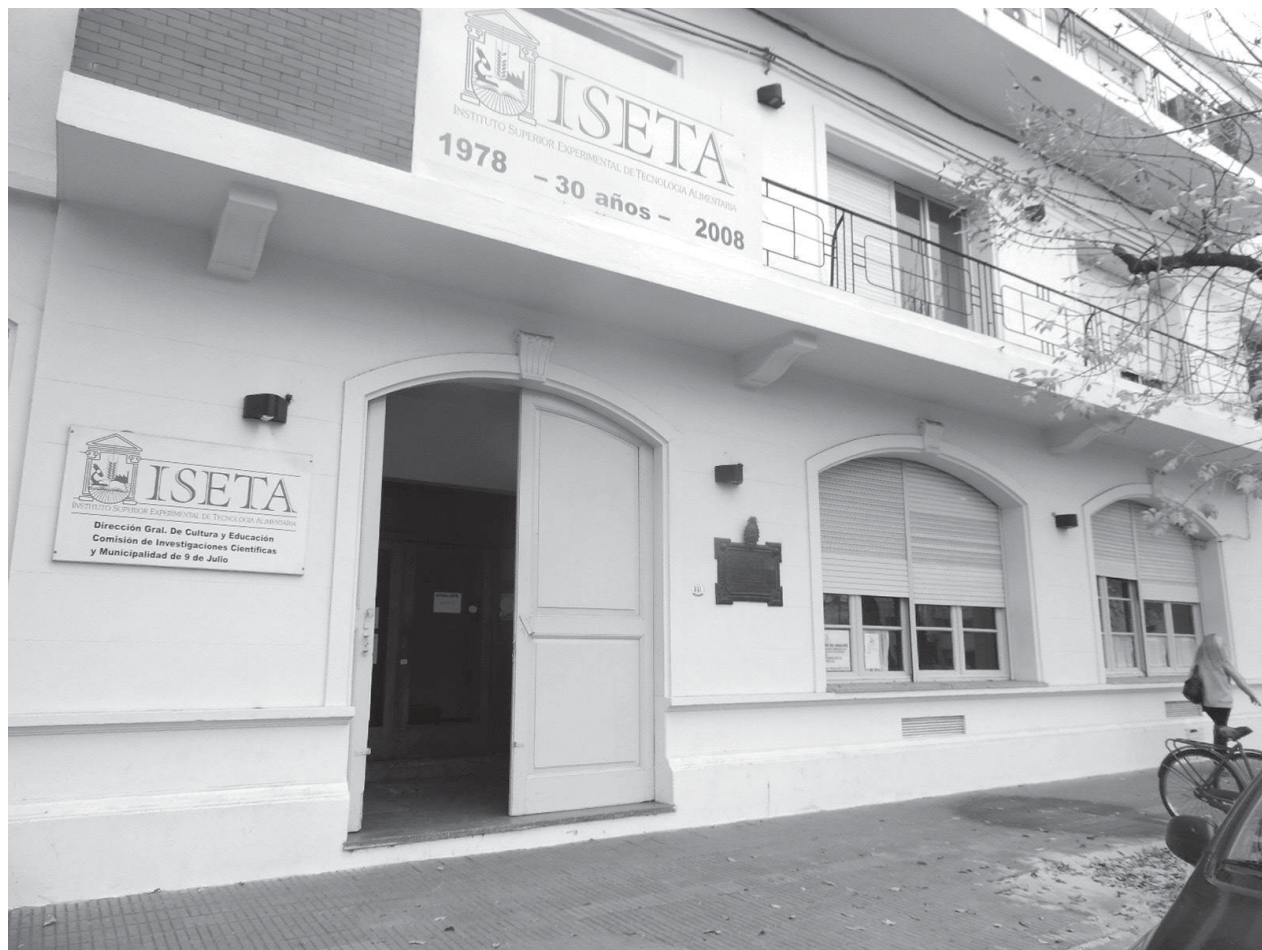
Frente del instituto educativo modelo nuevejuliense reconocido a nivel nacional.

El presidente de la bancada de diputados provinciales de Cambiemos comprometió su apoyo en el objetivo de obtener un terreno o un edificio anexo para el Instituto. Inf. en Pág. 4