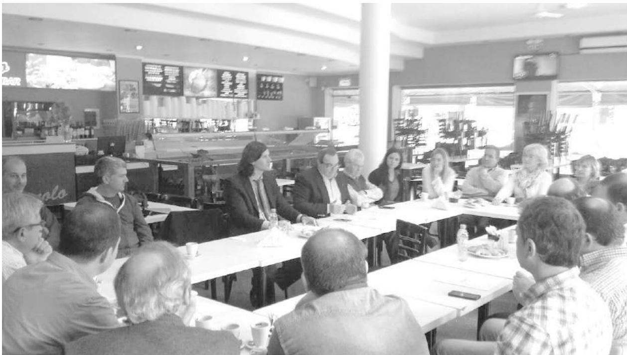
En importante reunión los martilleros públicos mostraron desacuerdos con las medidas tomadas.