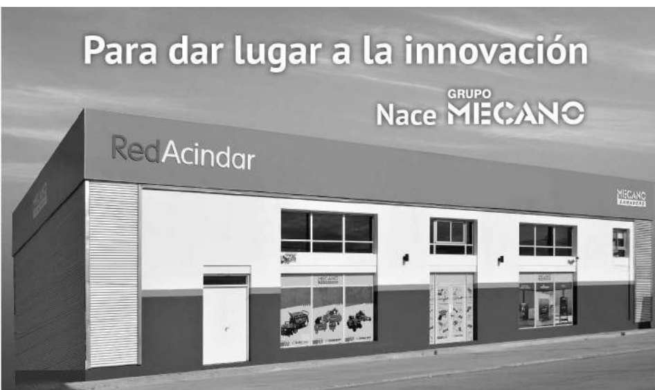
Desde el 18 de Abril los esperamos en Antonio Aita 1930 - Parque Industrial