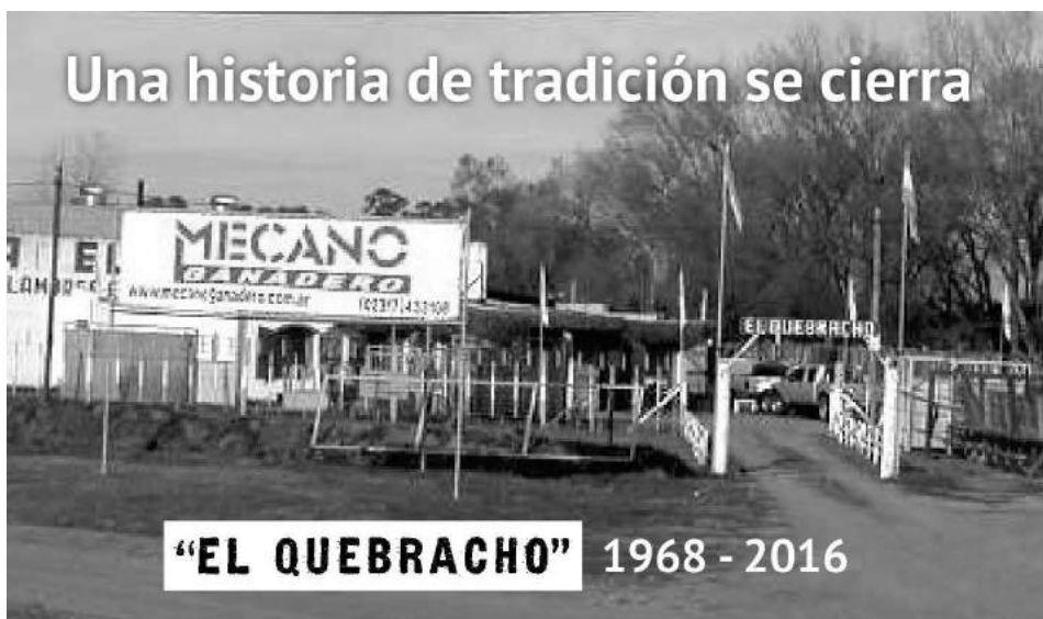
“EL QUEBRACHO” 1968 - 2016