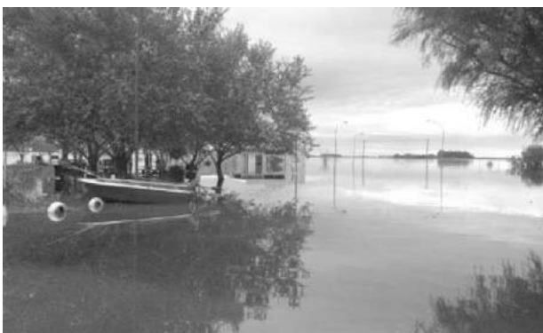
La laguna Cuero de Zorro en el foco de las discusiones.

El alcalde se mostró muy enojado con el ministro del inte-