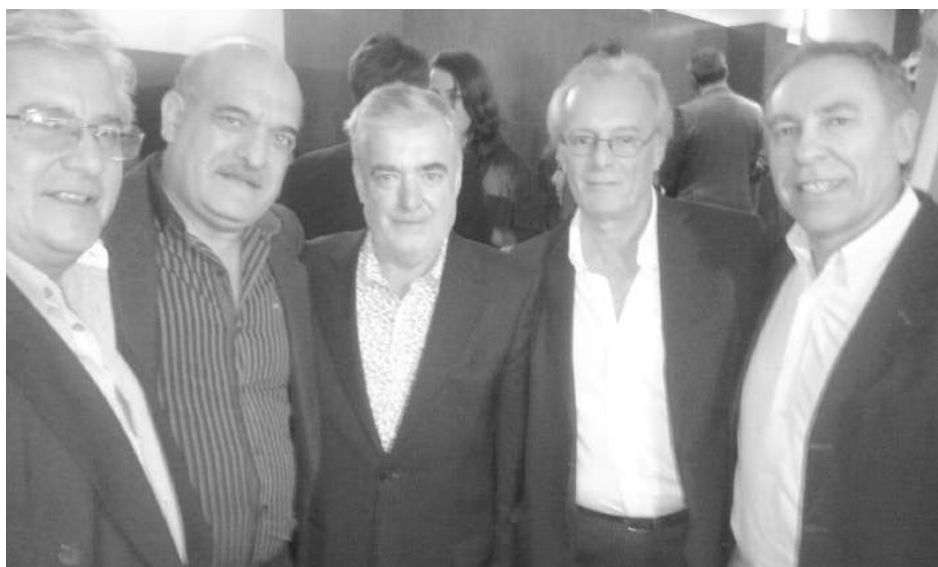
Dirigentes de FESCOE, Presidente de CONAICE Omar Malondra y Gobernador de Chubut Mario Das Neves.

Los días 14 y 15 de abril en Puerto Madryn (Chubut) se desarrolló un Encuentro Nacional de Cooperativas Eléctricas y de Servicios de todo el país, organizado por la Confederación Nacional de Cooperativas Eléctricas (CONAICE), Federación Chubutense de Cooperativas de Servicios Públicos Ltda. (FECHCOOP) y Federación Cooperativas