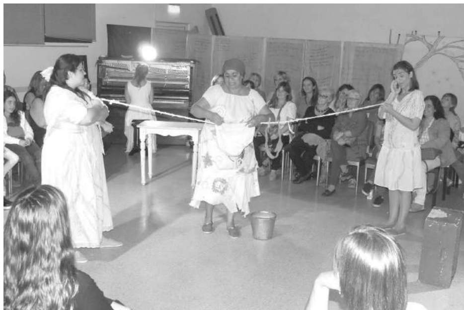
Una vez más se presentó la exitosa obra teatral con artistas locales.