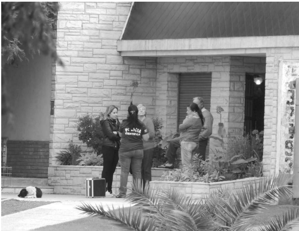
Personal femenino de Policía Científica trabajó en el lugar del hecho.