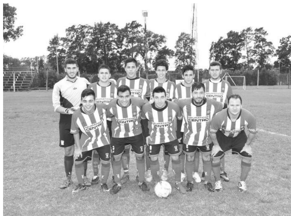
Atlético 9 de Julio.