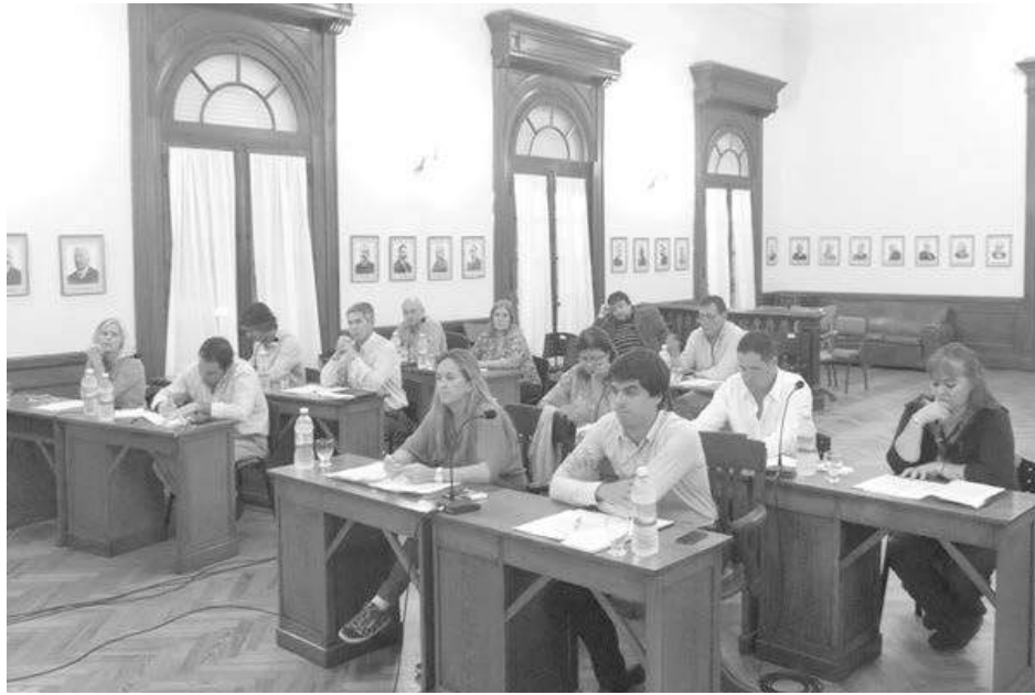
Pasaje de última sesión que realizó el H. Concejo Deliberante.