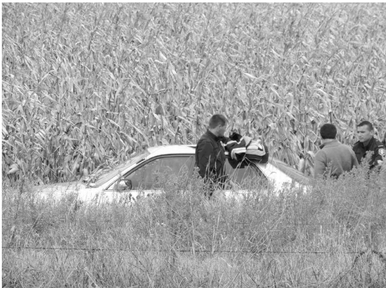
La unidad Toyota detuvo su marcha dentro de un campo luego del despiste.