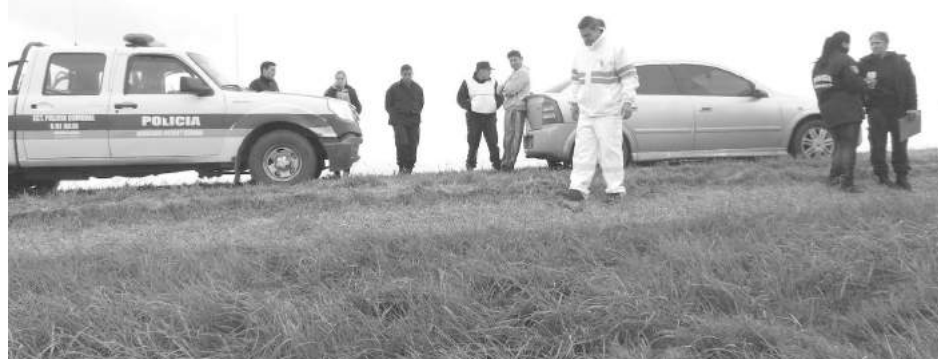
El accidente se produjo en la Ruta Nro. 5 km. 271.