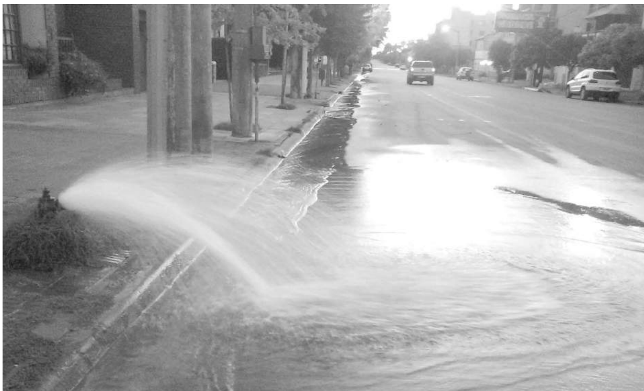
Una de las bocas de agua abierta para la depuración del sistema en Mitre y Frondizi.