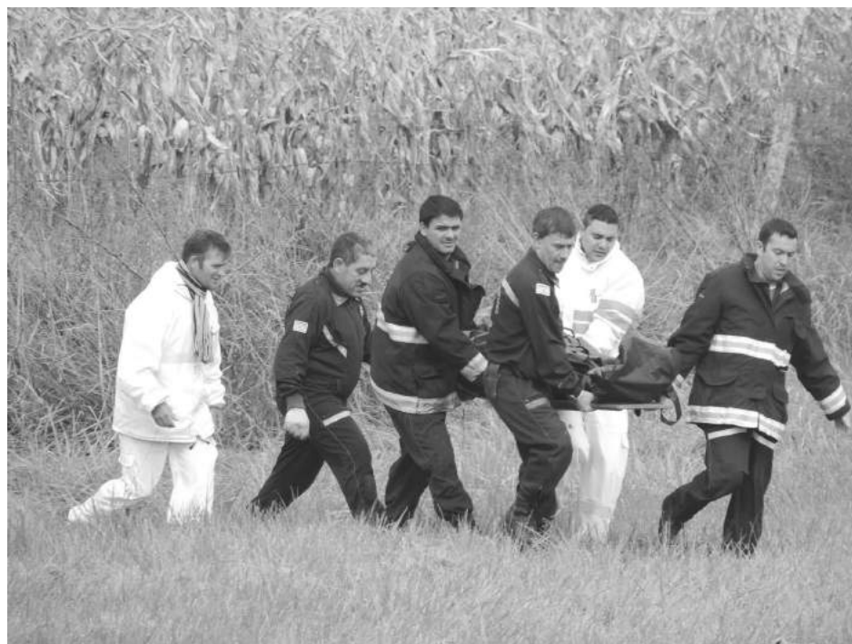
Bomberos Voluntarios y personal del peaje realizan el traslado de la víctima.

En diálogo con nuestro medio, el Subcomisario