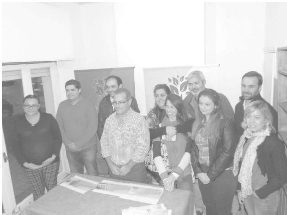
Integrantes del Centro de Estudios de Políticas Municipales.