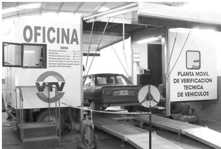
La planta móvil empieza su servicio de verificación hoy a partir de las 8.30 hs.

Si es mayor a 20 años y la VTV se encuentra