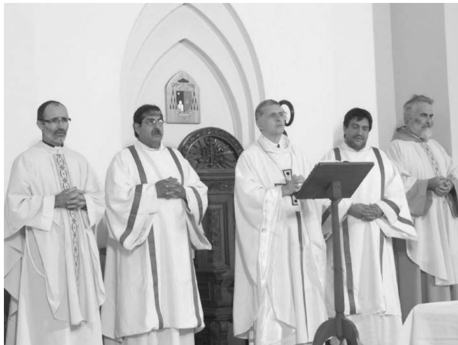
Pasaje de la ceremonia religiosa realizada ayer en Iglesia Catedral.

El obispo de Nueve de Julio, Monseñor Ariel Torrado Mosconi, presidió este jueves 17 de marzo la misa