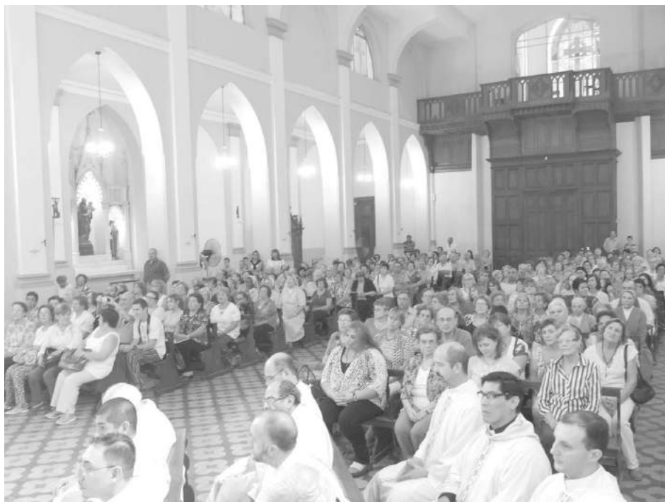
Sacerdotes y fieles presentes en la misa crismal.