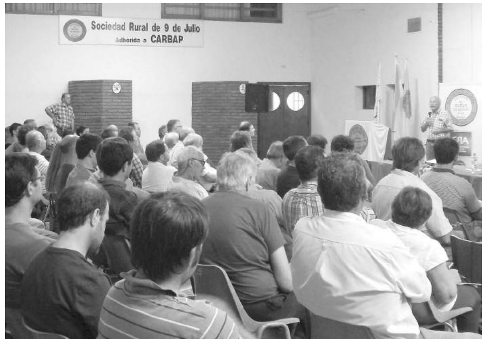
El Ing. Ventimiglia dio la bienvenida a los presentes en nombre de INTA.

daciones a adoptar en este sentido es observar los suelos y que los mismos no tengan limitantes, como sucede con el sodio en esta región, buscando las especies que se adapten a cada una de ella”, expresó el especialista, marcando que en general “se trata de especies resistentes a los excesos hídricos, aunque no a suelos inundados; lo que nos entrega un potencial importante”.