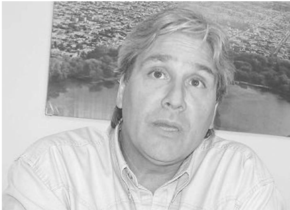
El presidente de la Cámara de Comercio adelantó a los medios detalles del temario.

Una amplia agenda de temas ocupará el encuentro.