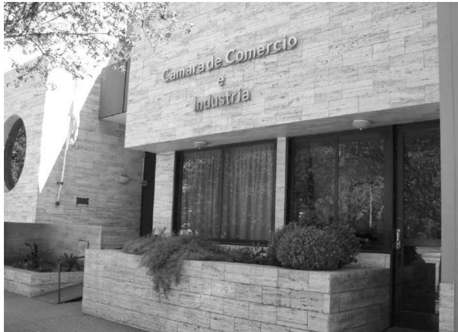
La primera reunión del Nucleamiento se realiza en nuestra ciudad.