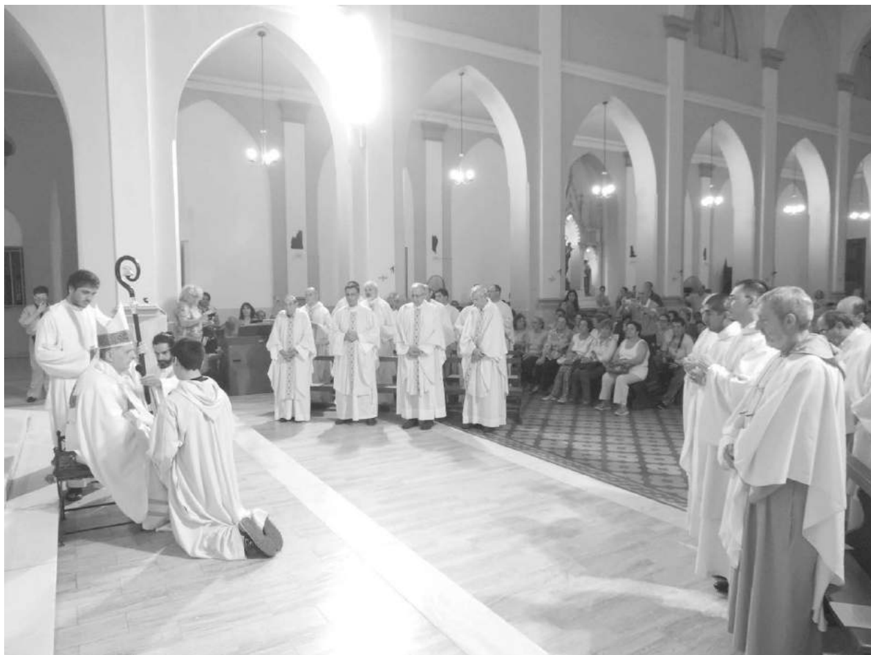
El Obispo realiza la renovación de votos a los sacerdotes de la Diócesis.