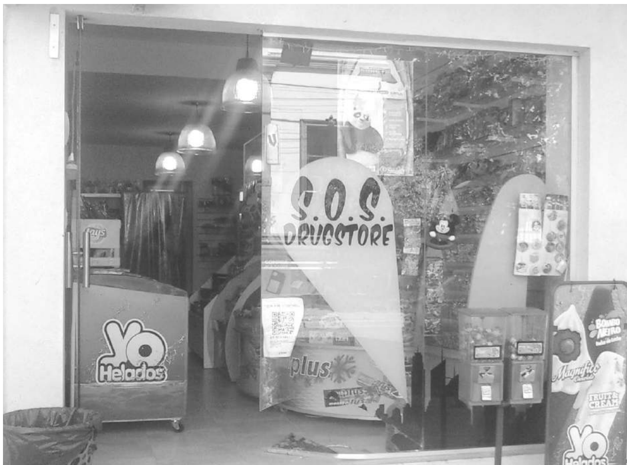
Los ladrones rompieron la parte de abajo de la puerta de blindex para ingresar.

En horas de la madrugada de la víspera, un nuevo hecho de robo se agregó a una preocupante seguidilla dada en los últimos días en diferentes comercios del radio céntrico de la ciudad, a los que se suma también el hecho registrado en la Escuela Nro. 52 - Tras romper una puerta de vidrio, malvivientes se alzaron con remeras deportivas, cigarrillos y una suma estimada en $ 2.000 en efectivo. Inf. en Pág. 2.