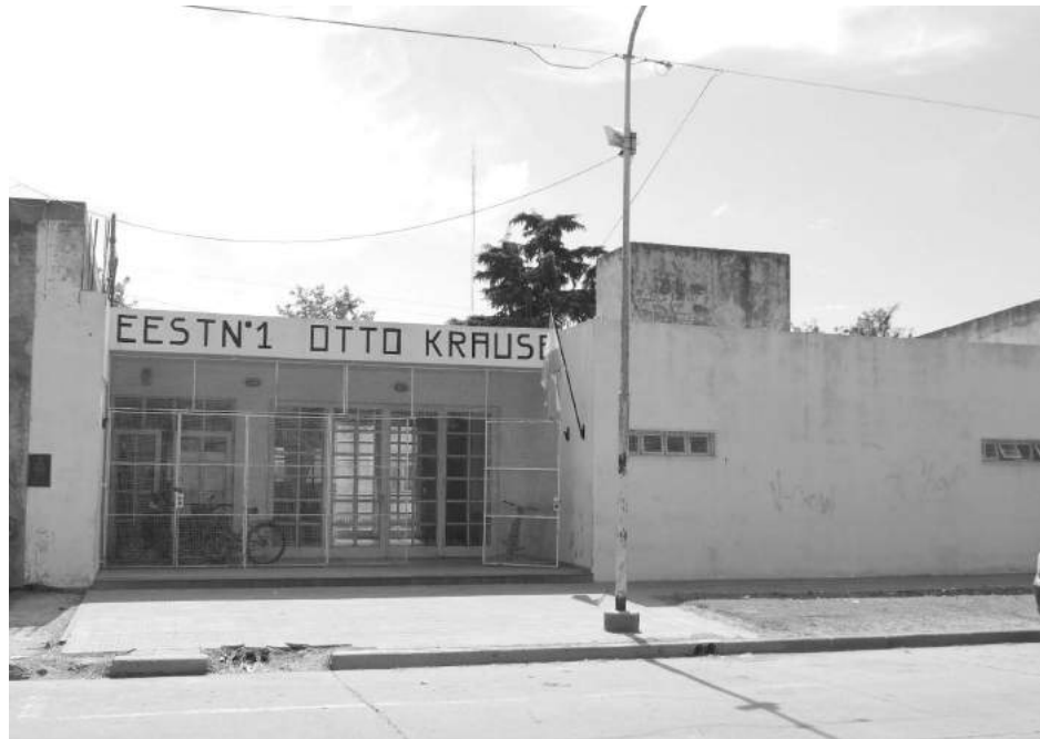
La Escuela Otto Krause tiene variada oferta educativa.