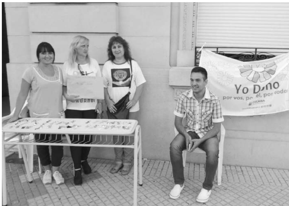
Autoridades de Manhala dialogaron con nuestro medio.

En la noche de este pasado lunes, en el Salón Blanco del Palacio Municipal, la Asociación "Manhala" procedió a la entrega de certificados a doce vecinos de nuestro medio que recibieron trasplantes, los que fueron tramitados por la entidad ante el CUCAIBA en el marco de la Ley de Trasplantes 26.928.