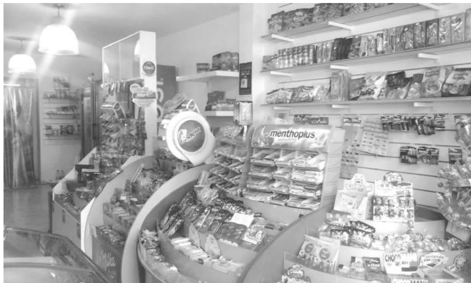
Preocupación del propietario del negocio por el hecho ocurrido.

En horas de la madrugada de la víspera, un nuevo hecho de robo se sumó a una preocupante seguidilla dada en los últimos días en diferentes comercios del radio céntrico de la ciudad, a los que se agrega también el hecho registrado en la