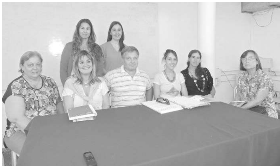
Autoridades de CEPRIL, municipales y de otras entidades.

Acompañando una iniciativa impulsada por el Centro Privado de Rehabilitación del Lisiado (CEPRIL) y distintas entidades que trabajan con la discapacidad (AFAPDi, El Taller Protegido, Manhala, Juntos a la Par, Portal Miró