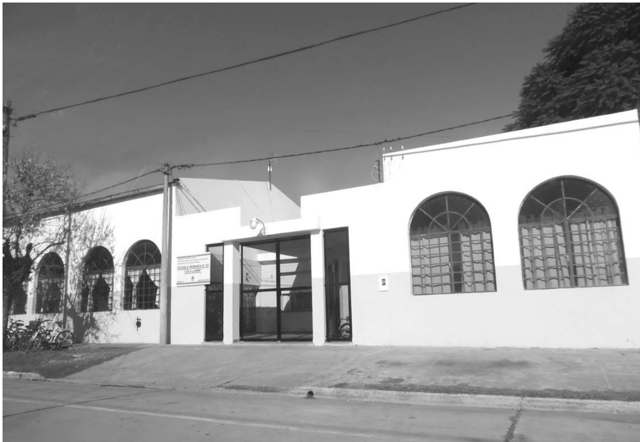
Nuevamente el establecimiento educativo fue blanco de los malvivientes.

Indignación de la comunidad educativa, que en octubre había sufrido la sustracción de material deportivo.