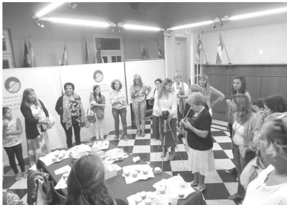
Los participantes de la jornada posan para Tiempo.