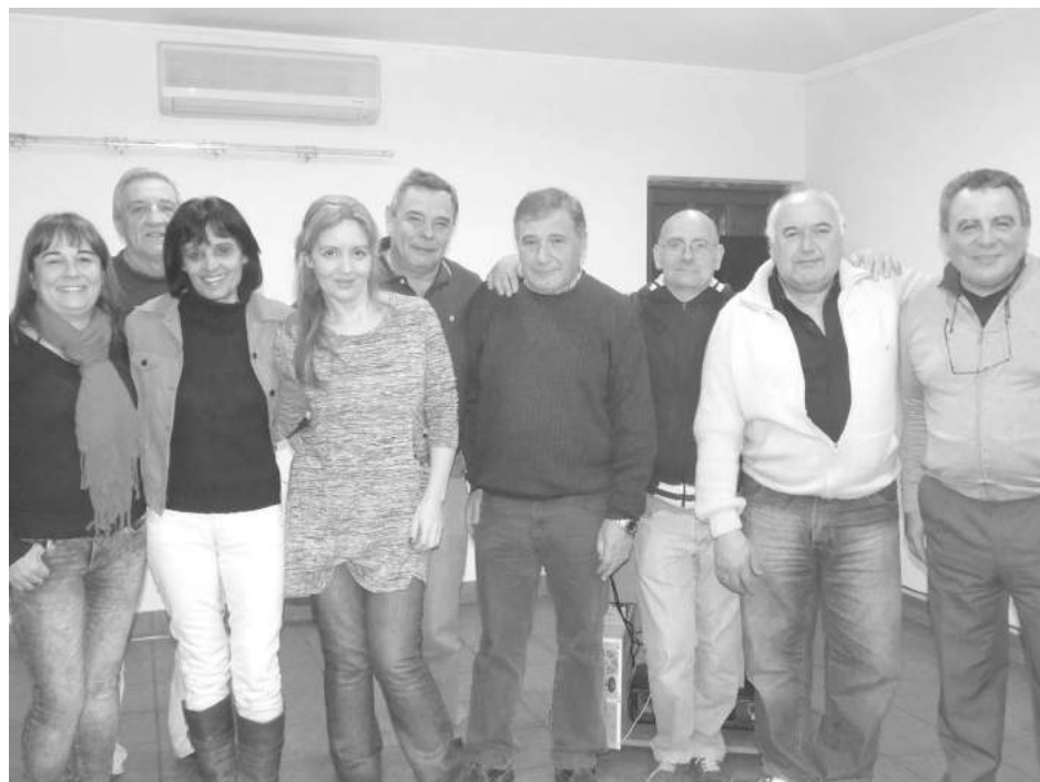
Integrantes del elenco y colaboradores, después de uno de los ensayos.