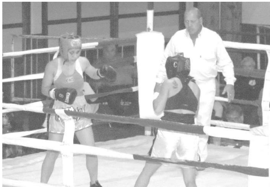
La pelea femenina fue empate.