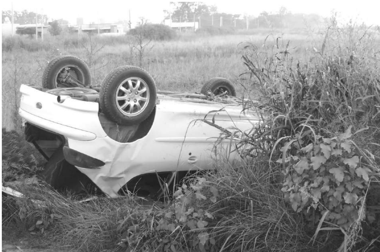
El Peugeot 206 totalmente volcado en la banquina de la calle Azcuénaga.