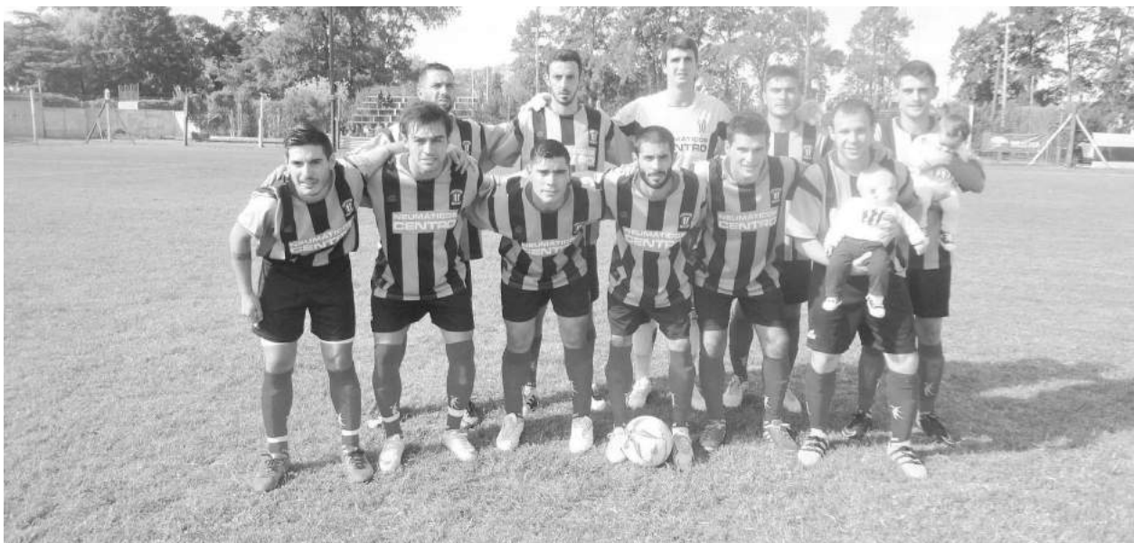
Atlético 9 de Julio.

Pese a los dos hombres menos, el Lagunero logró ponerse en ventaja por intermedio de Miraglia en la última jugada del primer tiempo. En el complemento, Libertad cuidó la diferencia y debió retrasarse aún más con