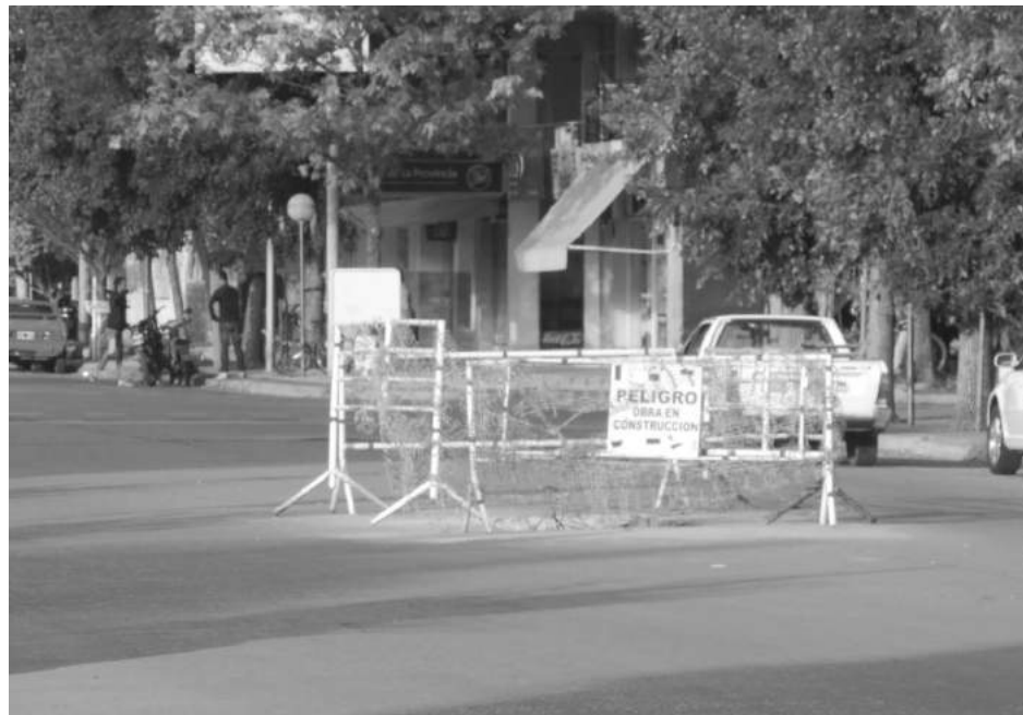
El vallado guarda una obra que se realiza desde el municipio.

Se investigan las causas del accidente registrado en el lugar, donde se realizan trabajos de reparación del pavimento.