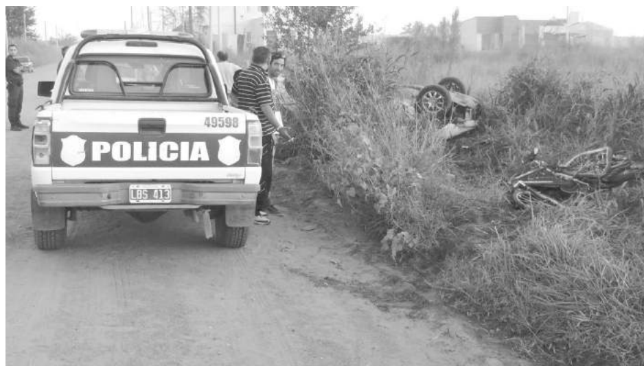
Elocuente vista del automóvil y a unos metros los dos vehículos de menor porte.