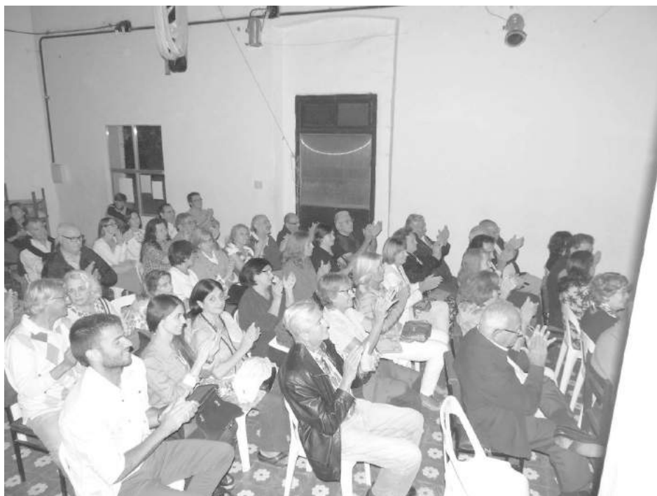
El público acompañó el recital del reconocido artista.

El reconocido folklorista Gerardo Machi Falú, ya radicado en nuestra ciudad, se presentó en "La Esquina, Arte y Cultura", el pasado sábado a las 21,30 hs. La presentación dio lugar a una noche muy especial, con guitarras, canciones y poesías, "repasando