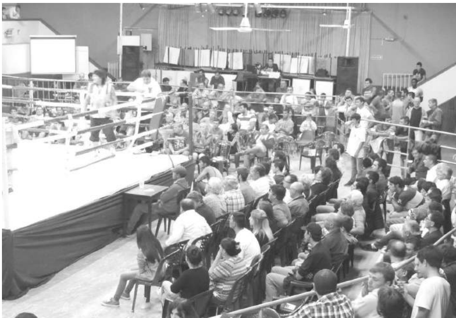
El público acompañó la velada boxística en CEC.