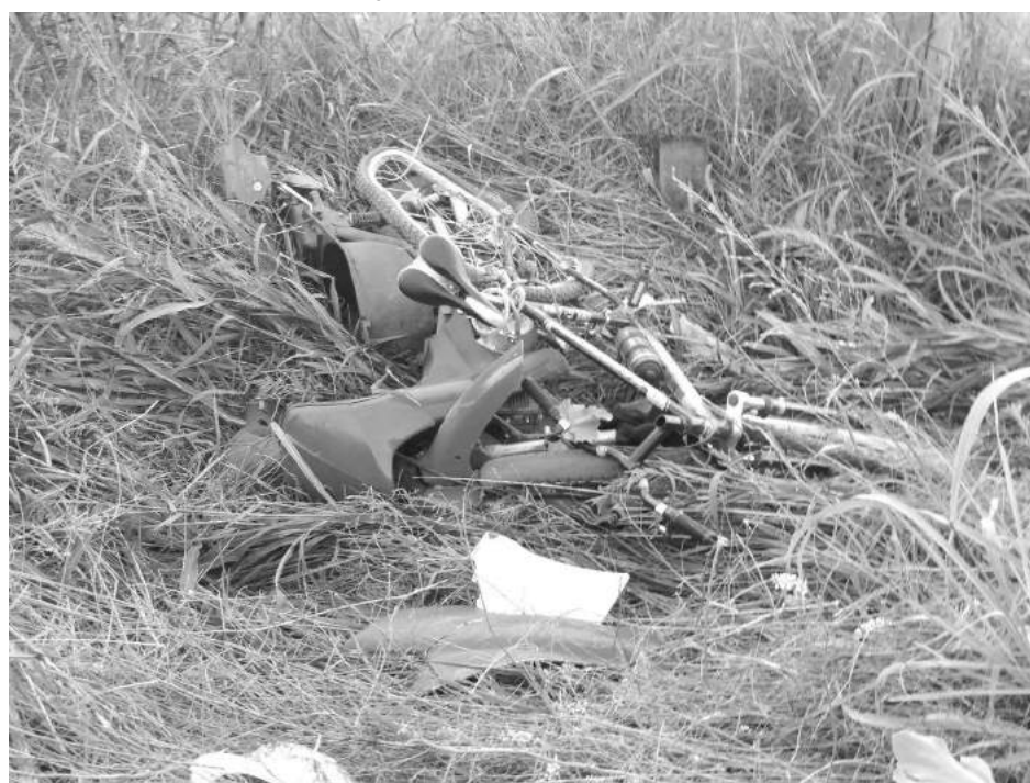
La moto y la bicicleta quedaron unidas y destrozadas como se ve en la imagen.