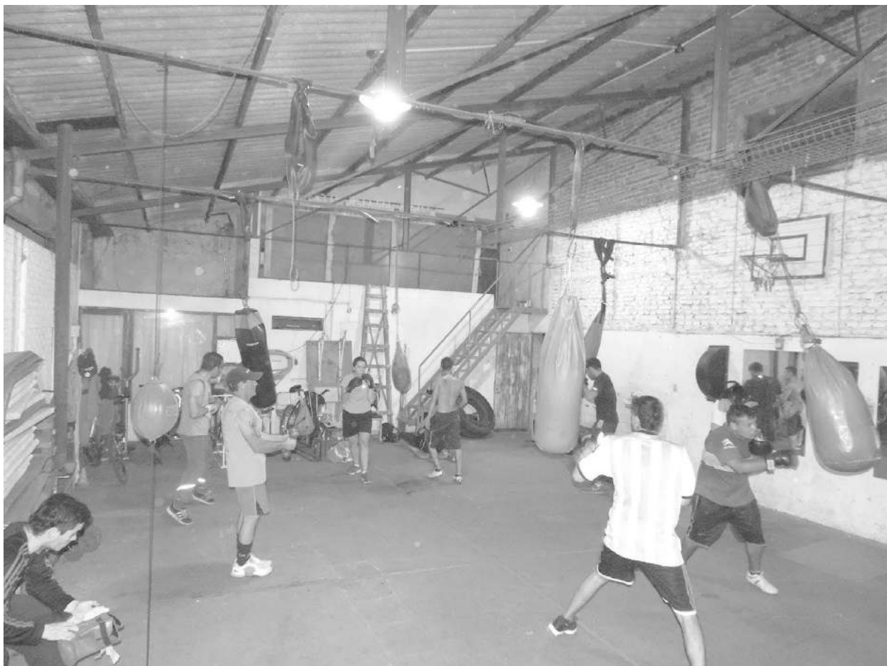
El gimnasio del Clan Ferrario a pleno con vistas al festival de box de esta noche.

Será en Centro Empleados de Comercio, desde las 22 hs. Inf. en Pág. 20.