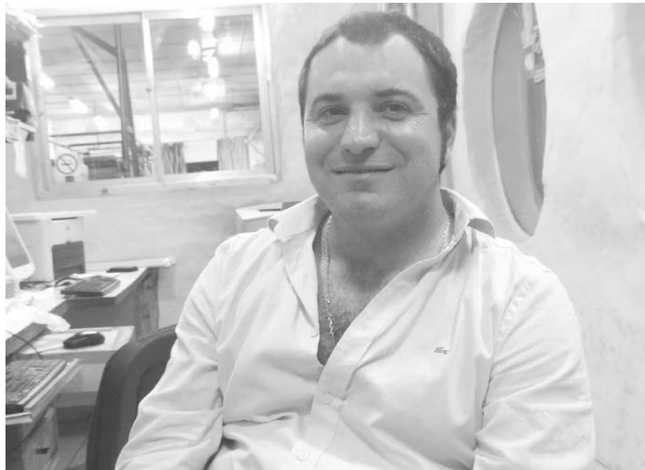
El concejal del FpV defendió la postura de su espacio político.

Además, dejó su preocupación sobre "la rotura de máquinas viales que han manifestado los funcionarios del área de Obras y Servicios Públicos, fundamentalmente porque estamos viendo que hay barrios y localidades que se hallan totalmente abandonados en lo que hace a mantenimiento y corte de malezas, como los vecinos de diferentes sectores y comunidades del interior nos lo han manifestado en nuestro bloque".