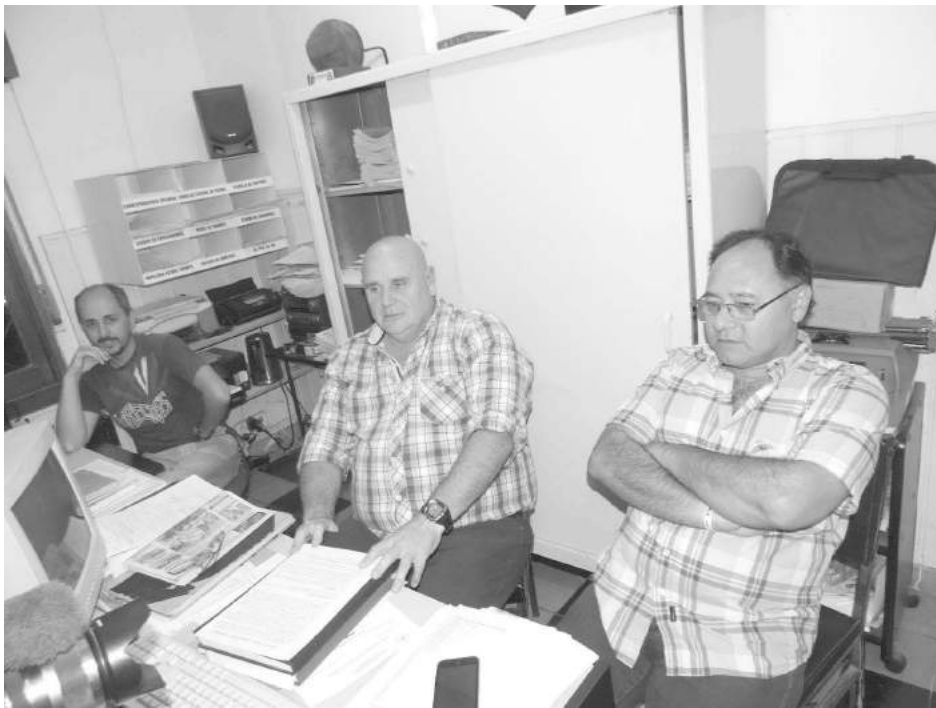
El próximo domingo dará comienzo un nuevo torneo de fútbol.