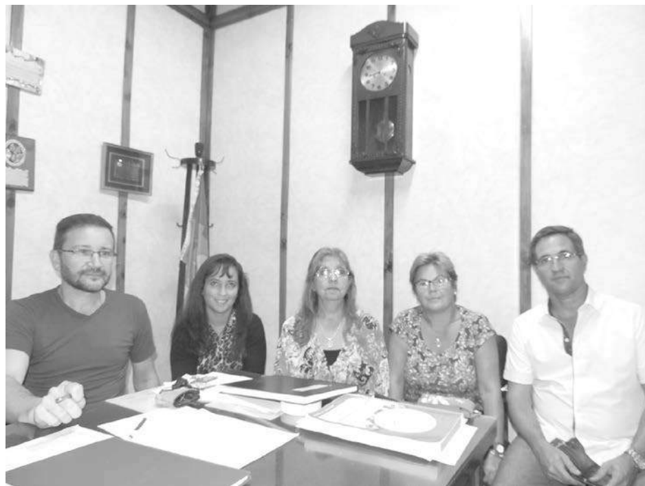
En conferencia de prensa, directivos y profesores explicaron la propuesta educativa.