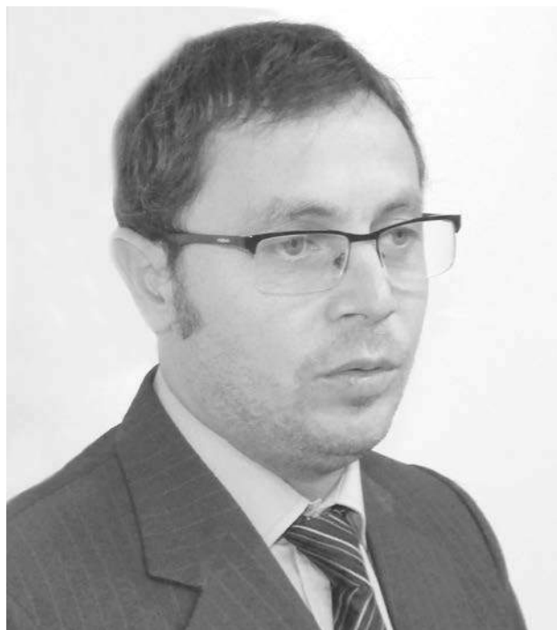
Diputado provincial Mauricio Vivani.

El legislador trazó un análisis del discurso de la Gobernadora en la apertura de las sesiones legislativas.