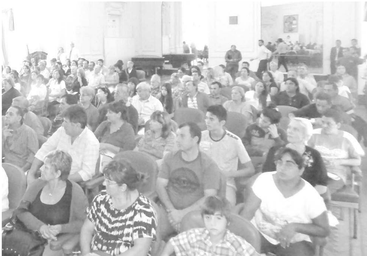
Vecinos que participaron del acto de firma de escrituras.