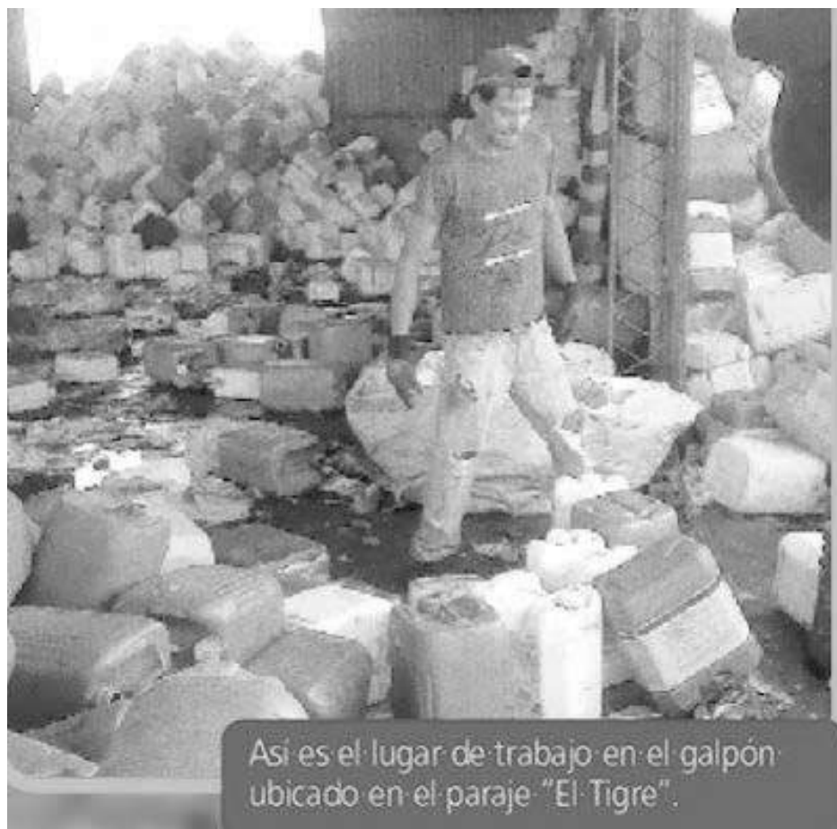
Así es el lugar de trabajo en el galpón ubicado en el paraje "El Tigre".

El no cumplimiento de las normas laborales para el tratamiento de bidones de agroquímicos puede generar un dolor de cabeza al intendente de Pehuajó, Pablo Zurro. Es que un ex empleado de la Policía Bonaerense presentó una denuncia en la que detalla el maltrato de empleados paraguayos en un galpón ubicado en el distrito, en donde se limpiaban estos bidones de manera ilegal. A pesar de tratarse de un galpón de un privado, el denunciante y los emplea-