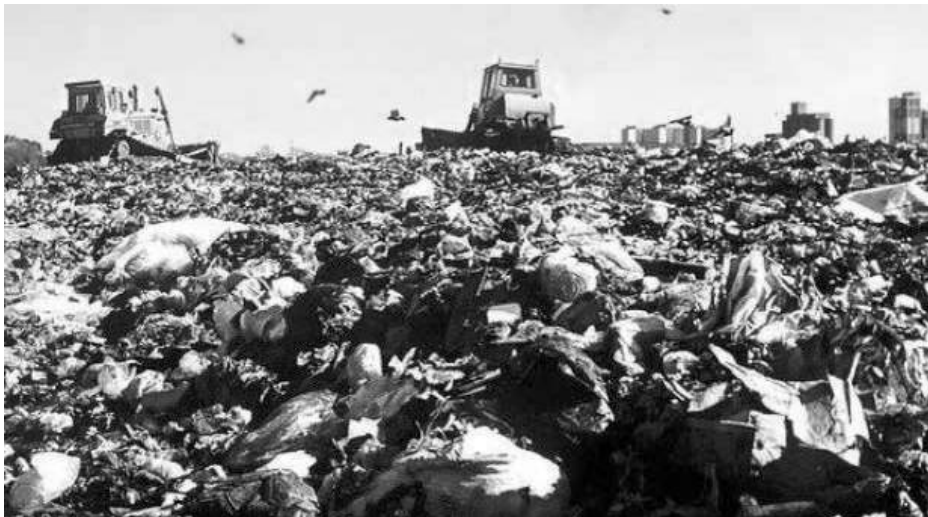
Las gaviotas y las maquinas revolviendo la basura una postal cotidiana del relleno sanitario de Punta Lara.

En La Plata, se encuentran esperando la construcción de una planta de tratamiento que remplace un enorme relleno sanitario ubicado en Punta Lara. Junín trabajan en un proyecto para reconvertir el actual basural en un Relleno Sanitario. En Lincoln, tienen una planta de reciclado pero sin funcionar. Y en Chacabuco, cuentan con una planta nueva pero deben sanear el viejo sumidero.