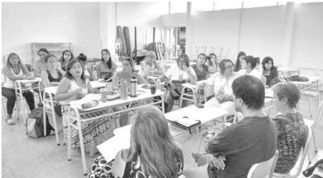
El encuentro tuvo lugar en el edificio de la Fundación Universitaria.