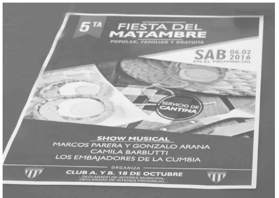
Afiche de promoción de la 5ta. Fiesta del Matambre.