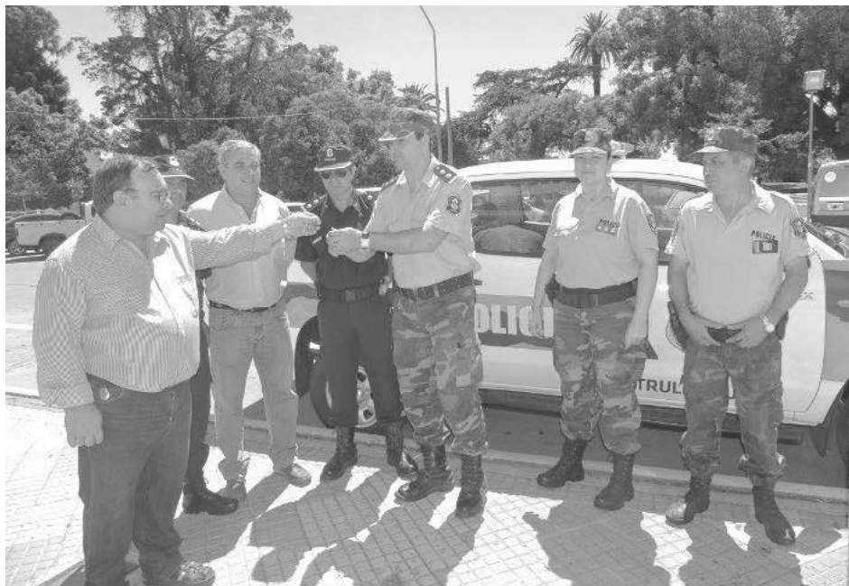
Autoridades municipales y policiales participaron del acto.