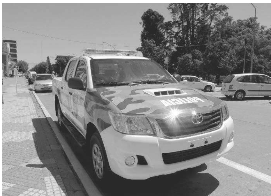
Vista de la unidad entregada a 9 de Julio.

patrullero en base a las gestiones realizadas ante el ministro de Seguridad bonaerense, Cristian Ritonzo, a la vez que adelantó que se gestiona otro nuevo