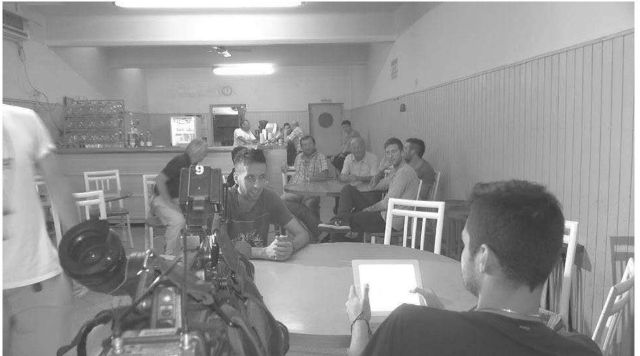
La producción de TyC y un equipo de exteriores presentes en el Club Social y Deportivo Dudignac.