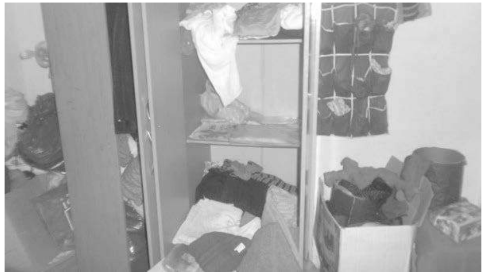
No se suministró aún informe policial de lo ocurrido.