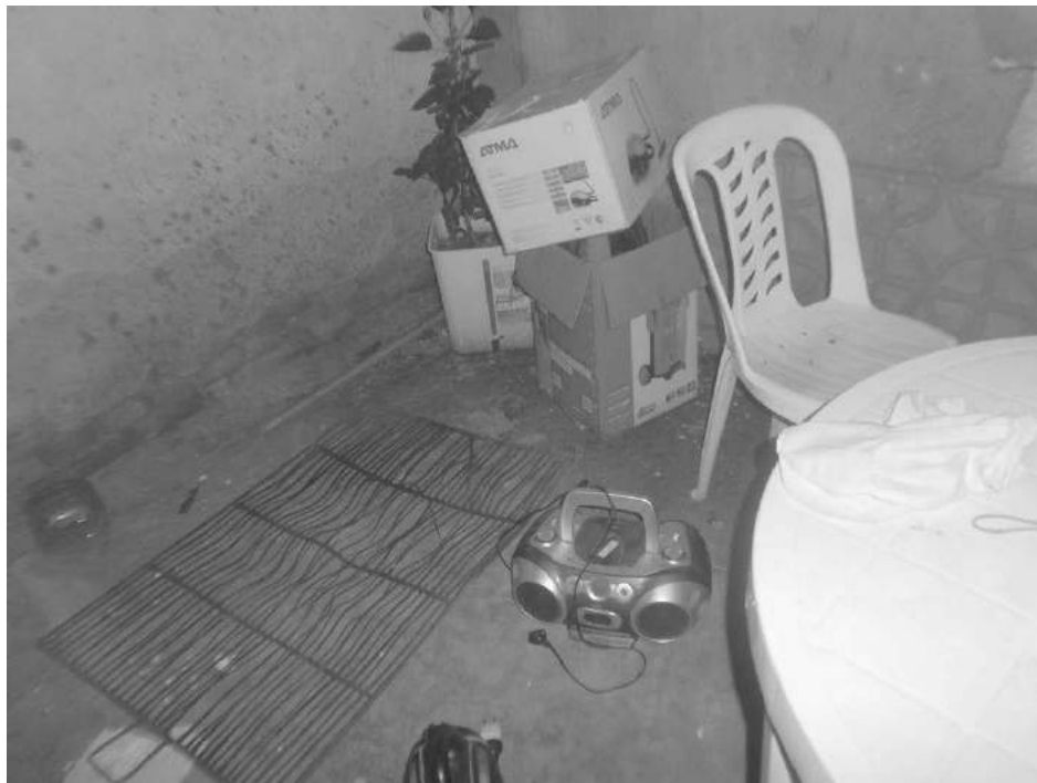
Los delincuentes aprovecharon la ausencia de los moradores para robar.