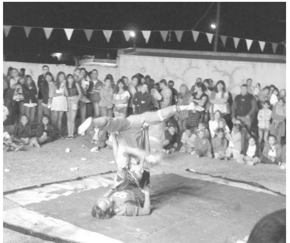
Vecinos de la localidad acompañaron la noche de kermesse.