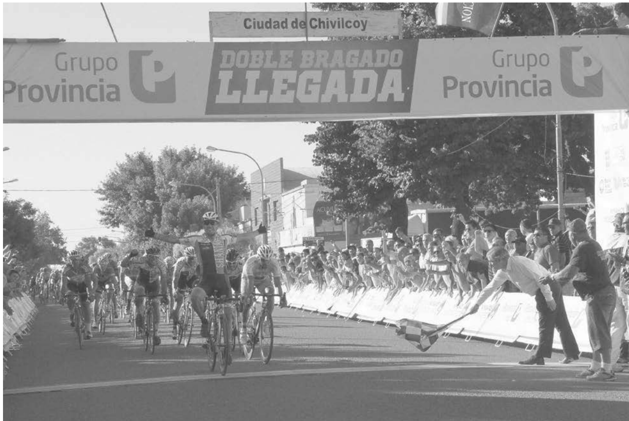
El ciclista chileno levanta los brazos al ganar la segunda etapa de la Doble Bragado.