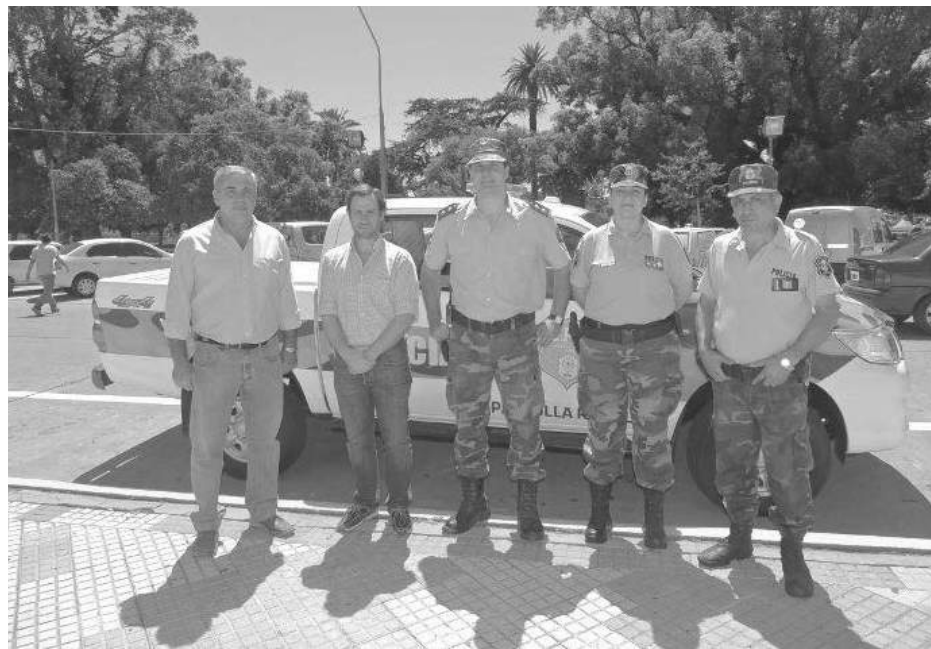
Integrantes de Patrulla Rural junto a autoridades municipales y de Sociedad Rural.